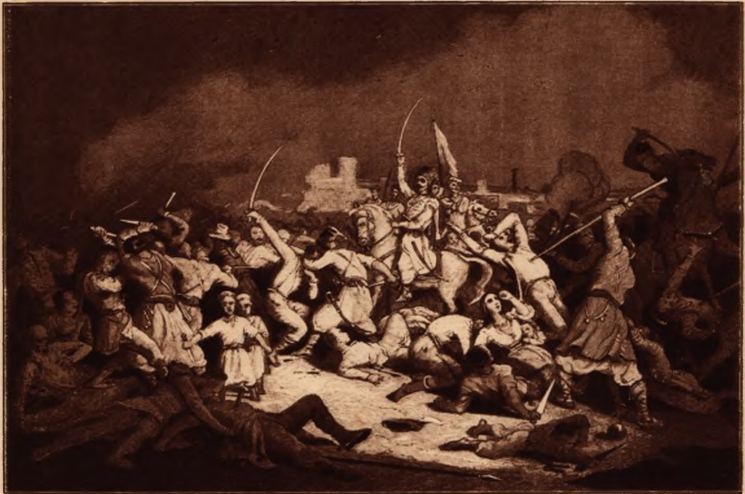
Бенкет у Лисянці, (Старосвітський будинок.)