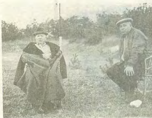
«После окончания фазаньей охоты Н. С. Хрущев заявил, что завтра уезжает в Пицунду. До Октябрьского Пленума осталось 11 дней». 3 октября 1964 г.