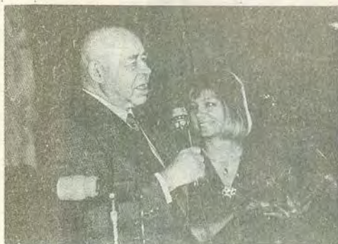
Выступление на авиазаводе, где когда-то работал. 1990 г.