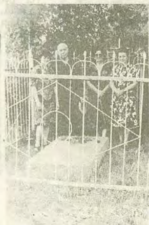
У могилы отца и матери в с. Андреевка. 1980 г.