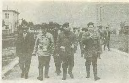
Среди шахтеров Донбасса.