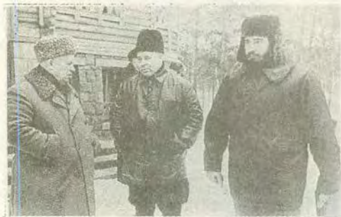
Н. С. Хрущев и Ф. Кастро у П. Е. Шелеста в охотничьем хозяйстве Залесье под Киевом, 22 января 1964 г.

Подписание Совместного соглашения. 9 апреля 1964 г. На втором плане стоят А. Громыко, Ю. Андропов, П. Шелест.