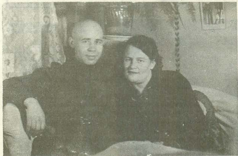
Петр Шелест со своей женой Любой. Канун войны.