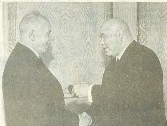
Н. В. Подгорный вручает П. Е. Шелесту орден Ленина и Золотую Звезду Героя Социалистического Труда, Москва. Февраль 1968 г.