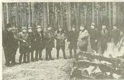
Перед началом охоты в хозяйстве Залесье под Киевом. Слева направо: Дрозденко, Скаба, Соболев, Шелест, Брежнев, Коротченко, Щербицкий, Комяхов, Ляшко, Грушецкий, Клименко, Цуканов. 22 октября 1965 г.