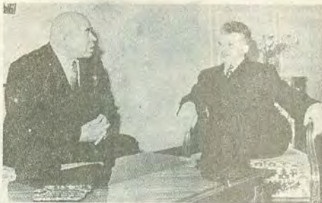
Встречи с Т. Живковым в Софии и Н. Чаушеску в Бухаресте.