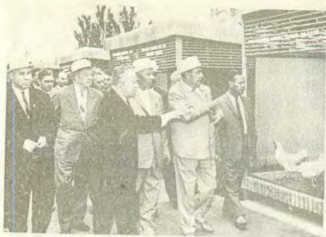
Л. И. Брежнев на осммотре выставки птицеводства. 25 августа 1966 г.