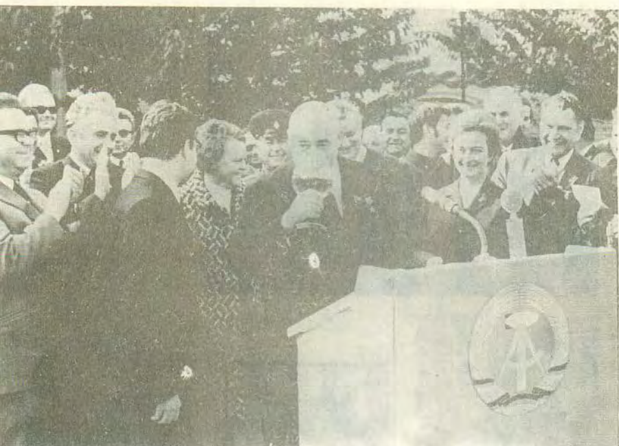
Бокал пива — в знак вечной дружбы.