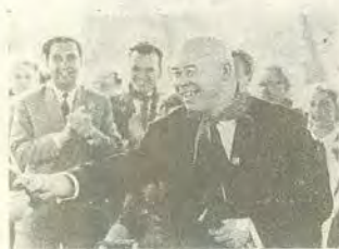
На открытии Дворца пионеров в Киеве.