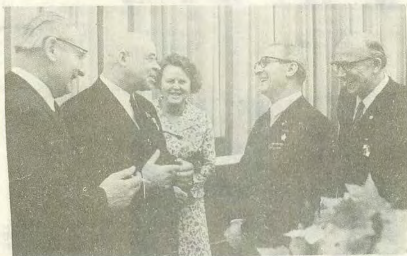
На приеме у Э. Хоннекера П. Е. Шелест согласовывает свою поездку к В. Ульянову.