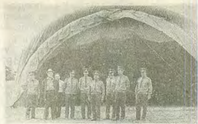
Среди военных летчиков. г. Вольск 1974 г.