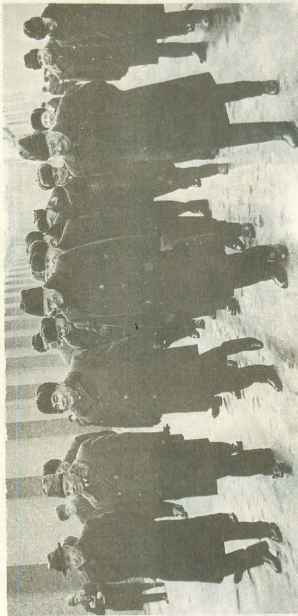
Руководители КПСС через полмесяца после снятия Н. С. Хрущева.