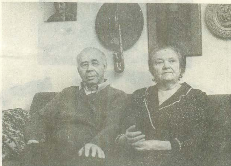
Петр Ефимович Шелест с женой Ираидой Павловной. Москва. 1993 г.