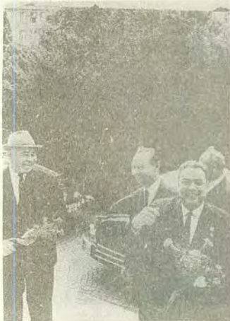
П. Шелест, А. Дубчек, Л. Брежнев, 1967 г.