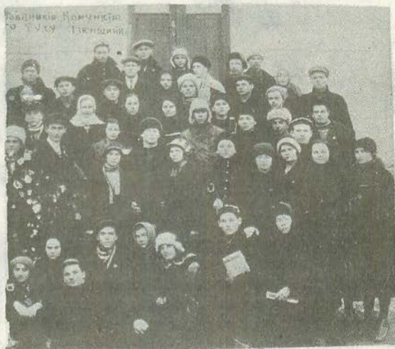
На окружном семинаре руководителей коммунистического детского движения, г. Изюм. 1927 г.