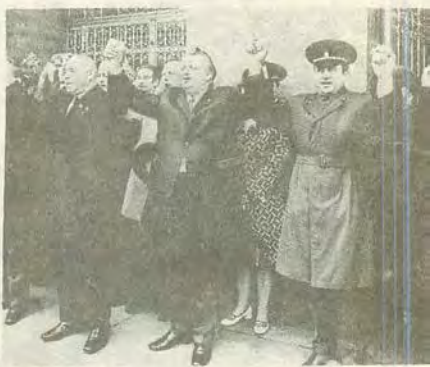
Скандирование лозунга «Дружба — Freundschaft» на митинге.