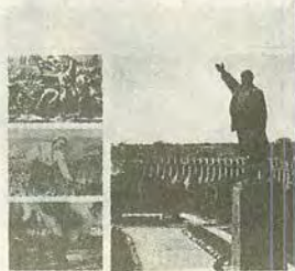
ГЮШЕЛЕСТ Україно наша Радянська