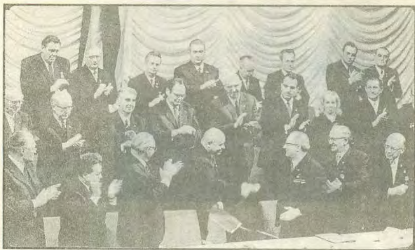
В президиуме торжественного собрания, посвященного 22-й годовщине ГДР Э. Хоннекер приветствует главу парламентской делегации СССР П. Е. Шелеста. Берлин. 6 октября 1971 г.