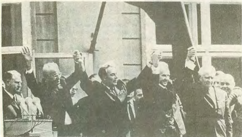
На митинге в Пражском кремле после окончания переговоров. Слева направо: Г. Гусак, Л. Брежнев, А. Косыгин, Л. Свобода. 7 мая 1970 г.

Переговоры делегаций СССР и ЧССР в связи с подписанием Договора. Справа — П. Шелест, Л. Брежнев, А. Косыгин, П. Машеров; слева — Л. Свобода, Г. Гусак, И. Штроугал. Май 1970 г.