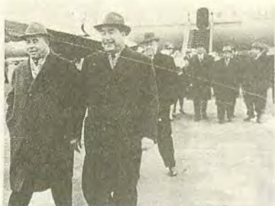
Приезд Первого секретаря ЦК КПСС Л. И. Брежнева на Украину для вручения городу-герою Киеву Золотой Звезды. 21 октября 1965 г.

Президиум торжественного собрания, посвященного вручению Киеву Золотой Звезды Героя. Слева направо: В. Дрозденко, Л. Брежнев, П. Шелест, Д. Коротченко, В. Щербицкий, А. Соболев, А. Ляшко, В. Комяхов, И. Грушецкий. 21 октября 1965 г.