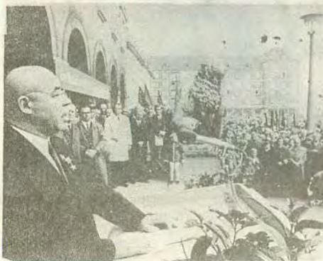
Выступление П. Е. Шелеста на 10-тысячном митинге. Дрезден. 8 октября 1971 г.