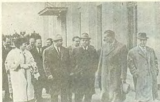
П. Е. Шелест среди делегатов ЦК КПСС, возглавляемых Суловым, отправляется на XVII съезд Французской коммунистической партии. 13 мая 1964 г.