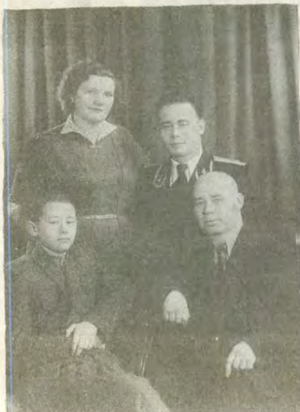
П. Е. Шелест с женой Ираидой Павловной и сыновьями. 1953 г.