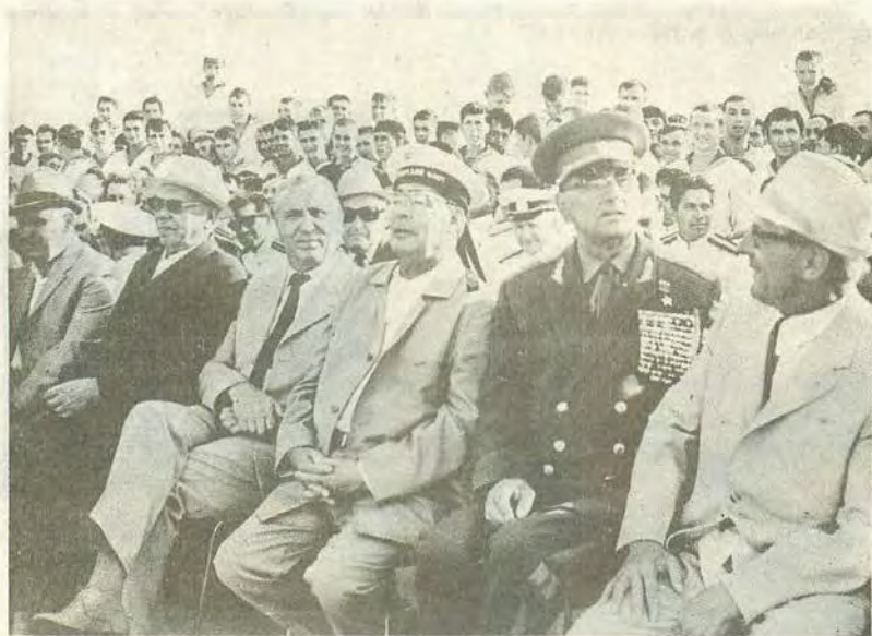
Маневры кораблей во время учения «Юг» с палубы корабля наблюдают Т. Живков, Н. Подгорный, Э. Герек, Л. Брежнев, А. Гречко, Э. Хоннекер. Август 1971 г.