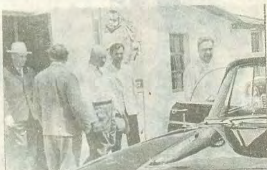
Л. И. Брежнев и П. Е. Шелест отправляются в поездку ознакомиться с хозяйствами колхозов «Дружба народов» и «Россия», а главное, поговорить о «деле». Июль 1964 г.