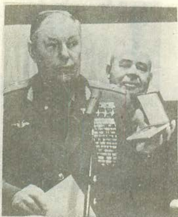
Маршал авиации А. И. Покрышкин и П. Е. Шелест.