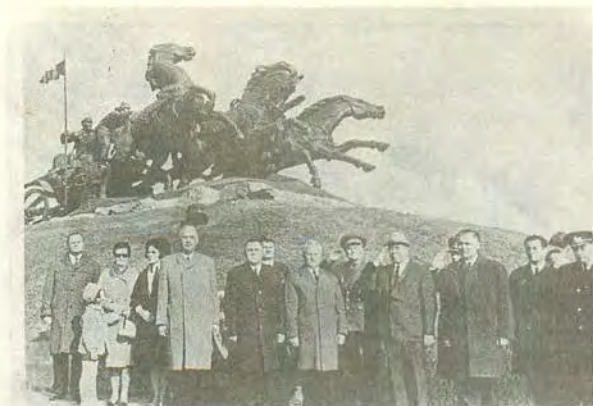
Открытие памятника легендарной тачанке в Каховке Херсонской области. 1970 г.