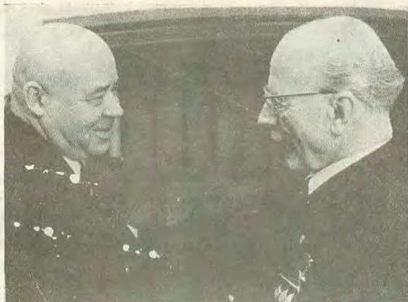
Встреча с В. Ульбрихтом состоялась на даче под Берлином.