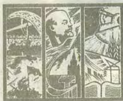
Die historische Mission der Jugend