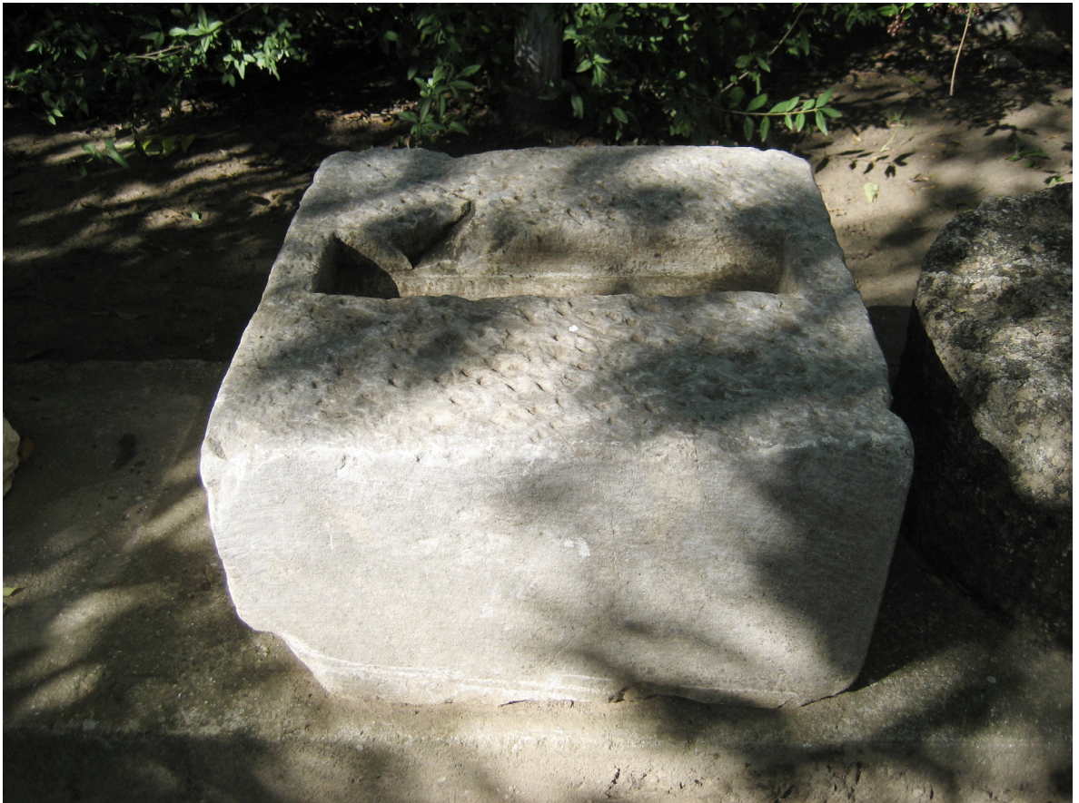
Рис. 1 та 2