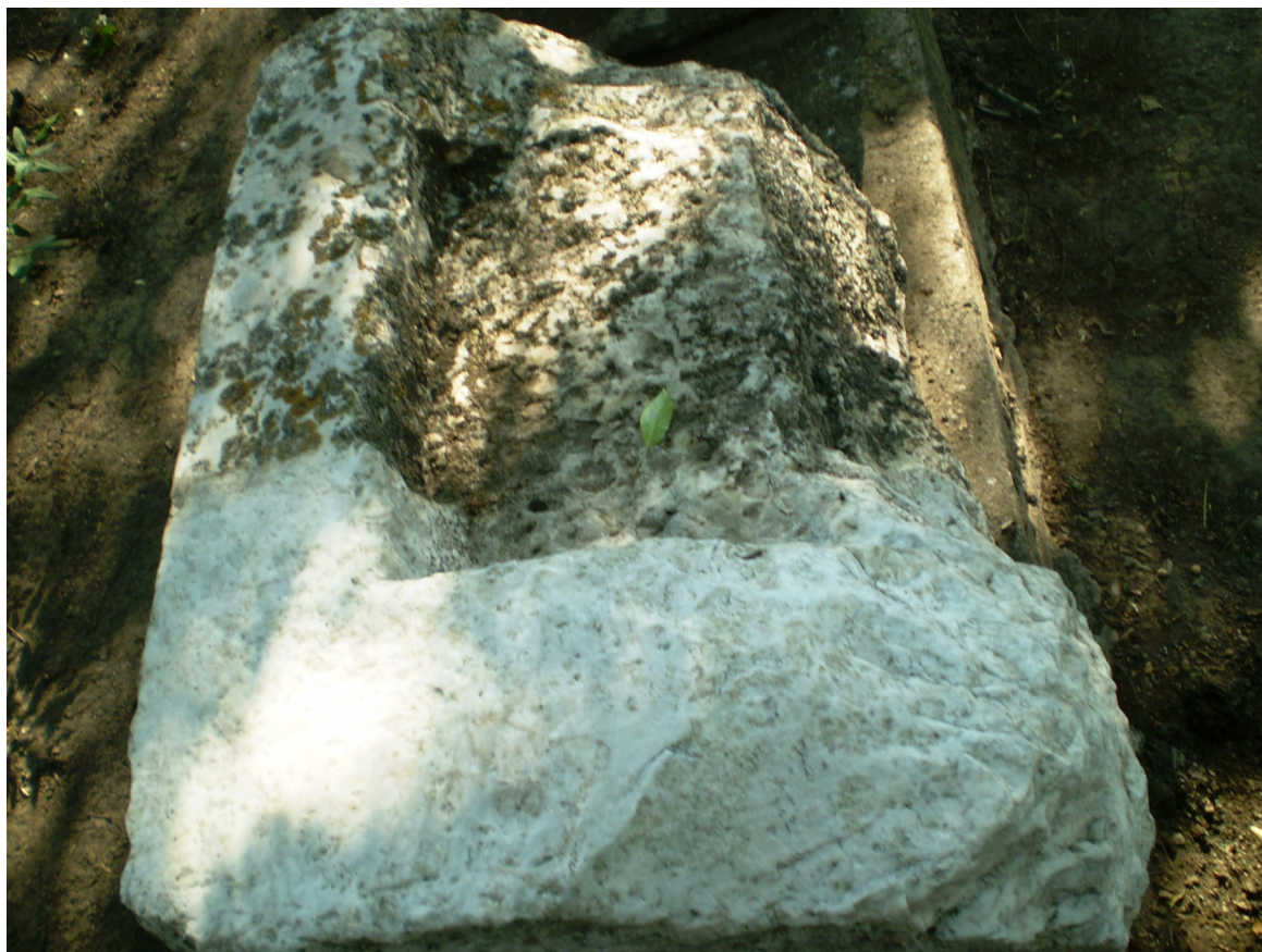
Рис. 5 та 6