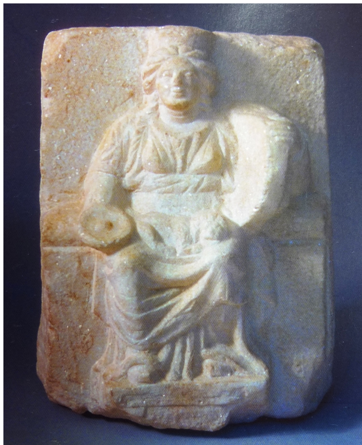
Рис. 3 та 4