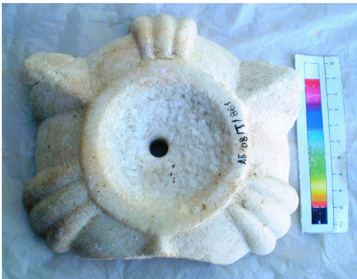
Рис. 7 та 8