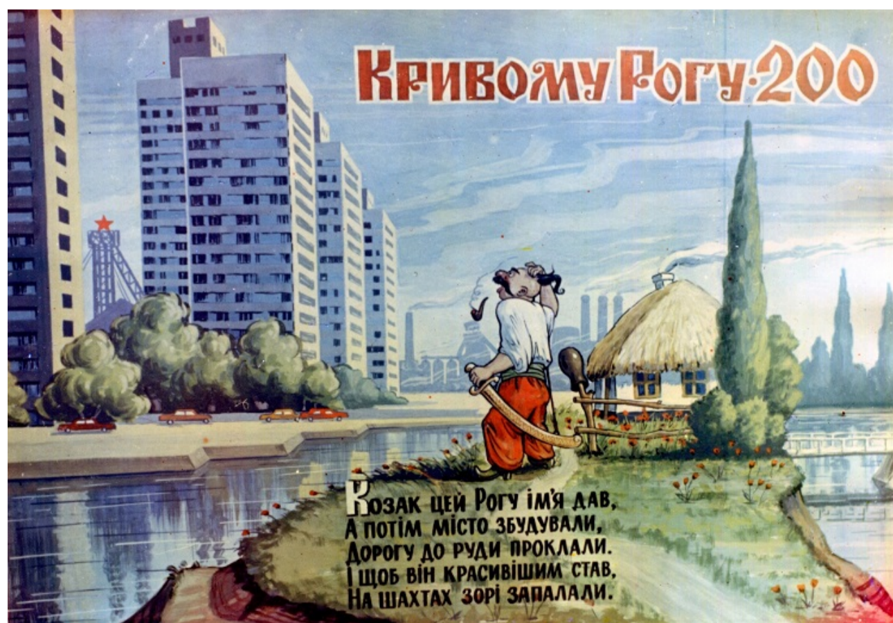
Плакати на честь 200-річчя Кривого Рогу (1975).