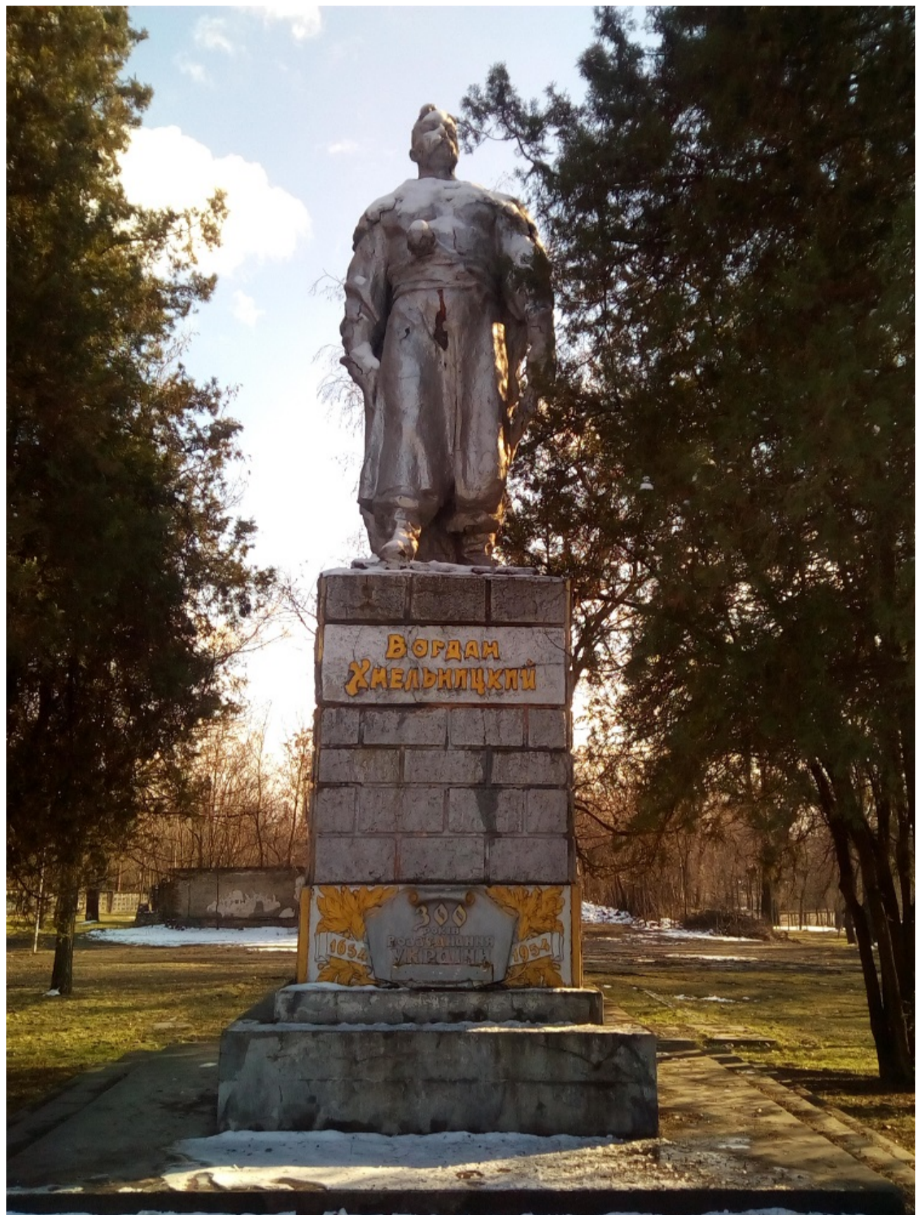
Пам'ятник Богдану Хмельницькому у сквері поблизу стадіону «Металург» (1954). (7 березня 2021 р.)

Власне, лише з початку 1970-х рр. у Кривому Розі і почалося наукове вивчення доіндустріального етапу його буття. За тодішніми знахідками, поселення веде своє коріння від заснованої наприкінці квітня 1775 р. поштової станції, яка обслуговувалася запорожцями. І за останні півсторіччя історіографічна ситуація у цьому плані мало змінилася. Найповнішим синтетичним викладом міської історії досі лишається відповідний розділ з «Истории городов и сел УССР» (1977), хоча місцеві історики та краєзнавці досить плідно працюють над вивченням сюжетів кінця XIX – XX ст. [1]