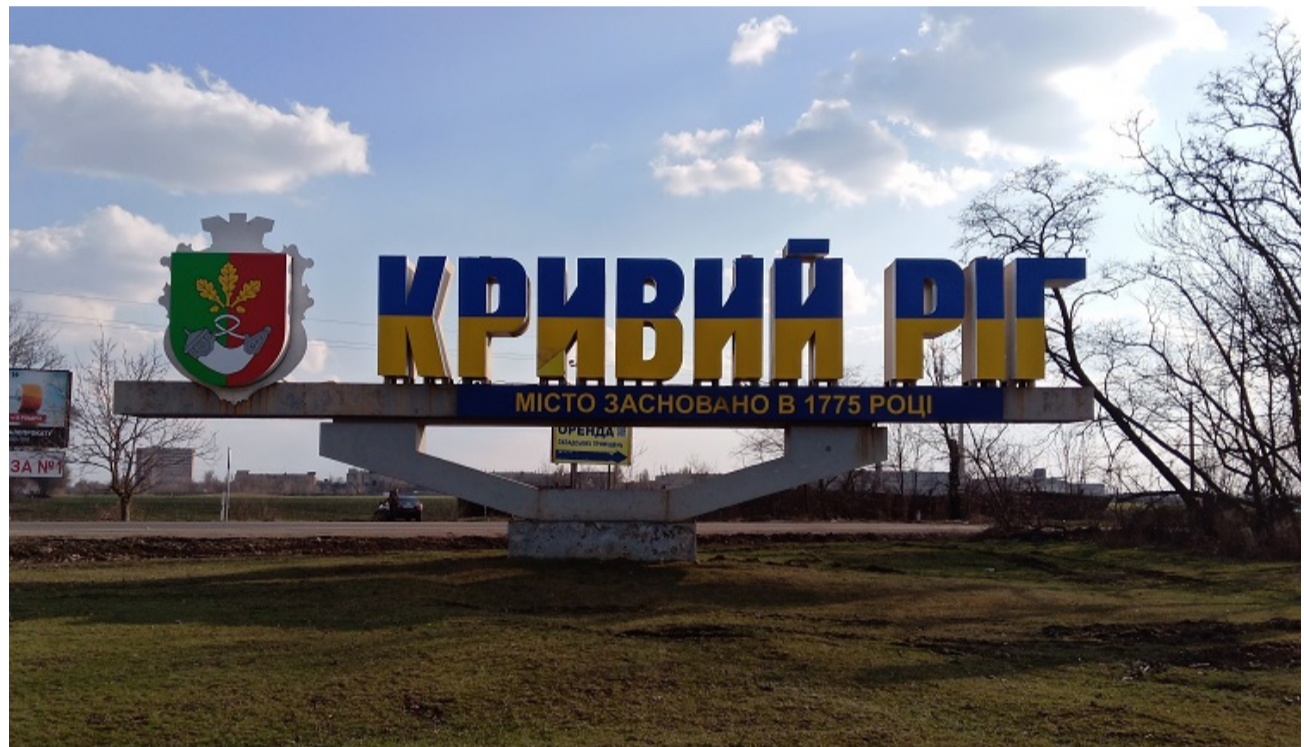
Кривий Ріг. В'їзд з боку м. Кропивницького. (28 березня 2021 р.)

Прямуючи якимось з основних шляхів, на в'їзді до Кривого Рогу, подорожувальник зустріне стелу, що складається з назви міста, герба – центральним елементом якого є козацька порохівниця-ріг, та вказівки: «місто засновано в 1775 році». Вже з першого моменту зустрічі населений пункт вказує на своє козацьке походження (на яке, втім, підсвідомо натякає і сама його назва).