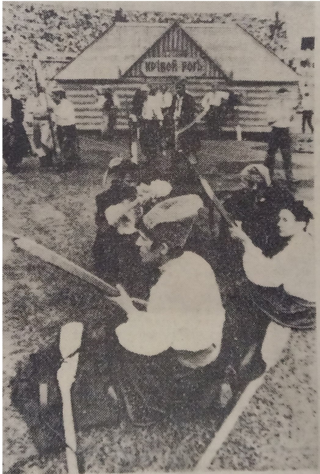
Інсценування заснування поштової станції під час відзначення 200-річного ювілею Кривого Рогу, 24 травня 1975 р.