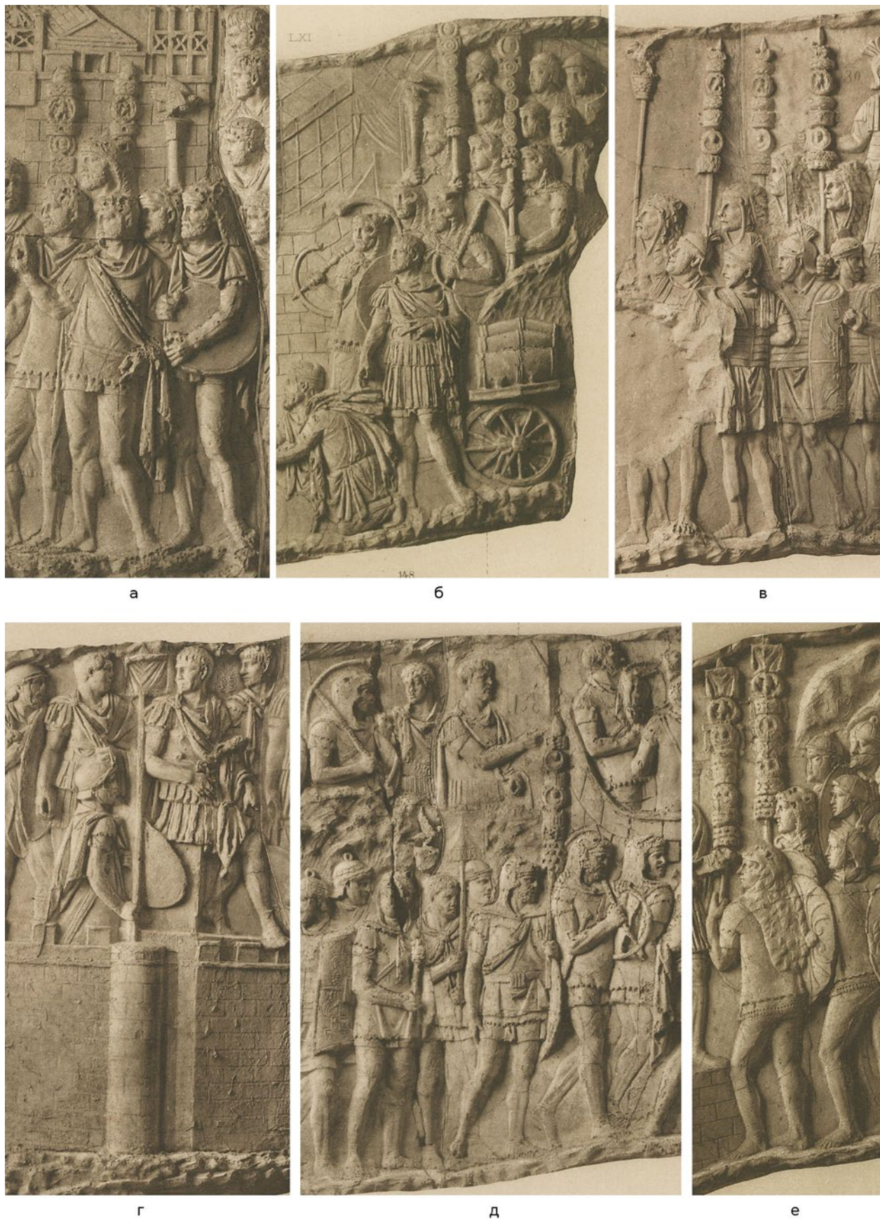
Мал. 3. Фрагменти Колони Траяна (за Conrad Cichorius): (а) – аркуш XXXVII (Cichorius 1896); (б) – аркуш XLII (Cichorius 1896); (в) – аркуш LXXVII (Cichorius 1900); (г) – аркуш LXXVIII (Cichorius 1900); (д) – аркуш LXXIX (Cichorius 1900); (е) – аркуш С (Cichorius 1900).