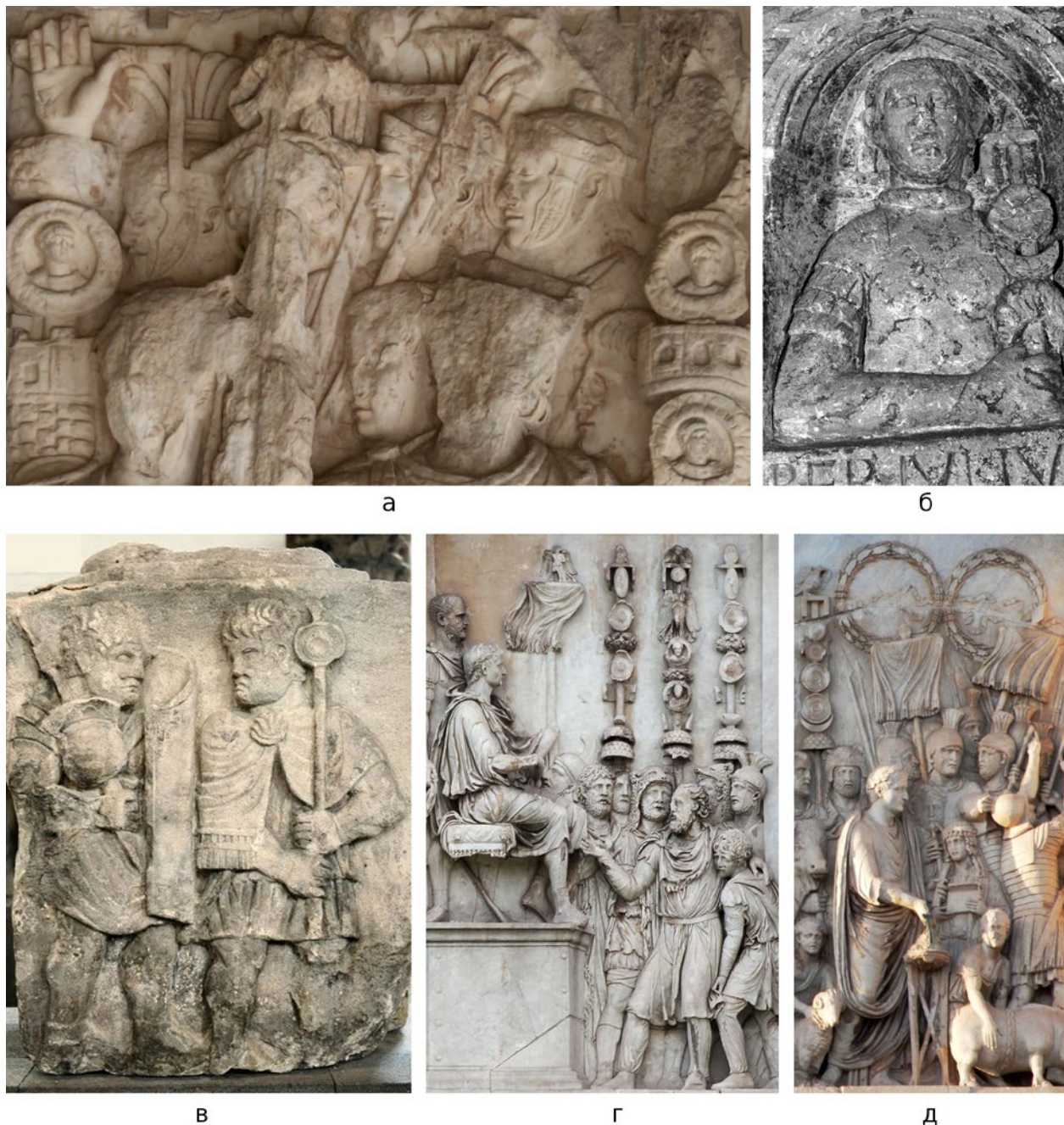
Мал. 5. (а) – Преторіанські прапороносці з рельєфу галереї Боргезе; (б) – надгробок сигніфера Tib. Iulius Pancuius (© Mike Bishop); (в) – сигніфер з Майнцького рельєфу; (г) – рельєф арки Константина (© David Castor); (д) – рельєф арки Константина.

(Domaszewski 35; “Roman standard-bearer”). На деяких зображеннях аквіліфери та сигніфери легіонів показані просто у шоломах, з наверхів яких звисають кінські хвости – це показано, зокрема, на сестерції імператора Гальби (Мал. 4, а) (“RomanEmp”). У той же час, деякі з легіонних аквіліферів та сигніферів взагалі показані без шкір, у плащах і без шоломів. Так, наприклад, показано сигніфера