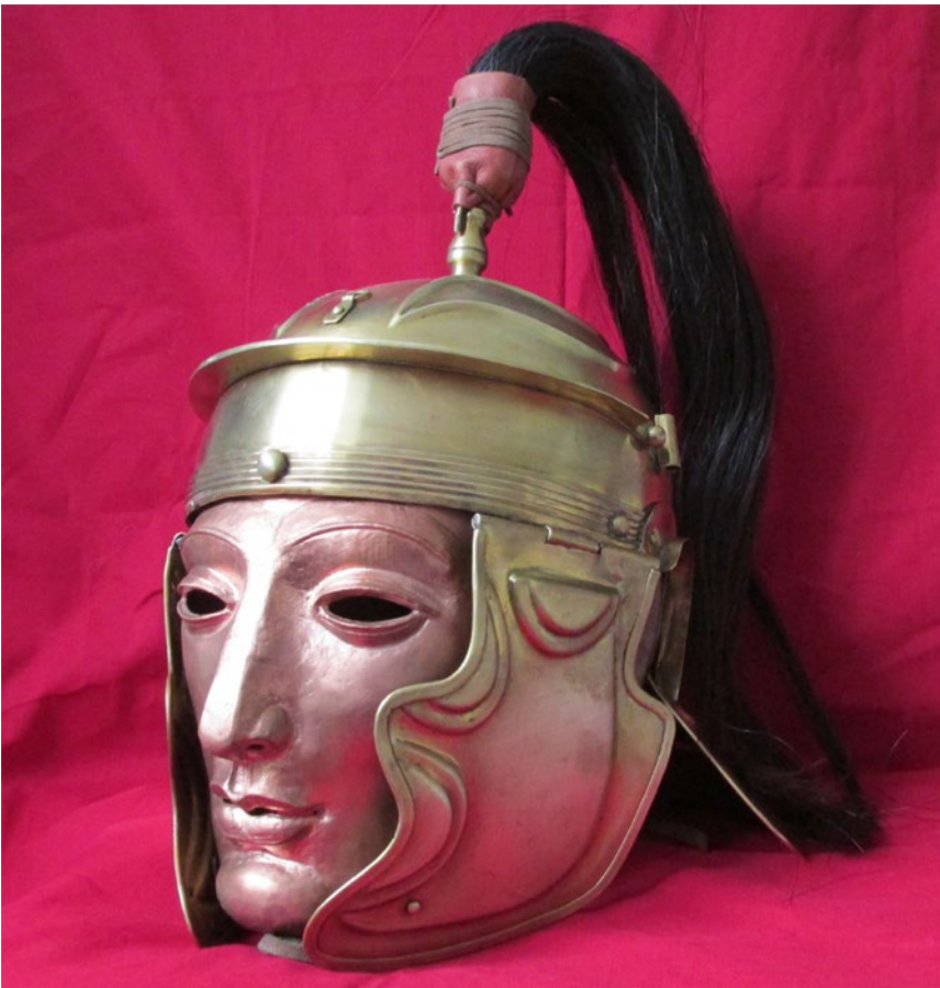
Мал. 8. Шолом з чеканною мідною маскою і кінським хвостом, прикріпленим до навершя.