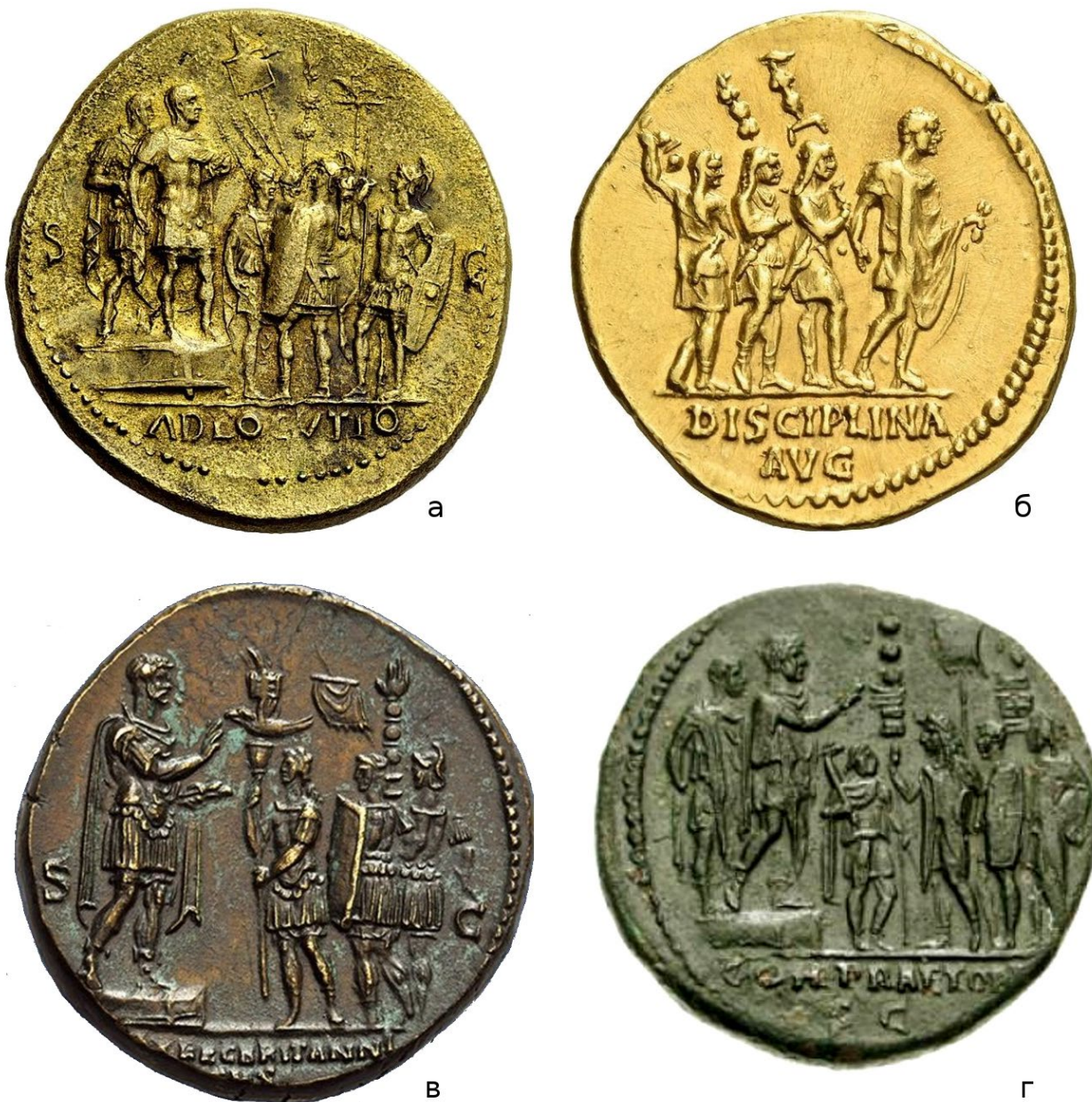
Мал. 4. (а) – Сестерцій імператора Гальби (68–69 рр.); (б) – ауреус імператора Адріана (134–138 рр.); (в) – сестерцій імператора Адріана, (г) – сестерцій імператора Адріана (134–138 рр.).

та сiгнiфера на монетi iмператора Адрiана з зображенням прапороносцiв британських легiонiв (Мал. 4, б). На iншiй монетi Адрiана показано сiгнiфера преторiанцiв у короткiй шкурi та плащi, за ним стоiть вексиларiй преторiанської когорти або якогось легiону з непокритою головою (Мал. 4, в). Шкура на цих зображеннях, як i на багатьох iнших, покриває лише голови та плечi. Вкрай рiдко, як ми вже зауважили ранiше, показанi на рельєфах шоломи пiд шкурами в прапороносцiв легiонiв та когорт. Наприклад, шолом є на надгробку