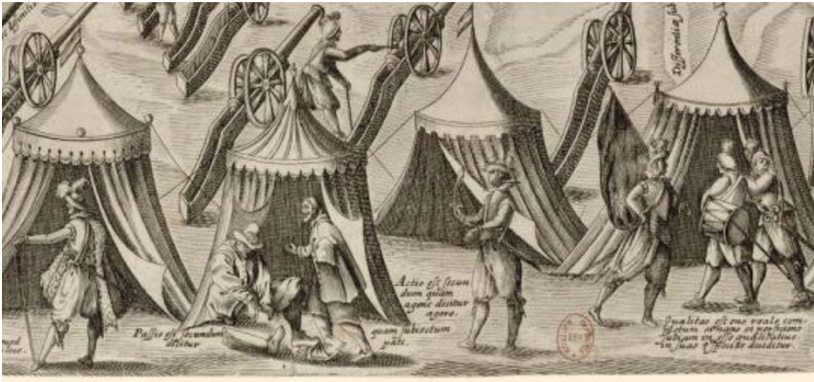
Мал. 9. Гравюра « Vue de La Rochelle », 1628-1629 pp.

регіональні відмінності в деталях костюму цілком простежуються.