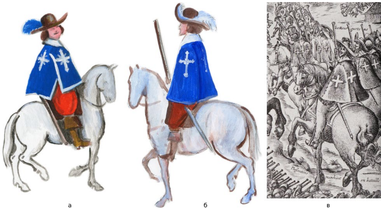
Мал. 3. (а) – Мушкетер з панелі в будинку Рішельє «Siège de La Rochelle» (промальовка автора); (б) – мушкетер з панелі в будинку Рішельє «Réduction de Nîmes, 4 juillet 1629» (промальовка автора); (в) – гравюра Абрахама Босса «Облога Корбі 1636 року».

закінчуються квіткою лілії, полум'я з золота. На всіх плащах « casaque » по краю є велика срібна тасьма. У тексті акцентують увагу на великих хрестах і полум'ї з золота по кутах, але, судячи з зображень, у різні періоди вони бували різних видів. Як бачимо, в описах декору плащів знов відсутній такий елемент декору, як червоні язички полум'я – флами. Флам не видно на картині «Réduction de Nîmes, 4 juillet 1629» (Мал. 3, б) («Réduction de Nîmes»). Вперше флами, вочевидь срібні або білі велюрові, показані на живописній панелі з будинку Рішельє «Siège de La Rochelle» (Мал. 3, а) («Siège de La Rochelle»), яку, вірогідно, виконали на початку 30-х рр. XVII ст. На гравюрі «Облога Корбі 1636 року» авторства, ймовірно, Абрахама Босса (Мал. 2, б) («Map of the siege of Corbie»), у мушкетерів на плащах показано всього по одній хвилястій фламі, яка виходить з чотирьох кутів хреста. Так само по одній фламі показано на іншій гравюрі на тему тієї ж облоги (Мал. 3, в) (Chartrand 18; «Louis XIII (1601-1643)»). На малюнку «tre figure di moschettieri, due in piedi in duello» авторства Стефано делла Беллі, із зібрання галереї Уфіцци (Galleria degli Uffizi), на плащі мушкетера є хрести, але флами знову не показані (Мал. 4, б) («tre figure di moschettieri»).