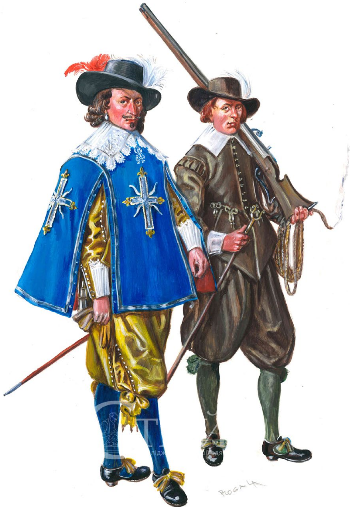
Мал. 5. Мушкетер зі слугою, 1627-1630-і роки (малюнок автора).