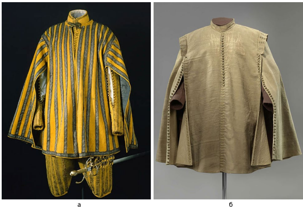
Мал. 8. (а) – Плащ драбанта короля Густава Адольфа; (б) – плащ Ернста Казимира, 1632 р..

GNM) в Нюрнберзі (Мал. 7, а) («Umhang (T549)»), або плащ Ернста Казимира, в якому він був у день смерті під час облоги Рурмонду в 1632 р. (Мал. 8, б) («Ruitermantel van Ernst Casimir I»). Судячи з історичних джерел та зображень епохи, поверх плаща нічого більш не одягали: ані портупей, ані перев'язів з ладунками, що не дивно, адже плащ був розшитий шовком та галунами.