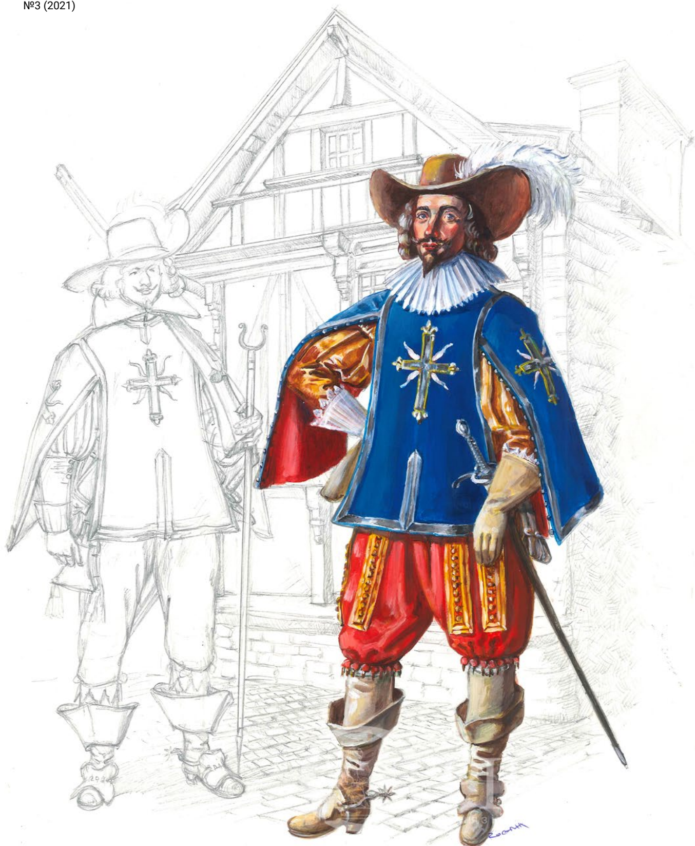
Мал. 6. Мушкетер, 1628-1630-і роки (малюнок автора).