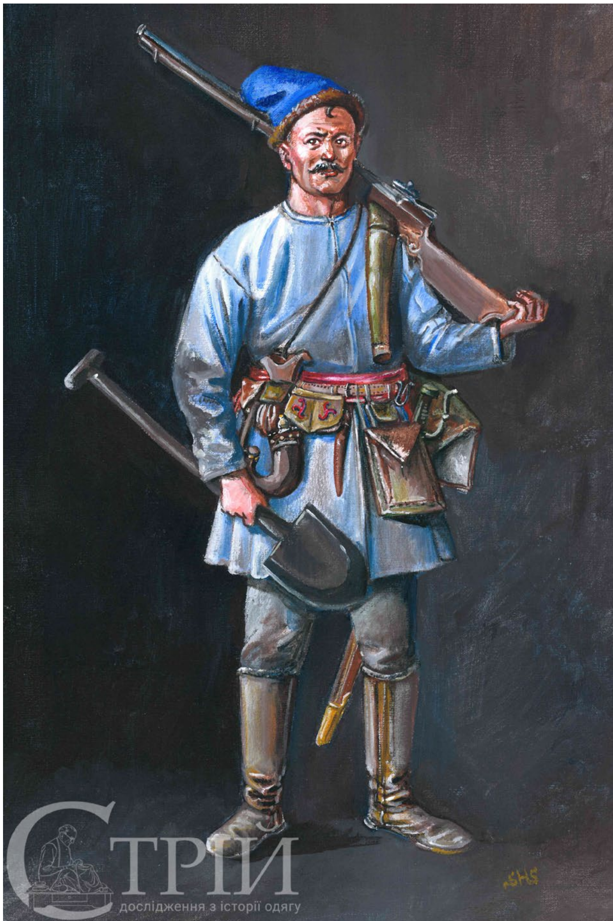
Мал. 6. Запорозький козак з самопалом та лопатою, перша половина XVII ст. (малюнок автора).