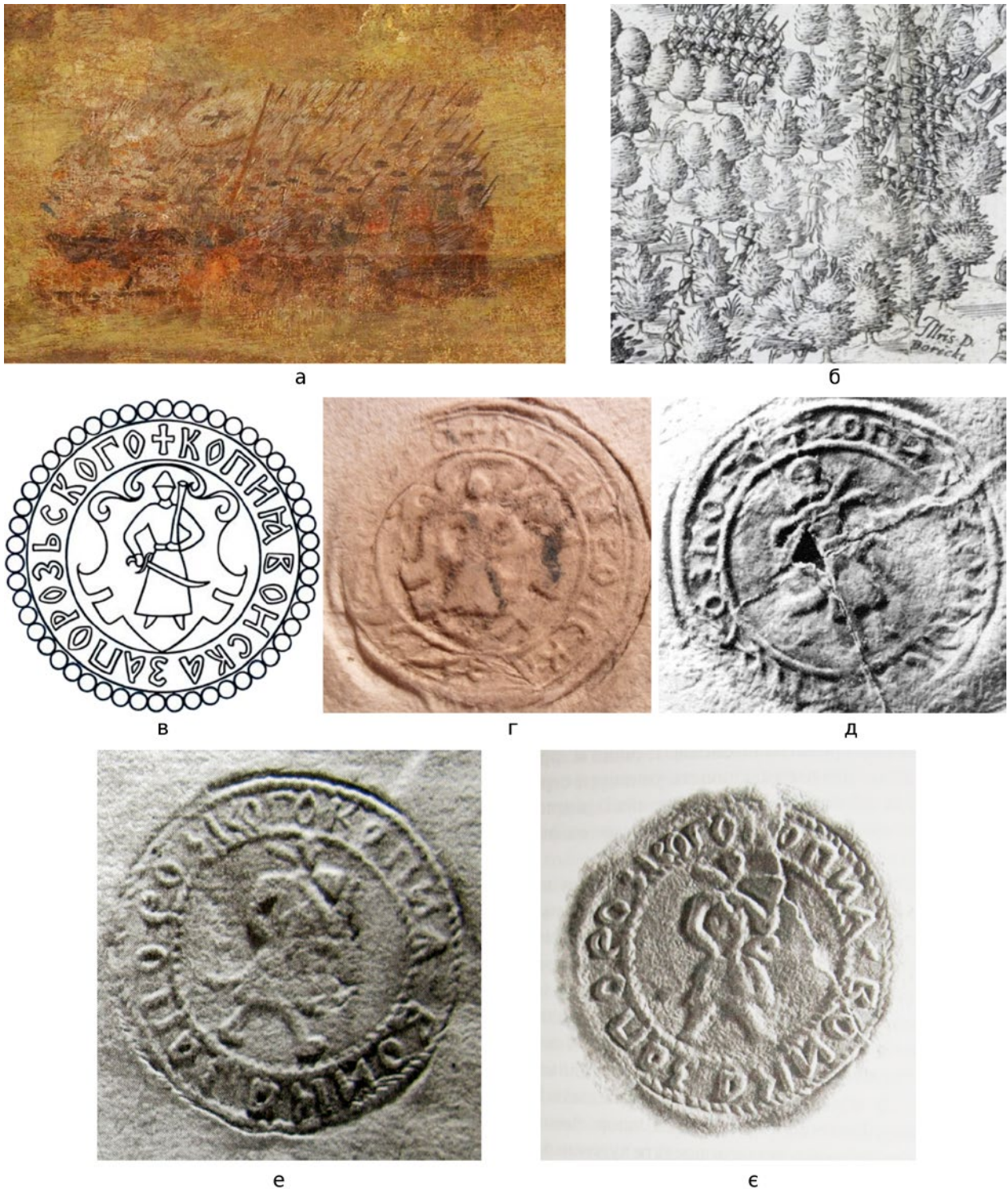
Мал. 3. (а) – Фрагмент картини «Битва під Клушино» 1620-х рр. Симона Богушовича; (б) – фрагмент гравюри «Битва під Клушино» 1610 р., авторства Філіпа Якуба по малюнку Теофіла Шемберга; (в, г) – відбиток печатки 1592–1597 рр.; (д) – відбиток печатки Війська Запорізького Гаврили Крутневича 1600–1603 рр.; (е) – відбиток печатки на листі гетьмана П. Сагайдачного до литовського гетьмана К. Радзивілла, 13(23).I.1622 р.; (є) – відбиток печатки на листі гетьмана А. Гавриловича до коронного підканцлера Т. Замойського, 4.IX.1632 р.