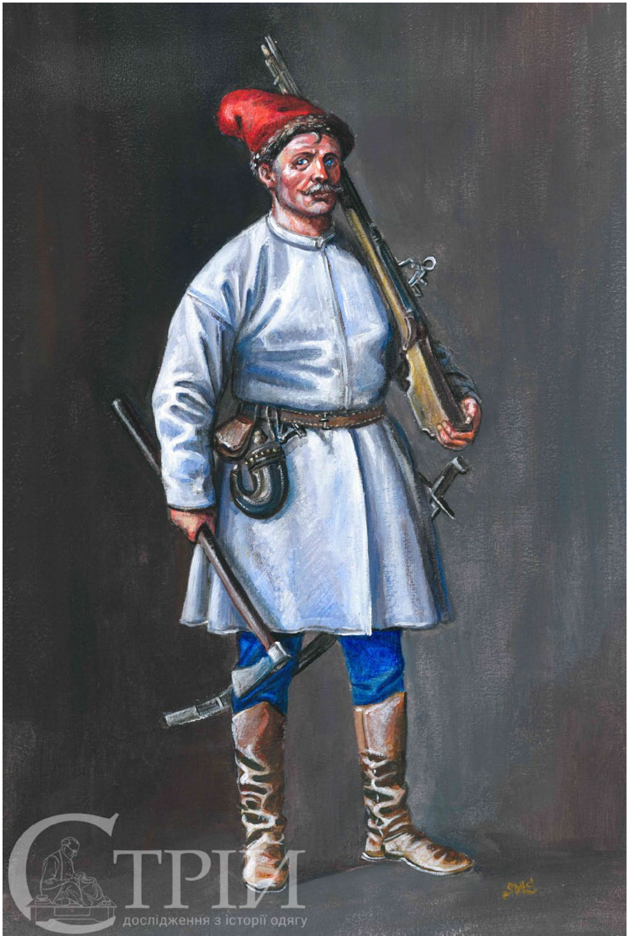
Мал. 5. Запорозький козак з самопалом та сокирою, кінець XVI – перша чверть XVII ст. (малюнок автора).