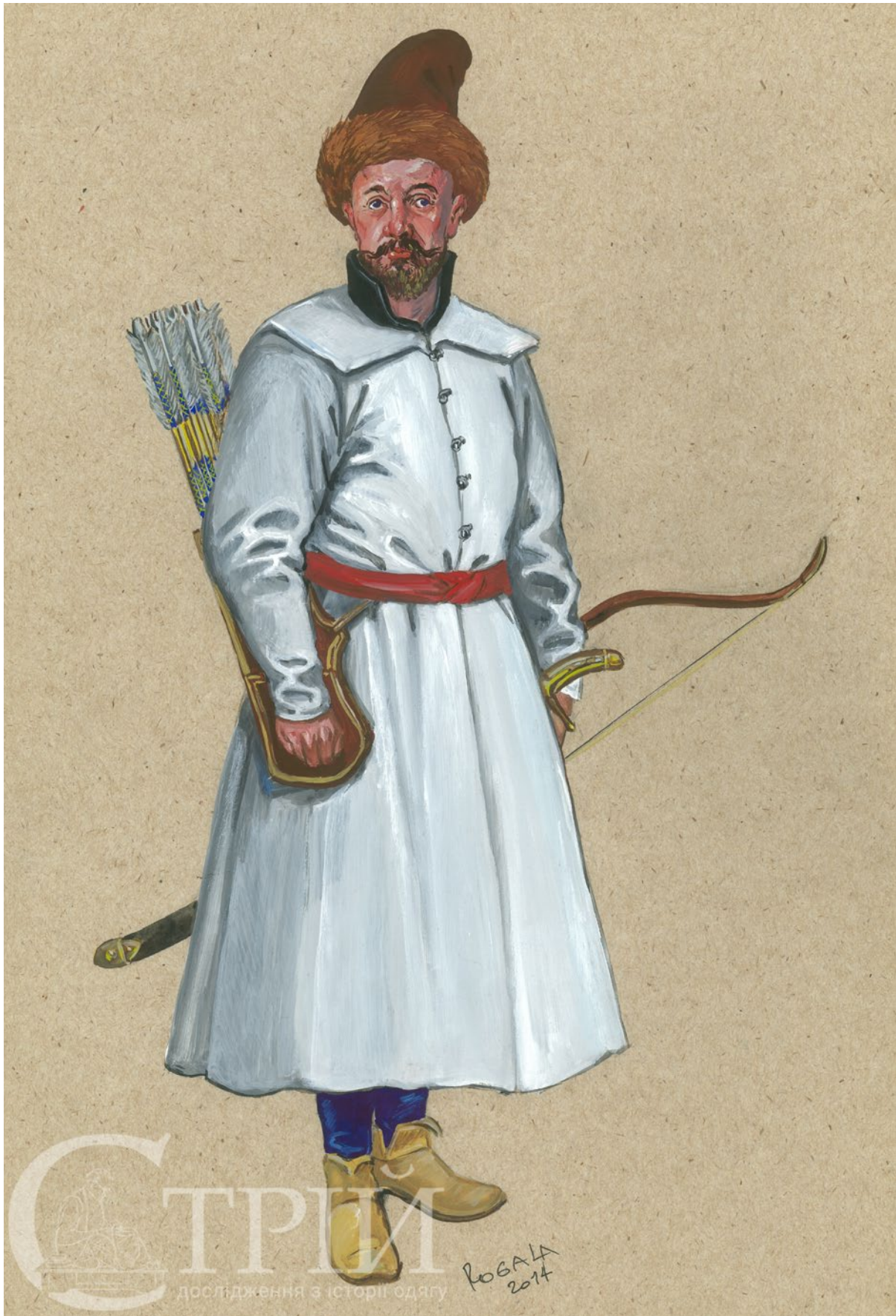
Мал. 7. Козак, 1570–1580 рр. (малюнок автора).