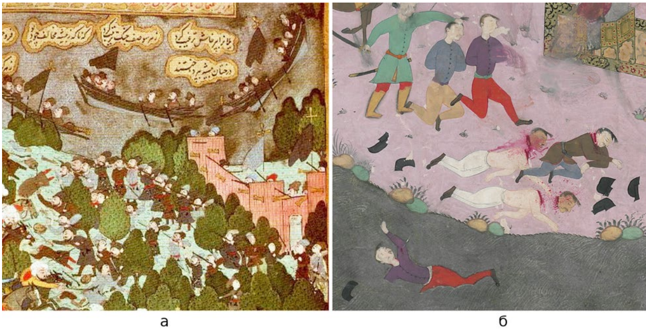
Мал. 2. (а) – фрагмент мініатюри із Sahansahname 1592 р. авторства Османа Наккаша; (б) – фрагмент мініатюри із « Şehnâme-i Nâdirî » авторства Ганізаде Мехмед Надірі.

включно з підрозділом запорозьких козаків (Мал. 3, а) ( Szcześniak 100). Полотно зберігається в Олеському замку. Піхотний підрозділ показано схематично: добре видно лише прапор козаків – білий з темним хрестом, колір жупанів світлий (або сірий); крім того, видно, що всі козаки в чорних магерках. Поряд зі спішеними козаками показані кавалерійські підрозділи – ймовірно, також із запорозьких козаків. На вершниках можна розгледіти чорні та червоні вузькі уброне та різнобарвні верхні одежі. На гравюрі 1610 р. авторства Філіпа Якуба, виконаної за малюнком Теофіла Шемберга, що зображує битву під Клушином (Мал. 3, б) (« Hetman »), показано підрозділ українських козаків значно краще: в лісочку вони вишикувані в чотири шеренги, частина підрозділу пробирається крізь лісові хащі. На постатях виразно видно одежі, ймовірно, жупани або довгі сукмани, підгорнуті та заткнуті за пас. Так само, як і на полотні Симона Богушовича, на головах показані чорні магерки. Одяг зображено більш ретельно, завдяки чому видно, що виразно показано поясний одяг – вузькі уброне. У підпису до гравюри внизу вказана козацька хоругва Хвалібога – 100 без коней. Польська піхота показана на гравюрі в двох місцях: біля табору та в лісі; виглядають вони в принципі майже однаково, але запорозькі козаки без пир'я на магерках.