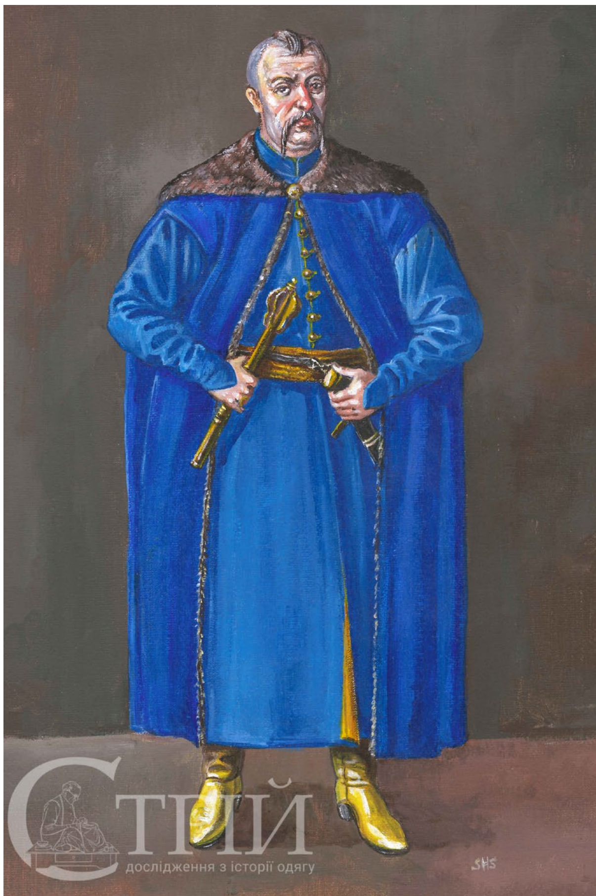
Мал. 9. Запорозький полковник 1610–1630 рр. (малюнок автора).