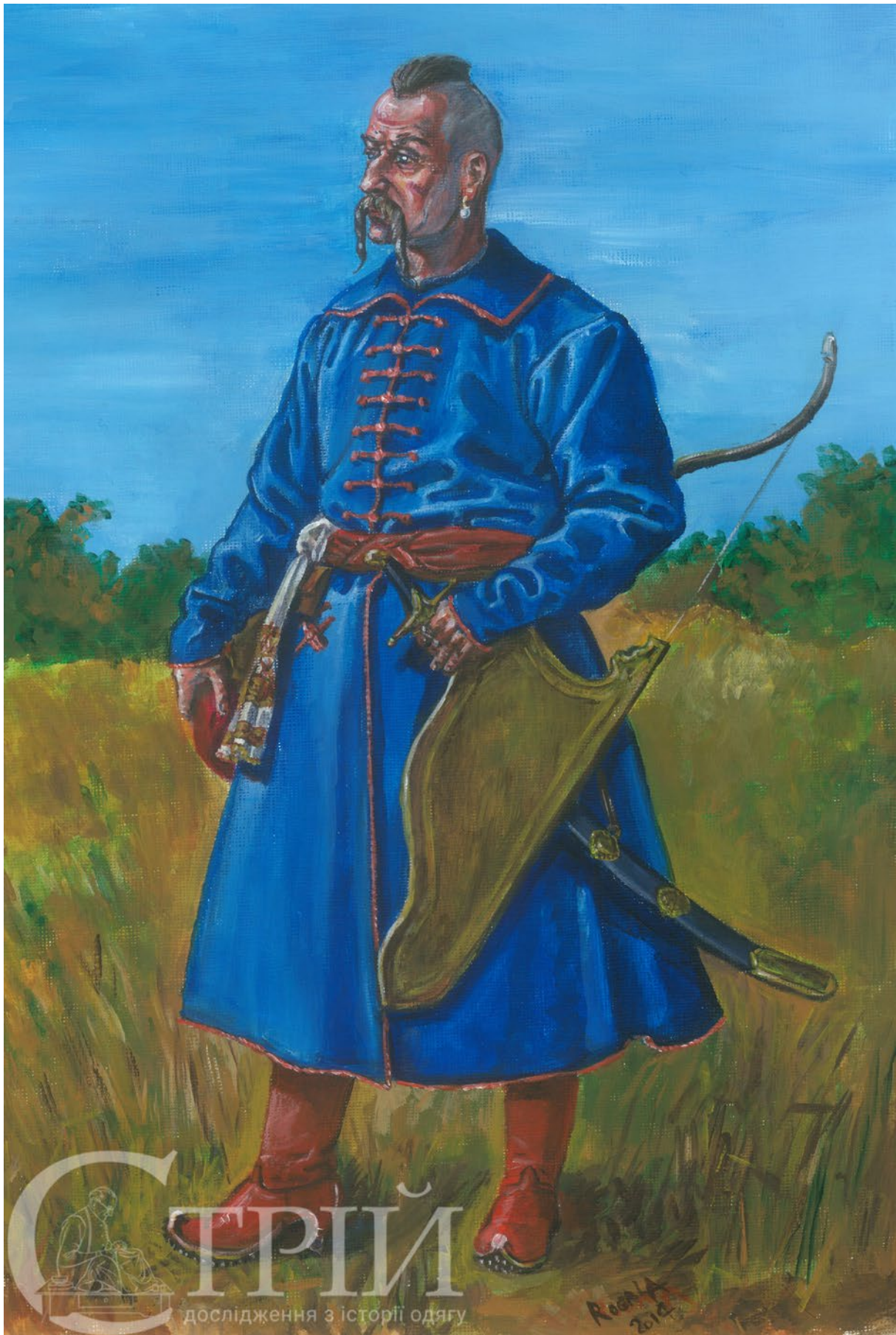
Мал. 8. Іван Підкова, початок 1590-х рр. (малюнок автора).