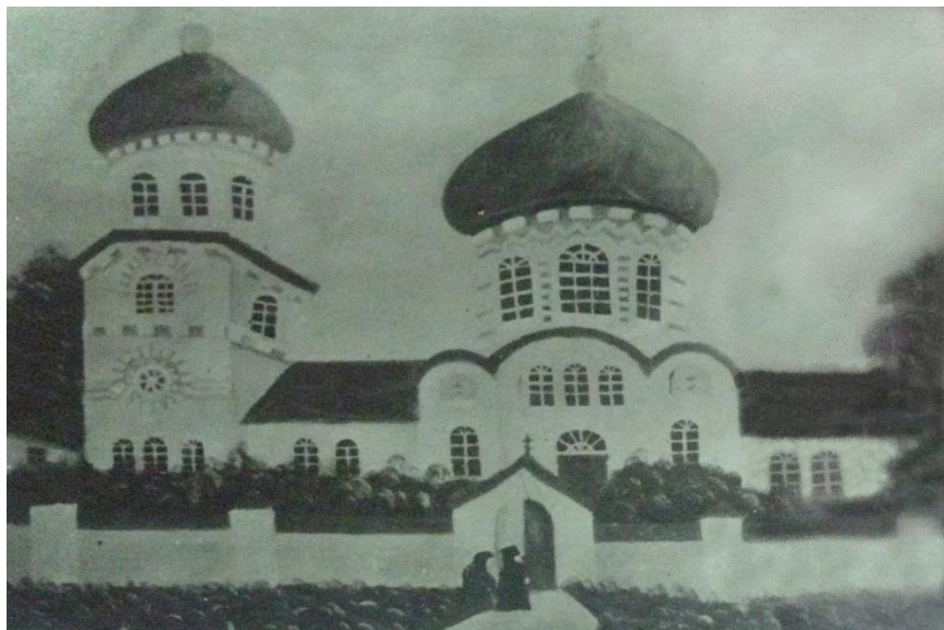
Томаківська церква у святковий день (1920-і роки)

– Воістину Воскрес! – із не меншим захопленням та вірою відповідали люди.