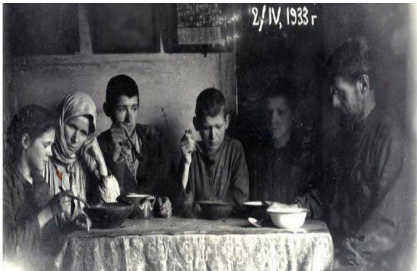
Сім'я селян під час голоду

Хлопчина раптом звернув увагу на нерівномірний, збійний ритм татового дихання. Наляканий цим фактом, він раптом усвідомив, що з батьком також може щось статися. Бажаючи якомога швидше відкинути страшні думки, Петя узявся прискіпливо вишукувати свідчення міцності Данилового здоров'я. Проте, всупереч очікуванню, пригадав, що ще влітку живіт у тата був великим "кавуном", а зараз на цьому місці зіє глибока яма. Підліток придивився до фотографії батька, яка висіла над столом: округле усміхнене обличчя, великий м'ясистий ніс-картоплина, здавалося, належали зовсім не тій виснаженій людині з різко висунутими гострими вилицями, котра зараз лежить на ліжку.