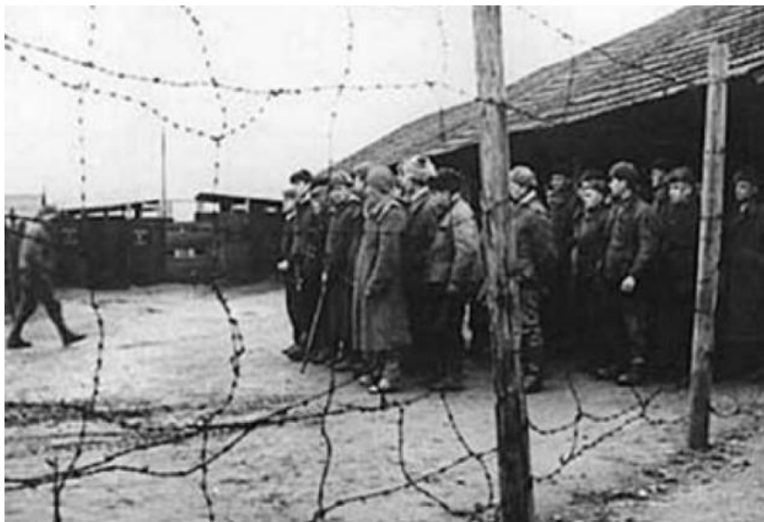
Шиккування в таборі

хто слідував позаду, змушені були зупинитися та чекати. Іноді затримка виявлялася надто довгою, й тоді у справу вступали охоронці, які намагалися криками та зброєю підігнати людей, що застрягли.