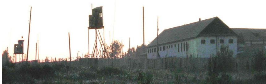
Одне з табірних відділень Севураллагу

«Готуються до повернення людей із роботи, – припустив Петя. – Потрібно буде, поки в бараку порожньо, просушити біля гарячої грубки хоча б матрац».