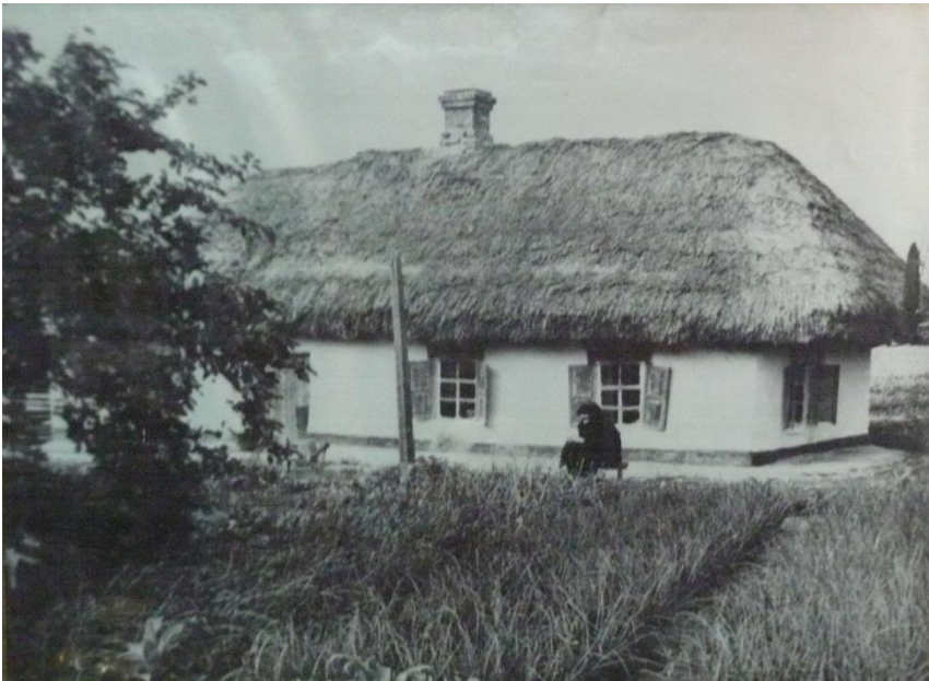
Хата небагатого селянина (1930-і роки)