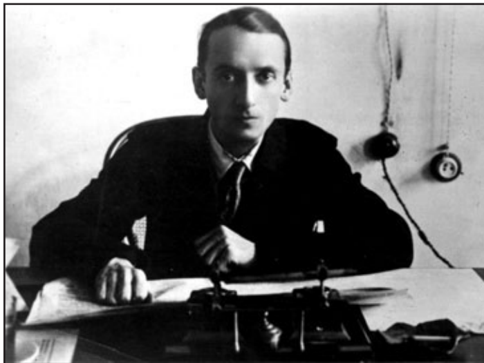
Г.Ф. Ланчинський, голова Чернігівського губревкому. 1919 р.