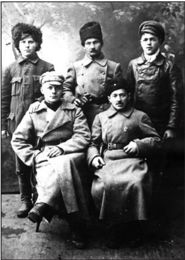
Бійці Богунського полку, які брали участь у боях з денікінцями на Чернігівщині. Листопад 1919 р.

5 листопада частини 60 дивізії увірвались до Чернігова зі сходу. З півночі в місто вступив 2-й полк Таращанської бригади. Напружені бої тривали добу. Ось чому в різних джерелах зустрічаємо різні дати визволення Чернігова. Здебільшого це – 7 листопада, коли денікінці, переправившись через Десну, закріпилися на її лівому березі поблизу нинішнього шосейного мосту, в районі колишнього залізничного вокзалу. Звідти почали обстрілювати місто з гармат, влучили у будинок семінарії, де на той час вже перебував військовий шпиталь, лише 12 листопада вони відступили від Десни у напрямку Анисів – Лукашівка. 21 листопада були звільнені Ніжин, ст. Крути, 1 грудня – Прилуки.