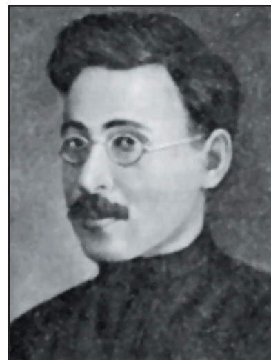
М. Глібов-Авілов, голова Чернігівського губревкому наприкінці 1919 – початку 1920 р.

Народився у Калузі. Навчався у партійній школі в Болоньї. У травні – червні 1918 р. – головний комісар Чорноморського флоту. 3 грудня 1918 р. – член колегії Народного комісаріату праці РРФСР, член президії і секретар ВЦРПС. Як представник Реввійськради 12 армії 28 жовтня 1919 р. очолив Чернігівський губревком. Згодом – нарком праці України. З 1923 р. – голова Петроградської ради профспілок. У 1928 р. – голова будівництва, директор заводу “Ростсільмаш” (Ростов-на-Дону). Заарештований у вересні 1936 р. за приналежність до контрреволюційної терористичної організації. Розстріляний. Реабілітований у 1956 р.