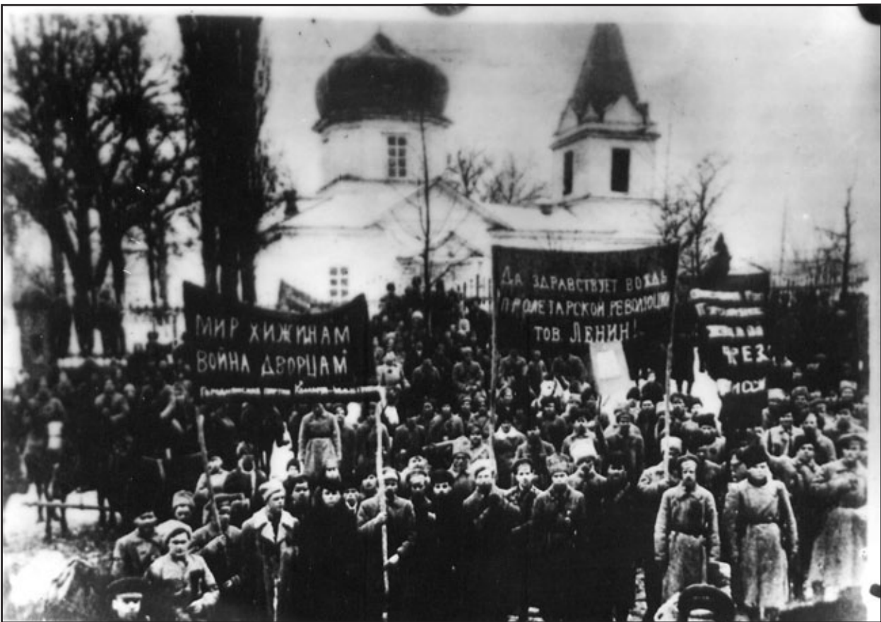
Маніфестація в Городні з приводу вступу до міста Богунського полку. 31 грудня 1918 р.

Богунський полк просувався у напрямку Новозибків – Клинці – Чернігів; Таращанський йшов на Городню – Сосницю – Борзну; Ніжинський – із Семенівки на Корюківку – Сосницю – Мену – Ніжин – Бахмач, де зустрівся з таращанцями; Новгород-Сіверський полк – на Новгород-Сіверський – Кролевець – Конотоп.