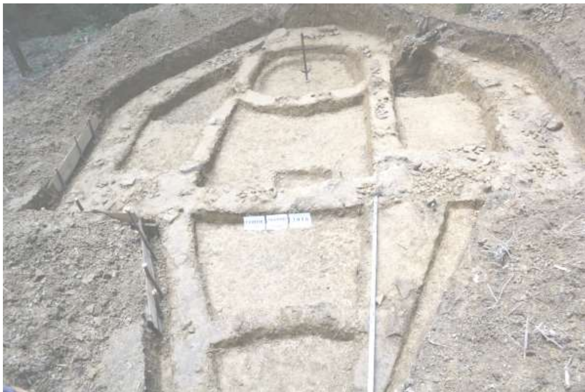
Рис. 2. Розкопки фундаментів церкви Гошівського монастиря

Фундатором нового монастиря став Микола Гошовський, який подарував монастирю чудотворну ікону пресвятої Богородиці (“Цариця Карпат”).