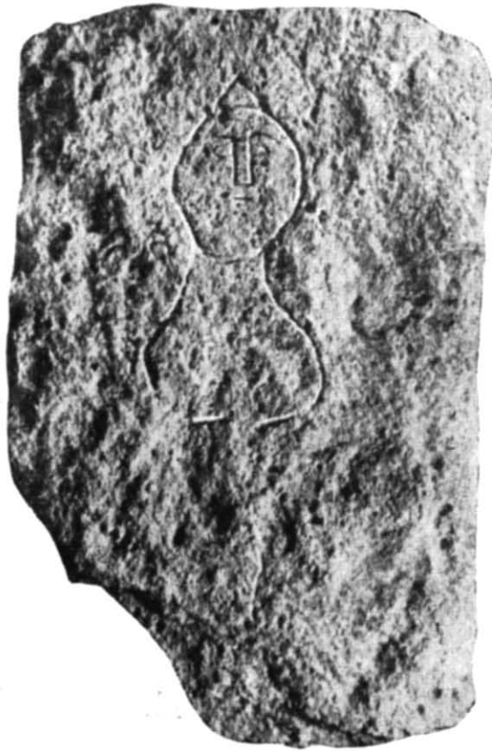
Рис. 3. Плита з розкопок 1960 р. в Херсонесі.

неса, причому можливо, що тут справила вплив поява в перші століття н. е. в надгробній скульптурі міста портретного погруддя померлих. Надгробок з цитаделі, на наш погляд, потрібно поставити пізніше вищеописаних зображень, але дещо раніше херсонеських надгробків місцевої роботи кінця II — початку III ст. н. е. з портретним зображен-