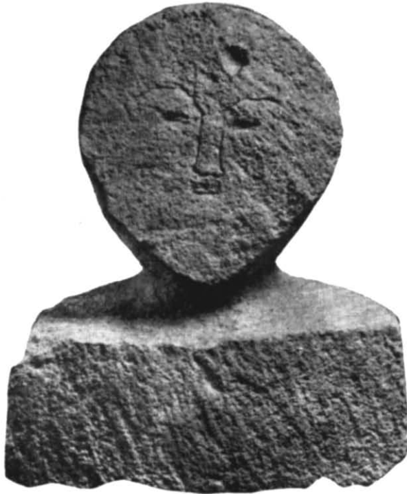
Рис. 4. Стела з південно-східного некрополя Херсонеса.

Антропоморфні надгробки Херсонеса становлять окрему групу серед північнопричорноморських пам'яток подібного роду. Останніми дослідженнями А. О. Щепинського 12 поставлене питання про послідовність у розвитку цього типу, який веде свій початок, найімовірніше, від