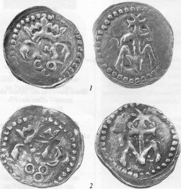
Відомі сьогодні екземпляри монети Федора: 1 — із сосницького скарбу (НМІУ); 2 — з каталогу литовських монет.