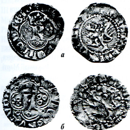
Рис. 3. Галицько-руський грошкiк а – Казимира III; б – Людовіка Угорського.