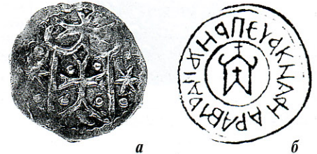
Рис. 2. Особистий знак Володимира Ольгердовича на: а – монеті Володимира Ольгердовича; б – печатці сина Володимира Андрія.

Центр дослідження історії Поділля Інституту історії України НАНУ