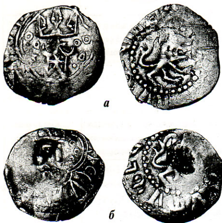
Рис. 1. Монети-знахідки:

На аверсі монет, згідно з львівським прототипом, в оточенні кругової легенди