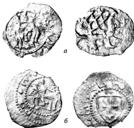
Рис. 2. Денарії типу «Портрет — Лев з плетінням» (а) та «Вершник — Щит з подвійним хрестом» (б).