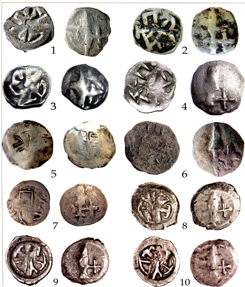
Рис. 3. Зображення деяких з монет «Печать», знайдених в останній час в Україні: 1 – Волинь 0,78г; 2 – Жидичин Ківерцівський р-н Волинська обл. 0,58г; 3 – Турійський р-н Волинська обл. н/д; 4 – Переділи Рівненський р-н Рівненська обл. 0,98г; 5 – Торговиця Млинівський р-н Рівненська обл. 0,86г; 6 – Бровари Київська обл. 0,96г; 7 – Лубни Полтавська обл. 0,70г; 8 – Чигирин Черкаської обл. 0,75г; 9 – Чигирин Черкаської обл. н/д; 10 – Чигирин Черкаської обл. н/д.