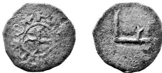
Рис. 2. Новознайдена монета Белзького князівства. Масштаб 1,5:1.

ративних елементи у вигляді трьох з'єднаних кілець та шестикутної зірки. Крім того, нова монета має більший розмір – 1,8 см та більшу масу – 1,19 г, порівняно з раніше знайденими белзькими монетами з діаметром у 1,3 см та масою 0,2 г – 0,3 г. Але найбільша відмінність нової монети від вже відомих белзьких монет полягає в тому, що вона виготовлена не з срібла, як попередні монети, а з міді, що підтверджує типова зеленкувата патина монети. Про те, що монета дійсно карбувалась як мідна, а не була карбована як срібна з мідної заготовки покритої сріблом, свідчить відсутність можливих залишків срібного покриття в дрібних елементах зображень та літерах, як це зазвичай буває у таких випадках.