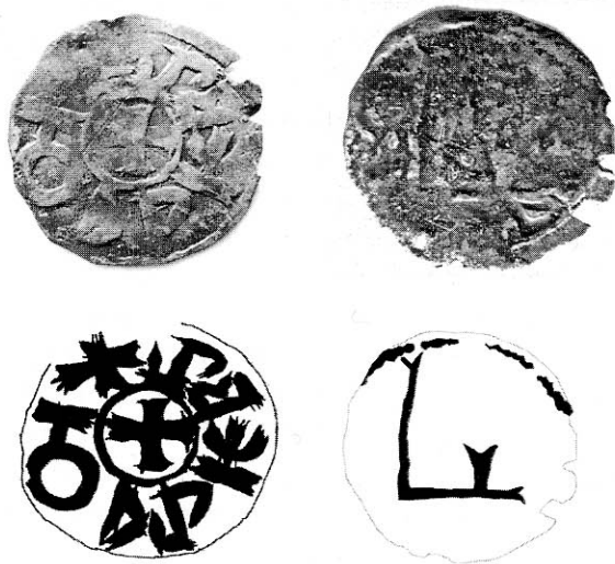
Рис. 1. Монета Белзького князівства. Фото та реконструкція напису зі статті Б. Пашкевича.

Нещодавно автору стала відома монета, яка за всіма ознаками теж належить до белзького карбування, рис. 2. Знайдена вона була також на історичних теренах Белзького князівства у Львівській області в безпосередній близькості до міста Белза. Разом з нею були знайдені два мідні галицько-руські денарії Людовика Угорського (1370-1382). За своїми зображеннями нова монета майже повністю співпадає з раніше опублікованими белзькими монетами. З одного боку навколо простого грецького хреста, оточеного суцільним обідком, йде кириличний напис. На протилежному боці, так саме, як на вже описаних белзьких монетах, – княжий знак простої форми, що дещо нагадує латинську літеру «F». Хоча стан монети не надає можливості розпізнати всі літери напису, однак в ньому без сумніву читається початкова літера «Ю» та кінцева «Ъ» легенди монети «Юр'євъ». На відміну від раніше описаних белзьких монет, тут напис йде за годинниковою стрілкою. Також у написі новознайденної белзької монети, до розділового хрестика, додано ще два деко-