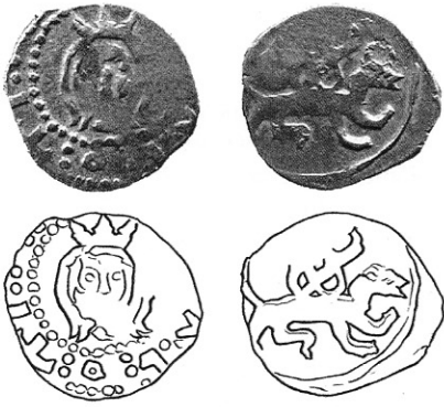
Рис. 2. Портретна монета з Черкащини з кириличною? псевдолегендою.

груп літер та значків, розділених орієнтованими вертикально та горизонтально двокрапками. Серед них можна виділити знак схожий на кириличну літеру «Т». Портретна монета з подібним знаком раніше вже була опублікована [5]. Можливо, що повідомлення про імовірне існування портретних монет з кириличним написом [6] відноситься саме до цих монет.