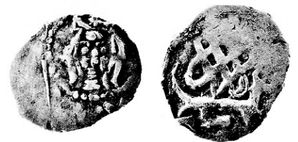
Рис. 5. Портретна монета з непрокарбованою ділянкою.

У зв'язку з цим додамо декілька слів щодо проблеми встановлення правдивості монет. Наразі серед нумізматів під час обговорення нових, раніше не відомих, монет, розгляду усіляких унікумів, тощо, поширився, так би мовити, «комерційний» підхід, за яким сповідується