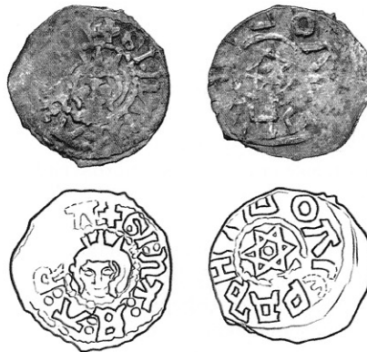
Рис. 3. Портретна монета з латинською псевдолегендою та іменем «Ольгерд».

ням» також варто звернути увагу на ще одну портретну монету нового типу, яка з'явилася порівняно нещодавно. Хоча вона відрізняється реверсом від портретних монет, що розглядаються, її аверс з портретом подібний до аверса монет «Портрет / Лев з плетінням» (рис. 3). Величина цієї монети 1,8 см, що більше звичайних розмірів в 1,5–1,6 см монет «Портрет / Лев з плетінням», тому на ній добре розрізняється більша частина напису навколо портрету «+GI:NA:E:A:R ...A». Як бачимо, напис подібно до згадуваної портретної монети з Черкащини теж є беззмістовний, але відноситься до його іншого різновиду. Структура його подібна до структури напису портретної монети з Черкащини, ті самі групи, але