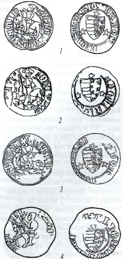
Графічні зображення всіх відомих монет Костянтина:

У підсумку повна легенда монети виглядає так: