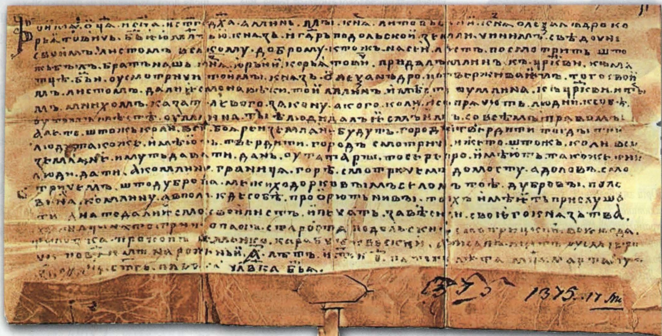
Грамота Олександра Коріатовича, видана Смотрицькому монастирю в Смотричі у 1375 р.

грамота від цього року [16]. Напевне, тільки майбутні знахідки дадуть відповіді на ці запитання.