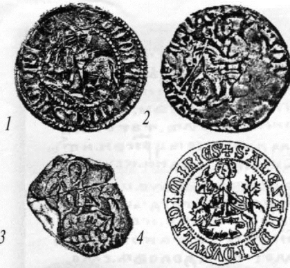
Св. Юрій зміборець: 1, 2 – монети Костянтина; 3, 4 – печатки Олександра. 3 – хромолітографія воскової печатки з грамоти 1375 р. із книги П. Батюшкова "Подолье"; 4 – мал. печатки з книги А. Б. Лакієра "Русская геральдика".

московського Івана Красного – Ганні, сестрі Дмитра Донського. Разом з іншими Коріатовичами Дмитро брав участь у боротьбі литовських князів з Польщею та Угорщиною за галицьку спадщину. Судячи з прізвиська Боброк-Волинський, що він пізніше отримав у Москві, мав володіння на схід від Львова, у районі річки Бібрка (Бобрка) [12]. Десять після 1366 р., втративши у боротьбі з поляками свої галицькі володіння, Дмитро Коріатович перебирається на Північно-Східну Русь. У 1371 р. він уже воевода великого князя московського Дмитра Донського. Проявив себе талановитим полководцем, зробив ряд вдалих військових походів, один з героїв Куликовської битви в 1380 р. Московський князь використовує його литовські зв'язки. Дмитро за дорученням Донського укладає мир з Литвою в 1372 р., бере участь у приєднанні до Москви верховських князівств.