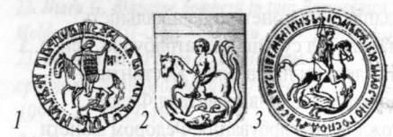
Вершник зміборець: 1 – печатка Василя II Темного (1425–1462) (рис. по В. Яніну, печатка №436 а); 2 – Московський герб з книги Герберштейна поч. XVI ст.; 3 – печатка Івана III (1462–1505).

Ще одне запитання, на яке поки немає відповіді: чому Костянтин карбував монету одноосібно? Адже з документів добре відома своєрідна форма послідовного спільного правління в Подільському князівстві двох братів Коріатовичів: Юрій та Олександр до 1374 р., згодом Олександр та Борис до початку 80-х років. Костянтин теж мав співправителя, молодшого брата Федора, якому довелося бути останнім подільським князем з Коріатовичів. Відомі їхні дві спільні грамоти від 1388 р. та 1391р. Можливо, що до 1385 р. Костянтин правив один, оскільки відома його одноосібна