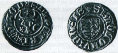
Гриш Петру Мушата перших емісій.

які на подільських та перших молдовських монетах було розміщено практично однаковий анжуйський герб. Вважається, що Петру Мушат почав карбування монети в Сучаві після перенесення туди столиці в 1388 р., тобто хронологічно воно почалось пізніше подільського [23]. Відносно походження анжуйського герба на молдовських монетах серед дослідників немає якоїсь загально прийнятної гіпотези.