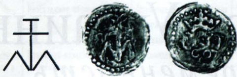
Княжий знак з двосторонньої печатки Федора Коріатовича від грамоти 1403 р. та денарій Федора Коріатовича з Сосницького скарбу.