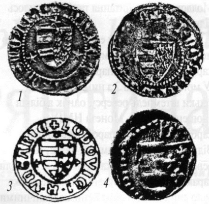
Анжуйський герб на монетах Костянтина (1, 2) і денаріях Людовика (3) та Ядвіги (4).

До грамот від 1403 р. молодших Коріатовичів – Федора і Василя були привішені двосторонні воскові печатки, на одній стороні яких також були зображення св. Юрія зміборця, як записав описувач: " sigillum cum imagine D. Georgii ", а на другій тамговидні зображення [9]. Існує вказівка, що Федір вже перебуваючи в Угорщині використовував таку саму печатку з Юрієм зміборцем. Єдиний опис печатки самого Костянтина, разом з печаткою Федора, з їхньої спільної грамоти від 1388 р. був зроблений ще в 1782 р. [10]. На них автор опису побачив однакові зображення вершників, які він визнав литовським гербом "Погоня". Беручи до уваги наведений вище опис печатки Федора, стає зрозуміло, що і в цьому випадку йдеться про зображення св. Юрія зміборця. Таким