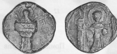
Печатка давньоруська з Меджибожа. Свинцеві, розміри 1,7×1,9 см, товщина 0,3 см, вага 7,8 г.

Зображення правої половини печатки не повністю потрапило на поле заготовки і більша частина можливого напису праворуч фігури архангела вийшла за її межі. В результаті, над правим крилом архангела залишилася тільки літера чи фрагмент літери, яка з великою імовірністю може бути першою літерою напису з ім'ям архангела. Слід зазначити, що на цій ділянці у подібних печатках будь-яких інших елементів зображення крім літер написів не розміщувалося. Як показало детальне вивчення, за своєю графікою права позначка — косий нахилений праворуч штрих, що утворює вгорі гострий кут, може бути фрагментом — першою половиною очікуваної літери «М», початку напису «Михаїл». Таке накреслення літери «М» з нахиленими усередину боковими штрихами характерне для уставу XII — XIII ст. і зустрічається на багатьох інших печатках того часу. В усякому разі ця позначка далека за своїм накресленням від можливої альтернативи — літери