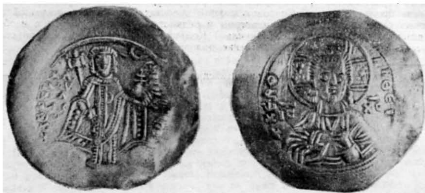
Рис. 3. Золота монета Мануїла I Комніна (зворотний і лицьовий бік).

Саме поховання майже цілком знищене траншеєю. Вдалося простежити лише сліди поховальної ями, де в південно-східному кутку збереглися залишки зотлілих