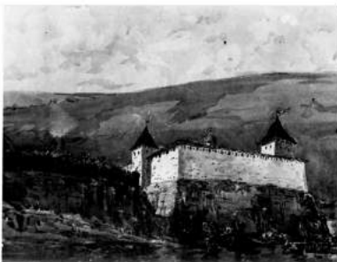
Рис.4. Хотинська фортеця XIII ст. (малюнки-реконструкції за Г.Н. Логвином)