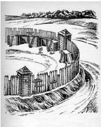
Рис.1. Дерев'яні укріплення

Грозинецького городища (малюнок-реконструкція худ. М. Молдавана)