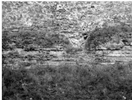
Рис.2. Фрагмент рову

Грозинецького городища (малюнок-реконструкція худ. М. Молдавана)