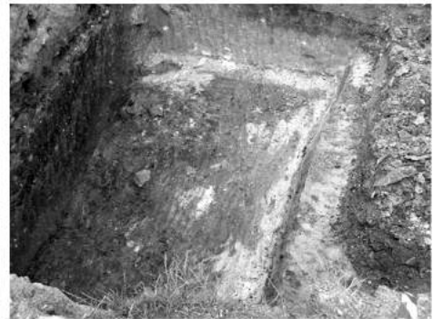
Рис.3. Розкопки слов'янського житла X-XI ст.