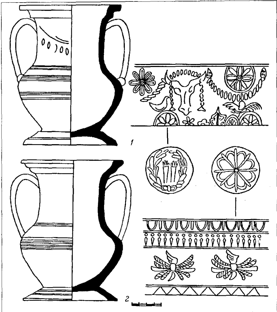
Рис. 3. 1, 2 — малоазійські амфори-пеліки.

цілком ймовірно малоазійського. Пергам як центр виробництва цієї кераміки є найменш вірогідний. При достатній вивченості керамічної продукції Пергаму ніщо не вказує на виготовлення саме тут подібного посуду. Датується група сіроглиняних посудин досить вузько — кінцем III—II ст. до н. е. На це вказує ряд обставин. Частину фрагментів було знайдено у шарах та комплексах, що чітко датуються кінцем III—II ст. до н. е. в Ольвії. У Пантікапеї уламки сітул були вилучені із сміттового завалу на горі Мітрідат, що датується II ст. до н. е. 9 Цим же часом визначаються умови знахідки сіроглиняного кратеру з Тіри 10 . Сітула, опублікована Е. Р. Штерном, містилася в одному похованні з амforoю із зображенням еротів 11 . Вона теж датується кінцем III—II ст. до н. е. 12