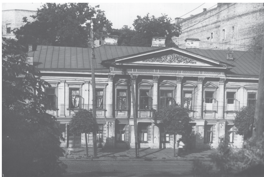
Будинок В. Гербеля. Фото середини 1930-х рр.

Наприкінці 1837 року будинок генерал-лейтенанта Гербеля винайняла адміністрація Університету св. Володимира для розташування незаможних студентів. Окрім мурованого двоповерхового будинку винаймалися дерев'яний флігель та служби, які знаходилися на території садиби. Плата за оренду приміщень становила