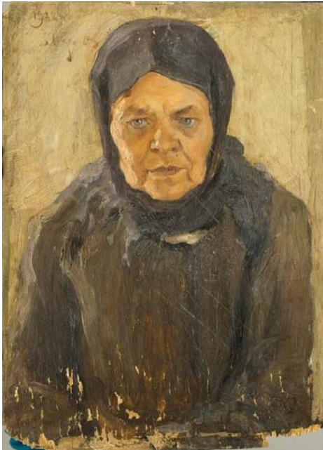
Іл. 1. Жіночий портрет. 1922 Черкаський обласний художній музей.

Попри це, низка архівних документів залишилася поза увагою дослідників і введення їх у науковий обіг, допоможе нам більш повно і точно висвітлити подробиці останнього київського періоду життя художника (1928-1938).