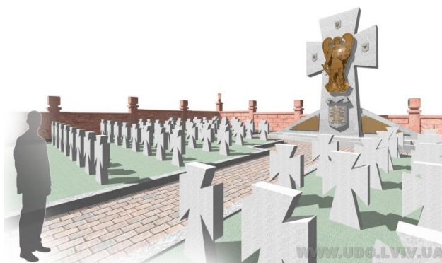
Рис. 5 Ескізний проект Меморіалу воїнам УГА до 90-річчя Чортківської офензиви (ТзОВ «Укрдизайнгруп»). 2009 р.

1 – накладений пропорційно відповідний план «Українського Воєнного Цвинтаря» у межах сучасного кладовища; 2 – ділянка кладовища із символічними могилами, які вважалися Стрілецьким кладовищем протягом 1989-2019 рр.; 3 - кладовище польських воїнів 1918-1920 р.; 4 – спільна могила жертв комуністичного тоталітарного режиму