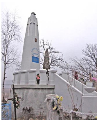
Рис. 1 Спільна могила 12-ти воїнів УГА на Вигнанському кладовищі Чорткова.