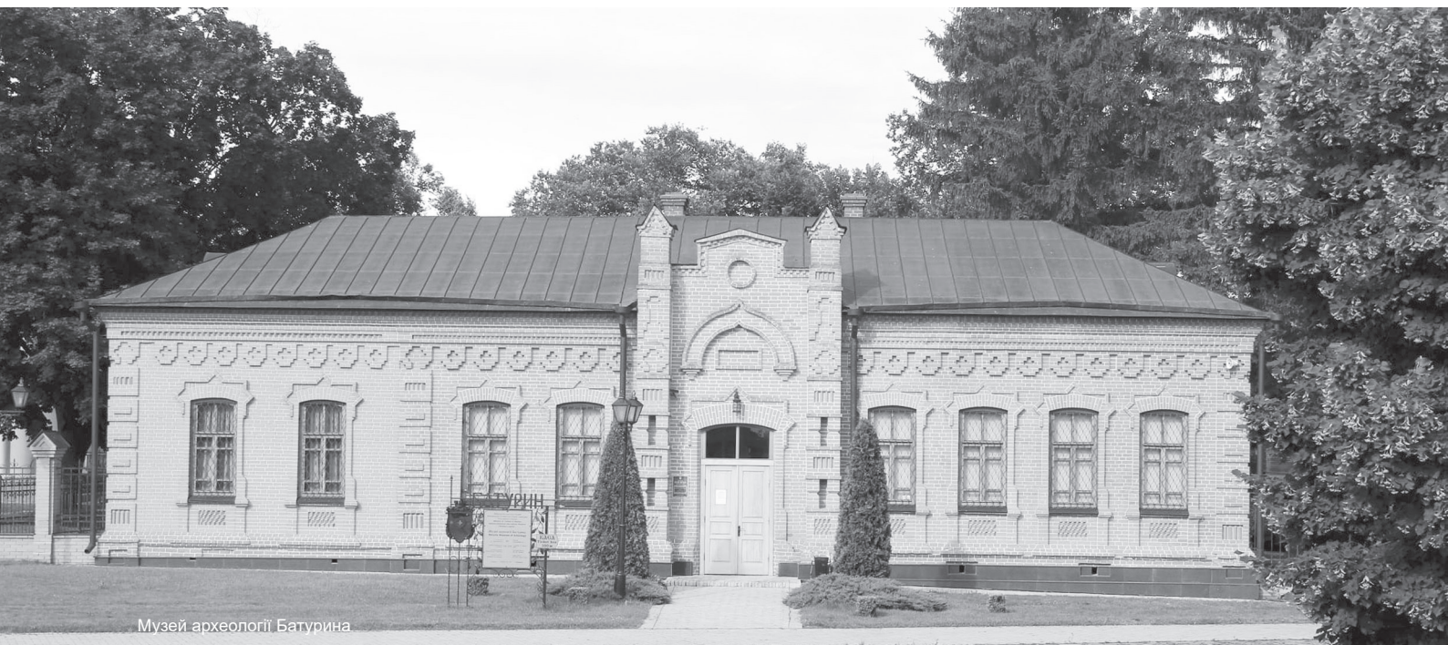
Музей археології Батурина

три, сірки та товченого вугілля, випаленого з деревини.