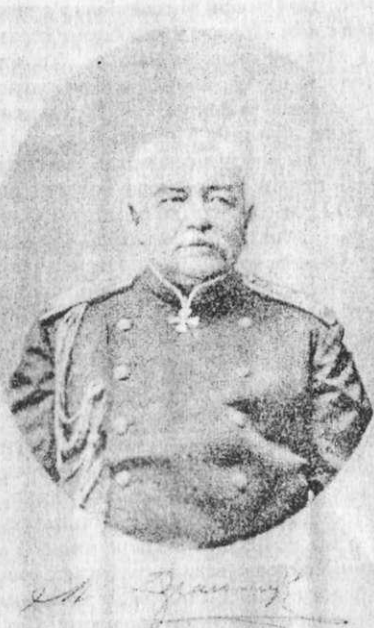
Генерал М.І. Драгомиров.

Загальновідомо, що критика в російській літературі 60-х років дев'ятого століття знаходилася на роздоріжжі. По-перше, ще витав дух Віссаріона Белінського, який настоював на тому, що «ні для чого розділяти критику на різні роди». По-друге, М. Чернишевський та М. Добролюбов, О. Дружинін з В. Боткіним та П. Анненковим, і Ап. Григор'єв, які все ж розділили критику, сформувавши три її напрямки — «реальна», «естетична», «органічна», з тої чи іншої причини (смерть, каторга тощо) відійшли від справ. А їх продовжувачі: Писарев, Шелгунов, Соловйов, Страхов — ще не набули належної сили і лише не втомлювалися говорити про «бідність літератури» та сперечатися про роль і місце критики.