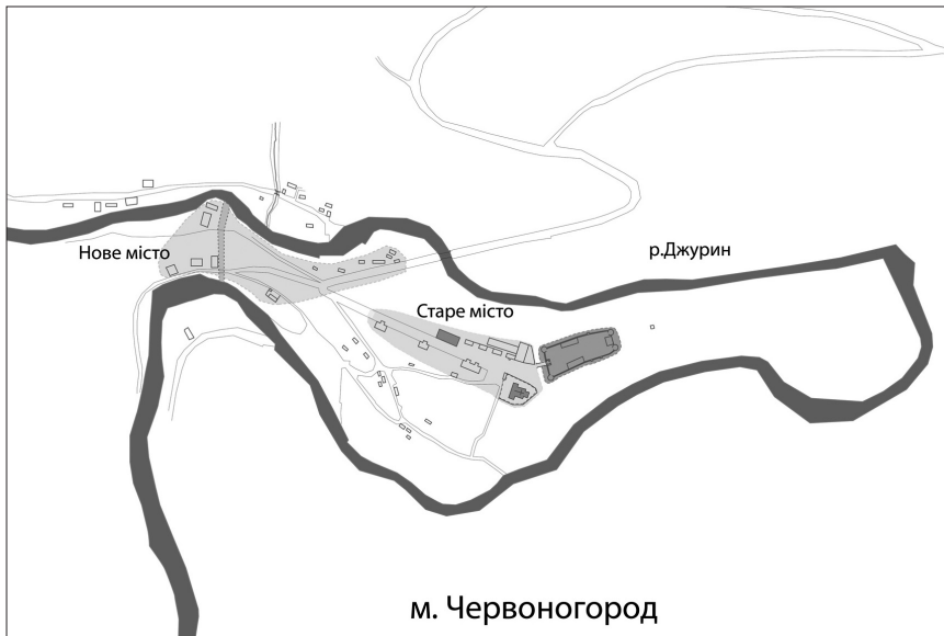
Рис. 1. Реконструкція первісного планування Червоногороду. Fig. 1. Reconstruction of the original planning of Chervonohorod.

Як бачимо в джерелах, що походять з середини XV ст., Червоногород поділявся на стару та нову частини, відтак їх необхідно чітко локалізувати (рис. 1).