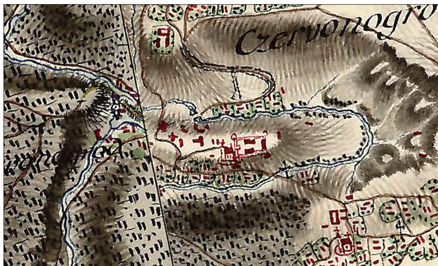
Рис. 2. Червоногород на мапі Ф. фон Міга 1779–1783 рр. Fig. 2. Map of Chervonohorod by F. von Mieg 1779–1783 (part of First Military Survey maps of the Habsburg Empire).

Перше і єдине більш-менш докладне картографічне зображення замку походить з 1779–1783 рр., йдеться про т. зв. мапу фон Міга (рис. 2) 44 . Зображення замку на ній цілком відповідає інвентарному опису замку 1665 р.