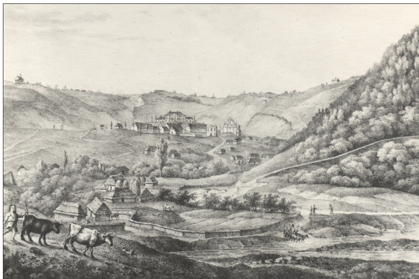
Рис. 3. Червоногород, загальний вигляд у першій половині XIX ст.