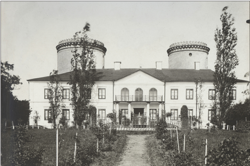
Рис. 4. Головний (західний) фасад палацу на місці замку, фото до 1914 р. Fig. 4. The main (western) facade of the palace, photo before 1914.

Окрім замчиська, великих змін зазнала територія на схід від нього. Тут розпланували парк, побудували оранжерею і поставили кам'яний пам'ятник, присвячений трагічним сторінкам історії Червоногорода. Він складався з профільованої бази, у сторонах якої було вмонтовано рельєфи, та ампірової вази, увінчаної фігурою сови. В цей же час тут могла з'явитися скульптура лева, відома з фотографій 1925 56 та 1944 рр. 57 , походження якої наразі не встановлено. Не виключено, що ця скульптура належала до елементів декору старостинського палацу, який міг існувати на замковому подвір'ї до 1648 р.