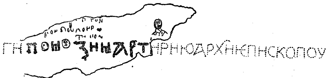
Рис. 2. Реконструкція первісного тексту напису з ім'ям Мартирія. Fig. 2. Texte rétabli de l'inscription précédente.

От з цією подією, здається мені, й можна зіставити урочистий напис в софійській ризниці. Після обряду поставлення, на честь архієпископа Новгородського Великого (з яким київський митрополит волів бути у дружбі з огляду на сепаратистські тенденції Новгородського) рукою вправного майстра-спеціаліста був вирізаний напис і вміщений портрет архієпископа. Цей напис не був новизною. Він був лише продовженням традиції, яка усталилась у звичаях софійських клиришан. Весь напис повинен був мати такий вигляд: