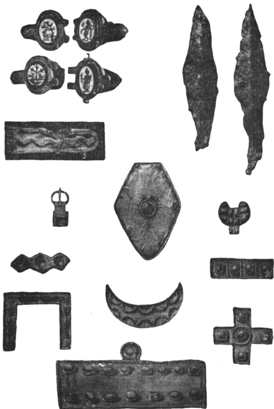
Рис. 2. Речі гунського часу з поховання в с. Новогригорівка і ур. Макартет.