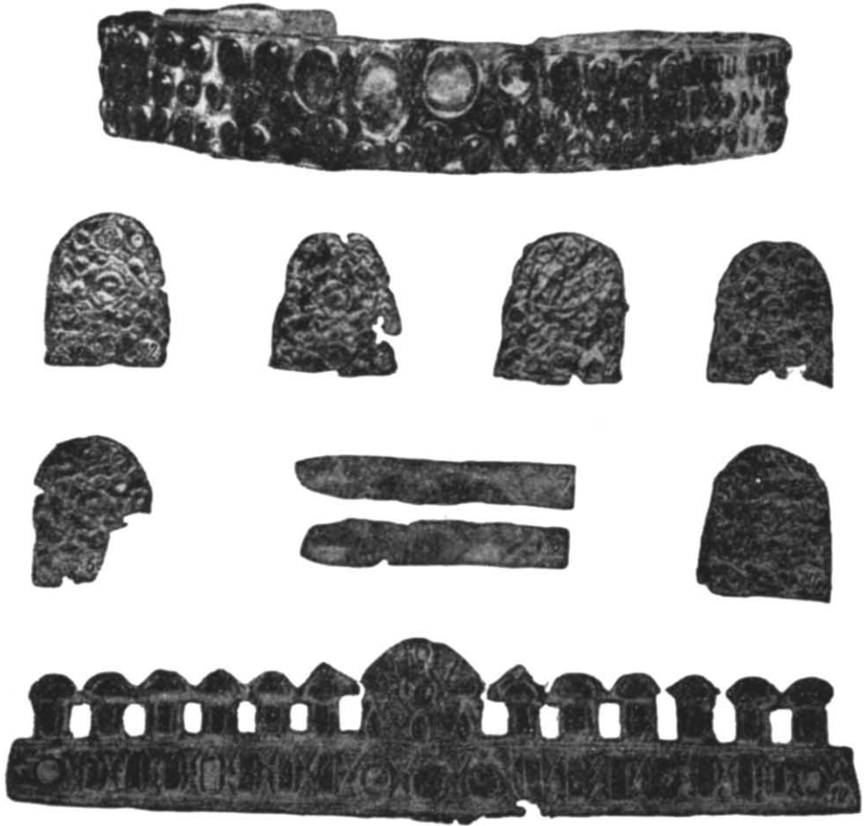
Рис. 1. Речі гунського часу на Україні з Тилігульського лиману та с. Стара Ігрень.

явлене поховання з конем 43 (рис. 1, 2—10), де було знайдено 29 напів-овальних та прямокутних штампованих бляшок, 49 янтарних, дві халцедонові, одна скляна золочена бусина та діадема, інкрустована янтарем в напаяних на ребро перегородках. Склад речей, техніка їх