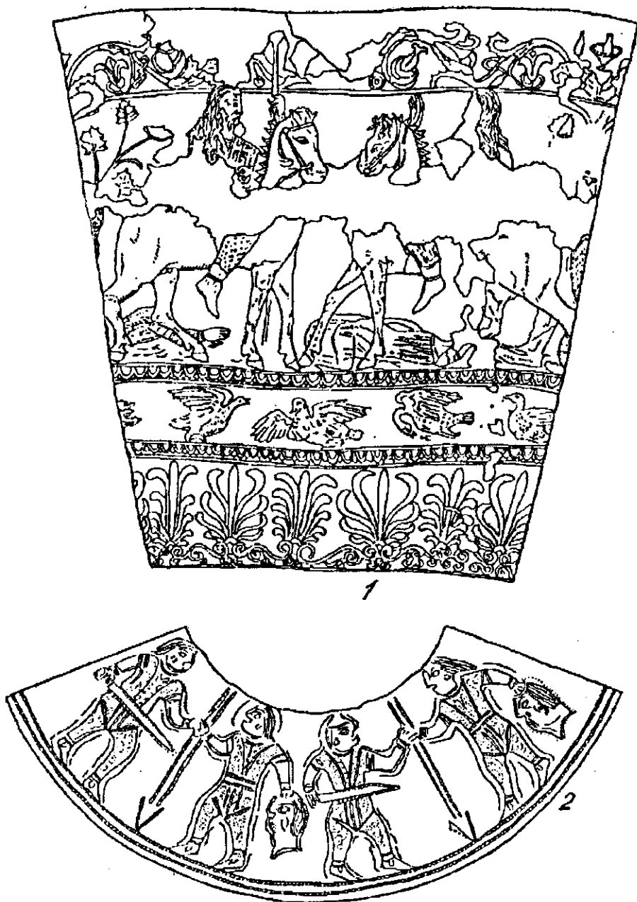
Рис. 4. 1 — сцена на ритоні з Карагодеуашху; 2 — ковпачок з Курджипсу.

сюжетах, а на пекторалі, зображено доярів корів та овець, найхарактерніша ознака скіфського побуту, так і не знайшла відображення в мистецтві.