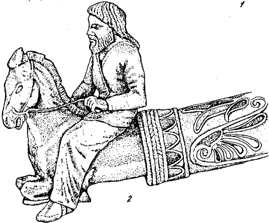
Рис. 2. 1 — гребінь з Солохи; 2 — наконечник гривни з Куль-Оби.

лука обома руками» (Plato.Legg.I, 9). Майже у всіх похованнях скіфів, як знатних, так і рядових зустрічаються набори наконечників стріл 8 . У курганах скіфської еліти їх кількість досить значна. У багатьох сценах на художніх виробках відтворено скіфів, які натягують тятиву лука і носять горити. Взірцем скіфського вершника-лучника є, безперечно, зображення Атея на золотій монеті (рис. 1, 4). Приземкуватий чоловік з довгим прямим волоссям у каптані і вузьких штаних міцно сидить на скакуні, трохи підібгавши ноги під живіт тварини. Обома, випростаними вперед руками він пускає стрілу із складного лука в уявного ворога 9 . На лівому боці висить горит. Цей образ,