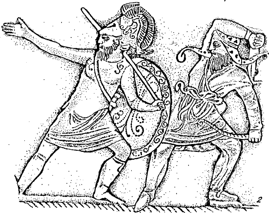
Рис. 3. 1 — фрагмент сцени бою на гориті з Солохи; 2 — фрагмент сцени бою на оббивках піхов меча з Чортomla.

обхідно відзначити, що художник утрирував обличчя старих скіфів. Вони нагадують сатирів з кирпатими носами і товстими губами. Тоді як майже всі інші зображення номадів позначені реалістичними, навіть ідсалізованими рисами. Усі воїни, за винятком одного, вдягнуті у традиційні довгі з трикутними звисаючими полами каптани та просторі широкі штани, оздоблені орнаментами у вигляді хрестиків та кілець. Постаті діючих осіб показані в динамічних позах, які справляють враження єдиного ритму рухів та емоційності, що, крім того підсилюється жорстокою битвою тварин на верхньому ярусі горита.