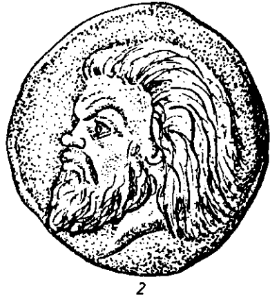
Рис. 2. Монети із зображенням Сатира (1) і Атея (2).

кому дворі сприяли організації майстерень, в яких виготовлялись різні прикраси, золоті та срібні речі. Предмети розкоші завозились і з Афін, але, певно, цього було замало, щоб задовольнити всі потреби 18 . Тому боспорські царі запрошують до Пантікапея найкращих тореутів з Аттики, а можливо, і Фракії. Таким чином, на Боспорі вперше складається така ситуація, коли починається масове виробництво найрізноманітніших виробів із золота, срібла, бронзи, які в основному йдуть на потреби скіфської, боспорської і сіндо-метотської еліти.