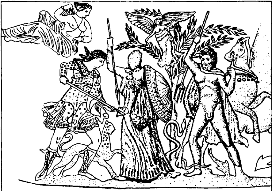
Рис. 3. Діоніс, Афіна і Посейдон (деталь розпису пантікапейської вазы).

При розгляді головної сцени на пекторалі з Товстої Могили неодноразово підкреслювалась незвичність показу для скіфського способу життя не тільки напівоголених чоловіків, але й того дійства, яким вони займаються, сидячи один навпроти одного. «Лише культовим характером сцени на пекторалі можна пояснити оголеність основних її персонажів. О. Н. Шварц, В. К. Мальберг, Н. О. Онайко переконливо довели, що оголеність була зовсім не характерною для естетики речей із північнопричорноморських пам'яток», — кон-