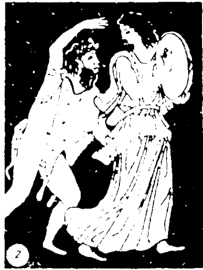
Рис. 5. Діоніс (деталь розпису аттичної червонофігурної амфори кінця VI ст. до н. е. (1), Сатир і Менада (деталь розпису червонофігурної пеліки 430 – 420 рр. до н. е. (2).

дах і на сцені виступали у волохатому вбранні 34 . На червонофігурних посудинах V – IV ст. до н. е. сатири і Діоніс нерідко зображувались з хутрами перелічених тварин на грудях, спині або накинутими на плечі (рис. 5). В Афінах стояла статуя оголеного Пана з шкурою на плечах 35 . Афінські вазописці також показували культові сцени, де Діоніса у вигляді маски, прив'язаної до дерева чи стовпа, вбирали у різний одяг, прикрашали вінками й приносили дарунки 36 (рис. 4, 3). Цей ритуал зберігався і в культі Діоніса-Сабазія, про що свідчать рельєфні зображення на кам'яних вотивних плитках з Фракії 37 .