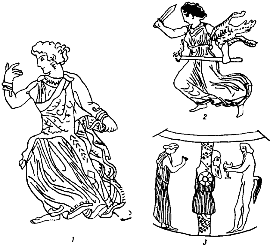
Рис. 4. Зображення менад у шкурах тварин на розписних вазах V – IV ст. до н. е. (1, 2), ритуальна сцена біля статуї Діоніса (розпис на стемності V ст. до н. е. (3).

Серед багатьох божеств, яким поклонялись різні за своїм етнічним походженням народності, є один культ, де завжди застосовувались без будь-якої таємничості шкура вівці, кози, оленя, бика чи пантери і обов'язковим було оголення хоча б верхньої частини тіла. Саме в діонісійських містеріях учасники одягали чи вішали на себе хутра цих тварин, прикрашали статуї Діоніса та його постійних супутників — сатирів, пана, силенів, що наділялись атрибутами тварин, — довгою шерстю, козячими або кінськими хвостами, в обря-