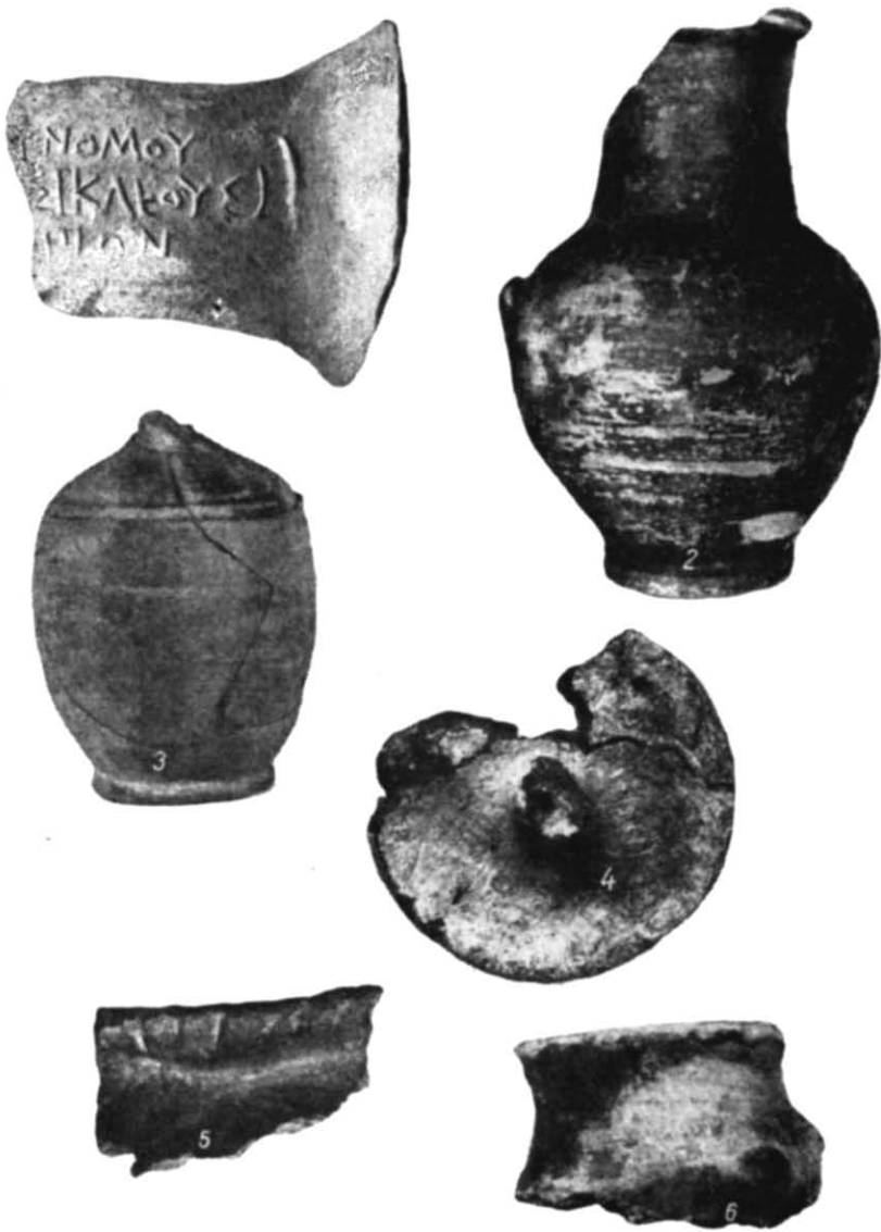
Рис. 3. Речові знахідки.

В процесі розкопок на поселенні було знайдено багато різного посуду як привізного з метрополії, так і ольвійського виробництва.