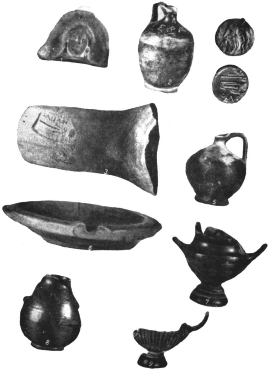
Рис. 4. Речові знахідки.

доські, сінопські астіномні (рис. 3, 1). Великою різноманітністю від- різняється чорнолакова кераміка, серед якої особливо часто зустрічаю- ться канфари (рис. 4, 6, 9), іноді великих розмірів, витонченої форми,