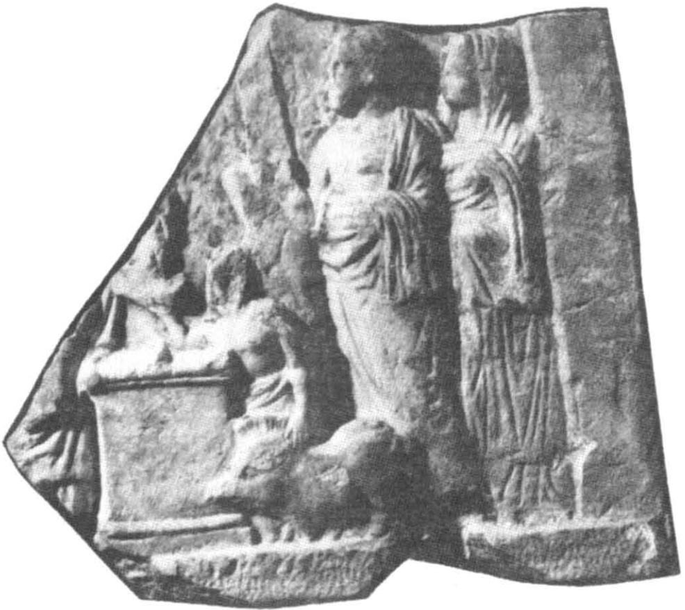
Рис. 2. Сцена жертвоприношення. Фрагмент вотивного рельєфу. III ст. до н. е.