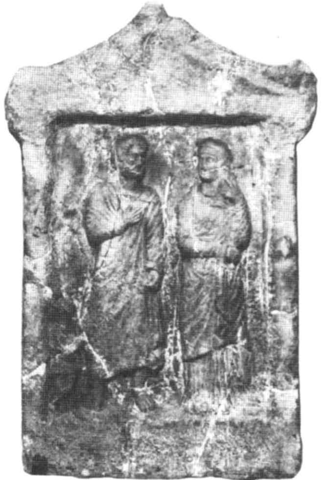
Рис. 4. Надгробна стела з зображенням ольвійської сім'ї та домашнього раба.

У демократичних полісах кожен державний діяч повинен був володіти