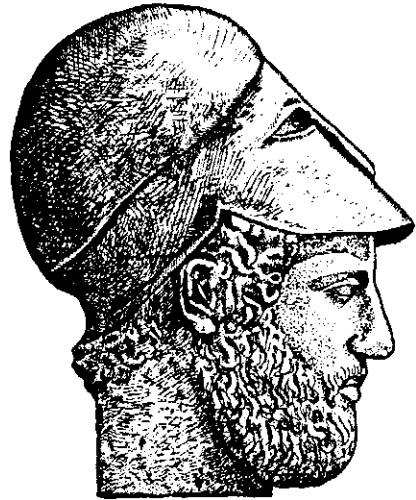
Рис. 1. Перікл. Скульптурний портрет. V ст. до н. е.

У зв'язку з останнім цікаво відзначити, що саме близько до цього часу в Ольвії зафіксована серія присвятних написів на постаментах мармурових статуй і колонах Аполлону Дельфінію від сакрального союзу мольпів, які про-