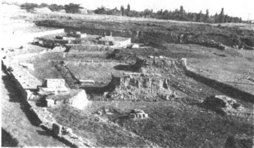
Рис. 5. Загальний вигляд західного теменосу Ольвії.

Загалом, як свідчить розгляд епіграфічних джерел, в Ольвії найбільше вираження знайшли другий і третій види демократії (за Арістотелем), тобто державні посади в основному обіймали громадяни за походженням, які володіли певними достатками і мали змогу виконувати громадські обов'язки.