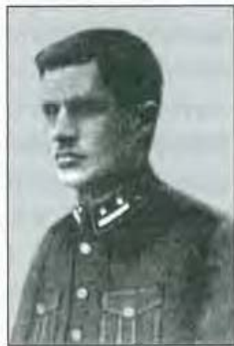
Сергій Нагнибіда (в однострої поручника Армії УНР)

Народився 1 вересня 1898 р. в маєтку Нагнибіда Кременчуцького повіту Полтавської губернії. Його батьками були заможний селянин Лука Нагнибіда і Євдокія Животанська. У 17-річному віці закінчив 6-класну реальну гімназію в Кременчуці. Із початком Першої світової війни добровільно зголосився на службу до російської імператорської армії. У липні 1915 р., маючи потрібний освітній ценз, як „вольноопределяющийся” 1-го розряду був скерований до 14-го запасного піхотного полку. Через чотири місяці разом з маршовою ротою виїхав на фронт для поповнення 17-го Архангелогородського піхотного полку, після прибуття до якого був приділений до унтер-офіцерської школи. Протягом травня–грудня 1916 р. вчився в 1-й школі прапорщиків Південно-Західного фронту, по закінченні її, одержавши перший офіцерський чин, повернувся до свого 14-го піхотного запасного полку 18 .