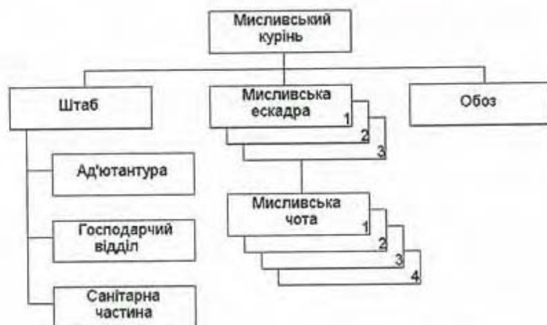
Схема 3. Проект організації мисливського куреня військової авіації Армії УНР