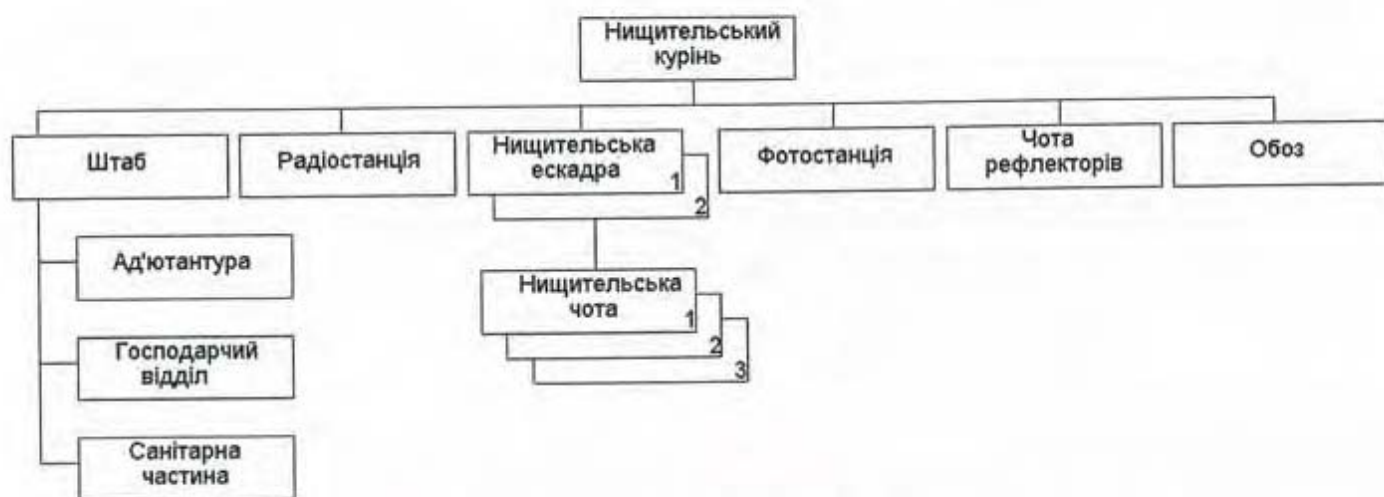
Схема 1. Проект організації нищительського куреня військової авіації Армії УНР