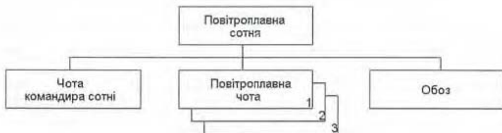
Схема 4. Проект організації повітроплавної сотні військової авіації Армії УНР

у питаннях технічного, господарчого й персонального характеру він підлягав начальнику Літництва армії, який керував ним через своє управління 6 .