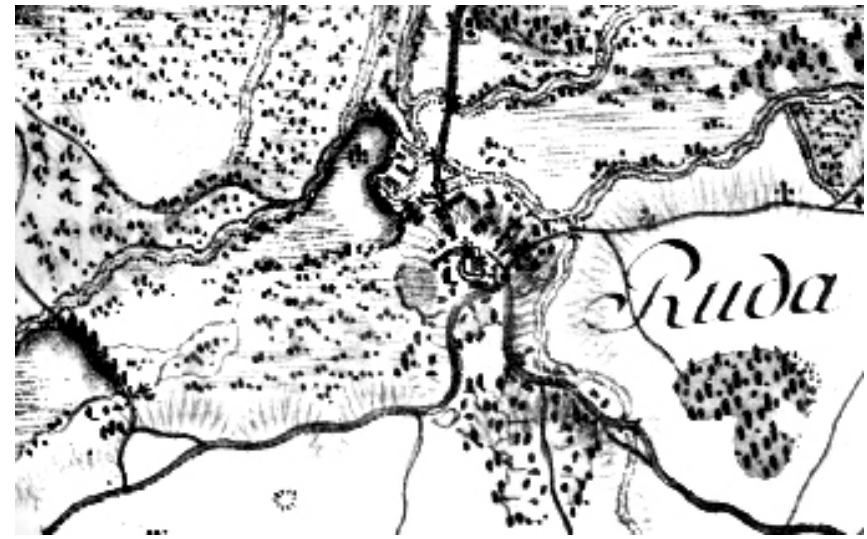
Рис. 3. Укріплений двір Даниловичів-Виговських кінця XVIII ст. (Карта Ф. фон Міга).

суміш, до складу якої входять великі камені та цегла-пальчатка, що чітко виділяються на фоні розкопу. Товщина залягання розвалу фундаменту становить 0,30–0,40 м.