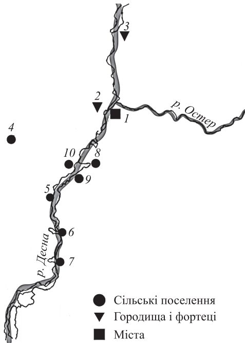
Рис. 1. Територія Козелеччини за ілюстрацією 1552 р.: 1 – Городок Остерській (Старий Остер); 2 – Виползов; 3 – Моровськ; 4 – Черни; 5 – Жукінь; 6 – Коленці; 7 – Рожни; 8 – Євмінки; 9 – Крехаєв; 10 – Боденкі

мот можна вважати видану Володимиром Ольгердовичем після його приходу на київський престол (1362–1392 рр.). Він пожалував землі Козелеччини і Остерщини Юрію Івановичу Половцу-Рожинському, а саме городища Рожни, Крехаєв, Светільнов. Після приходу Вітовта до влади він відбирає у Половця-Рожинського і відає Остер, Боденьки та Виповзів, а також їхні землі, Дмитру Сокирці. У подальшому земля передається від одного власника до іншого, що говорить про залюдненість цих земель [1, с. 9–11].