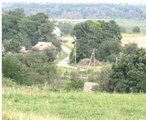
Вигляд на Царину і русло р. Супій із Золотої гірки.

Одна із ніш, у якій знаходився горщик та інші керамічні вироби.