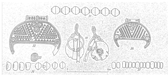
Ювелірні вироби зі скарбу с. Дениси, знайдені Т. Хворостовським, частина з яких виготовлена у Візантії та окремих західноєвропейських країнах. Датуються приблизно VI–VIII ст. н.е.