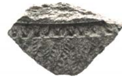
Фрагмент кераміки, знайдений на Царині (II тис. до н.е.).