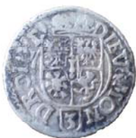
Західноєвропейська срібна копійка XVI ст. Знайдена в центрі с. Дениси.