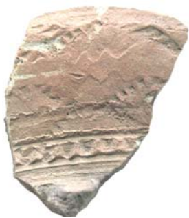
Уламок кераміки з побутового посуду з культурного шару періоду Київської Русі (центр с. Дениси).