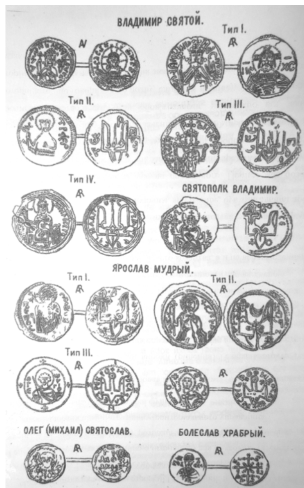
Копійки періоду Київської Русі зі скарбу с. Дениси, знайденого Т. Хворостовським.