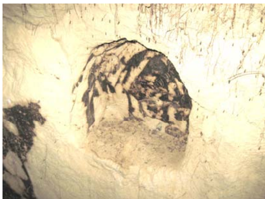
Фрагмент печери із Золотої гірки.

Одна із ніш, у якій знаходився горщик та інші керамічні вироби.