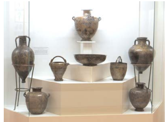
Грецький бронзовий посуд V–IV ст. до н.е., знайдений неподалік від с. Дениси в руслі р. Супій. Зберігається у Національному музеї історії України (м. Київ).