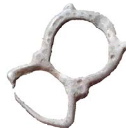
Металеві предмети з культурного шару періоду Київської Русі. Знайдені в центрі с. Дениси.