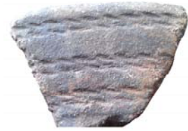
Фрагмент кераміки епохи міді–бронзи, знайдений на Царині (II тис. до н.е.).

визначили дату заснування с. Дениси – Городища щонайменше у IV–III ст. до н.е. і визначили цю дату (як і заснування на основі археологічних артефактів й інших населених пунктів України) на законодавчій основі.