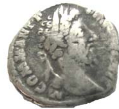
Римська копійка періоду правління імператора Коммода, знайдена на Царині (180–192 рр. н.е.).