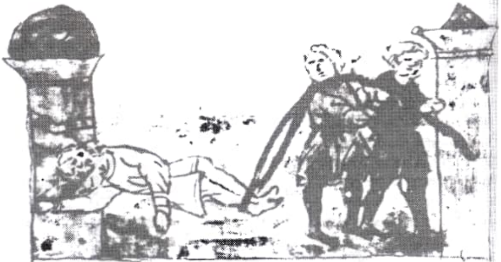
ПОВІДАША ВОЛОДИМИРДІАКО ПОДІВРІТЬМЪ НАПОРГОВИ

Щоб належним чином оцінити мужні дії Володимира, треба врахувати, що було йому тільки 15 років. Народився цей княжич у рік смерті батька. Мати його, Любава (так подав її ім'я В.М.Татищев) — дочка новгородського посадника, отже, з погляду киян, походження не аристократичного, була другою жінкою Мстислава-Гарольда. Залишивши цього юнака за себе в Києві, Ізяслав поклав на нього тягар важкої відповідальності. І він зробив усе, щоб врятувати Ігоря, бо розумів, якою ганьбою це вбивство залямує честь Мстиславичів. Діяла в його свідомості й мотивація класова, феодално-етикетна: вбивство Рюрикovichа, колишнього великого князя Київського, міським плебсом було для нього річчю нечуваною, нестерпною для його князівської, родової честі. Зваживши на вік Володимира, додамо до мотивів його шляхетного і сміливого вчинку і гуманність — не стільки ту помірковану гуманність, що її демонстрував дід його Володимир Мономах, як чисті почуття юної, не зіпсованої це облудним світом людської істоти.