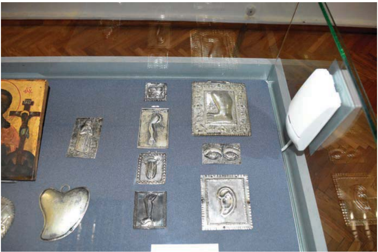
Вотивні зображення. З колекції НМІУ

Сам факт ігнорування в реєстрах чудес описів дарів взагалі, а особливо таких семантично забарвлених, як привіс у формі частини людського тіла, побічно свідчить про те, що на момент їх укладання подібні привіски чи обітниця зробити такі після доконаного чуда, ще не стали „стрижнем” чи передумовою самого чуда. Основні ритуали, пов’язані із чудом – піший поклон, найняті молебні, вживання святої води від омиття ікони, маніпуляції з елеєм, що горів у лампадці перед реліквією, практика покладання спати в церкві з метою зцілення чи навіть замикання/приковування біснуватих на ніч біля святині – всі ці ритуали, які виконувались з надією на отримання чудесних благ, зазвичай фіксувалися джерелами. Тож брак згадок про привіси у формі хворої/зціленої частини тіла, гадаю, може бути потрактований як відсутність такої практики, особливо в масових її проявах. Поодинокі ж згадки про дари від богомольців свідчать радше про поширену практику або прикрашати святиню (намиста, срібні корони, бляшки тощо), або ж робити воскові привіси (відомі лише на теренах Правобережжя 35 ) з метою увіковічнити суть чуда 36 . Наразі нам невідомо жодної згадки про срібні вотивні привіси анатомічної форми, зроблені до