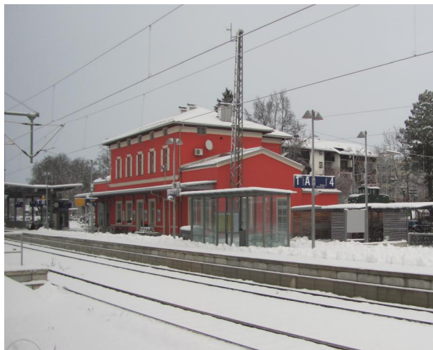
Рис. 25. Вокзал з пас. павільйонами Мурнау. Баварія

Водночас спостерігається тенденція будівництва великих залізнично-вокзальних комплексів, а також компактних навісів-павільйонів на станціях і зупинкових платформах залізниць як реакція на вимогу гуманізації довкілля для безпеки і комфорту пасажирів. Більшість таких споруд має композиційно нейтральний вигляд, що є свідченням уніфікації (рис. 26).