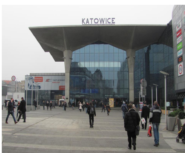
Рис. 23. Вокз. комплекс Катовіце. Польща