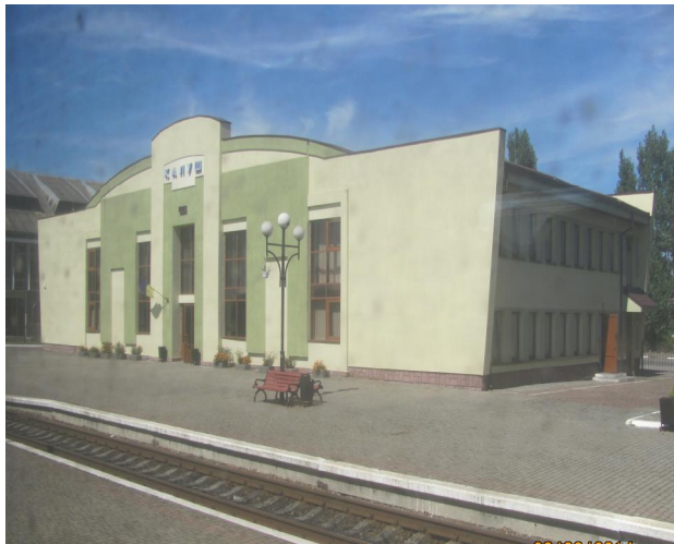
Рис. 11. Вокзал Калуш. Галичина