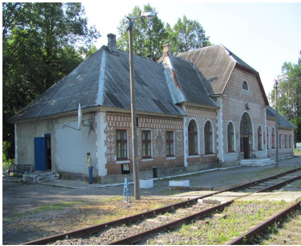
Рис. 19. Вокзал Ясиня. Закарпаття