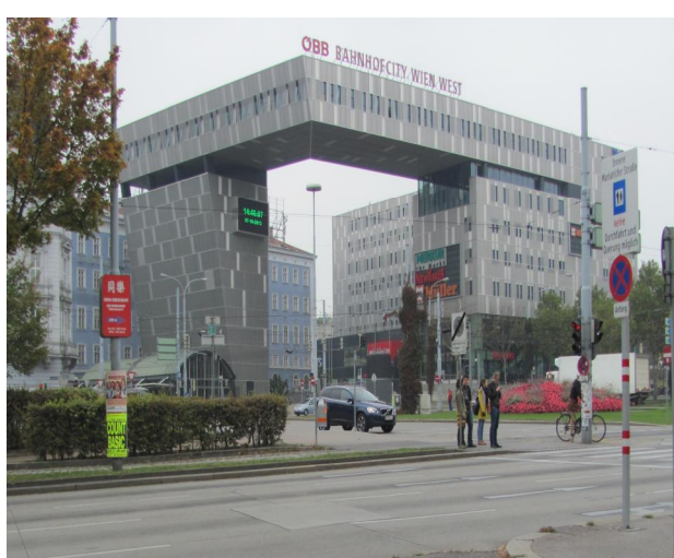
Рис. 24. Вокзал-сіті Відень Західний. Австрія