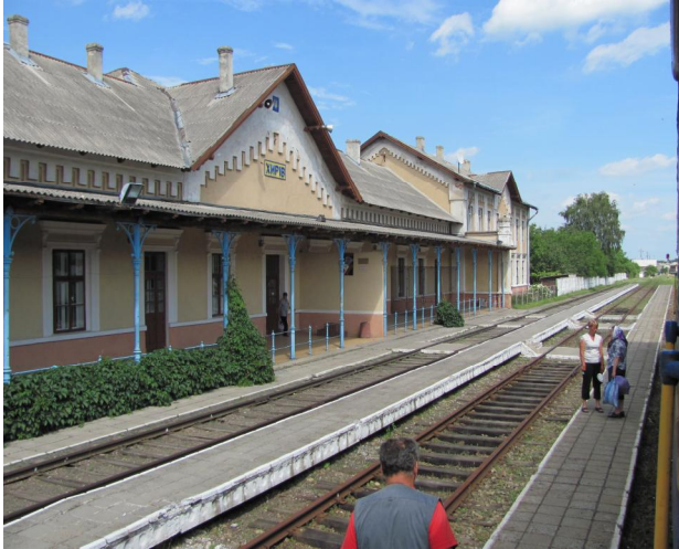
Рис. 15. Вокзал Хирів. Галичина