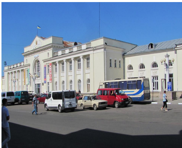
Рис. 8. Вокзал Стрий. Галичина