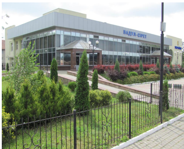
Рис. 9. Вокзал Вадул-Сірет. Буковина