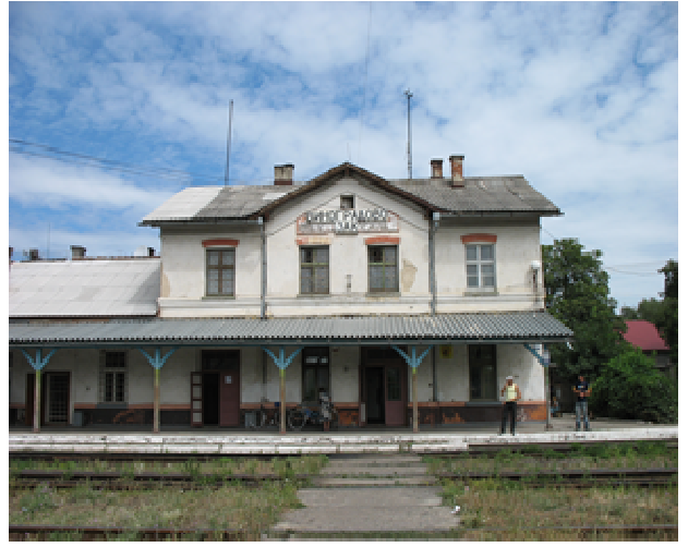
Рис. 14. Вокзал Виноградів. Закарпаття