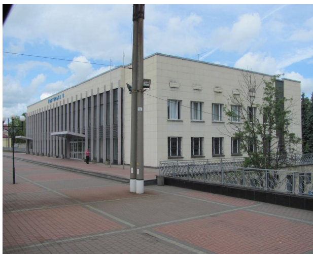
Рис. 10. Вокзал Мостиська-ІІ. Галичина