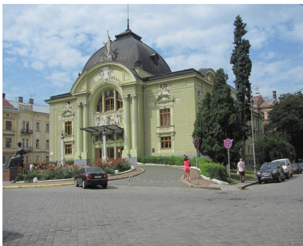
Рис. 4. Музично-драматичний театр у Чернівцях