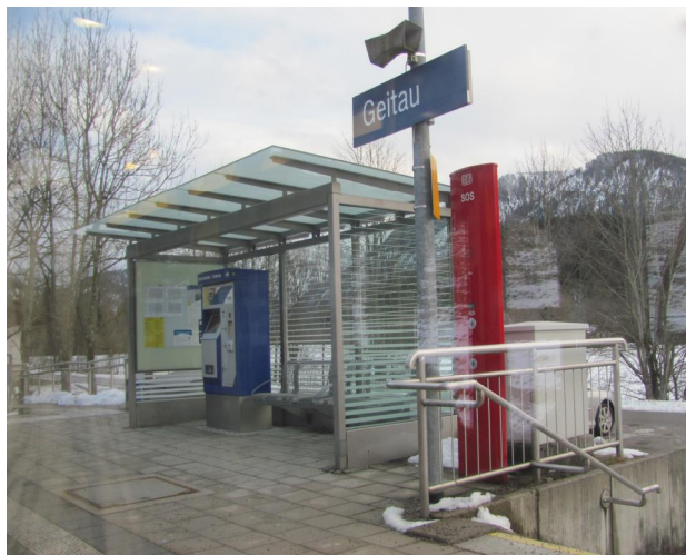
Рис. 26. Посадкова платформа Гайтау. Баварія