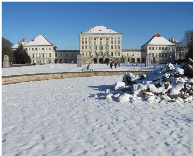
Рис. 2. Палац Німфенбург у Мюнхені. Баварія