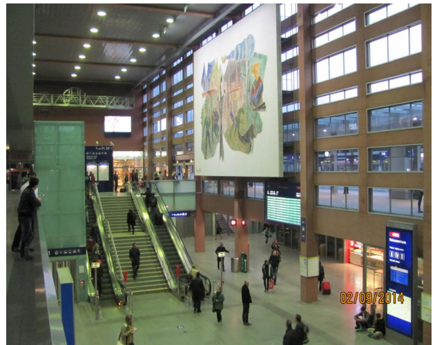
Рис. 22. Вокзал в Іннсбруку. Тироль