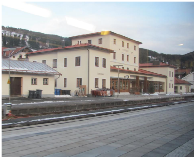
Рис. 1. Вокзал Шпірзее. Верхня Баварія