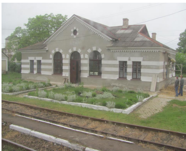
Рис. 6. Вокзал Щирець-ІІ. Галичина