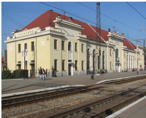
Рис. 7. Вокзал Мукачево. Закарпаття

Значна частина старих вокзалів дійшла до нас у доброму стані та продовжує функціонувати. Водночас бачимо сумний стан історичних вокзалів колії Нижанковичі – Самбір, Червоноград – Рава-Руська та ін., а також байдуже та вільне поводження з історичними об’єктами – вокзали Підмонастир (зруйнований 2012 р.), Глібовичі (стан руїни), перепланування, різні прибудови, покриття фасадів плиткою, зміна форм і покриття дахів, як скажімо у Татарові та ін.