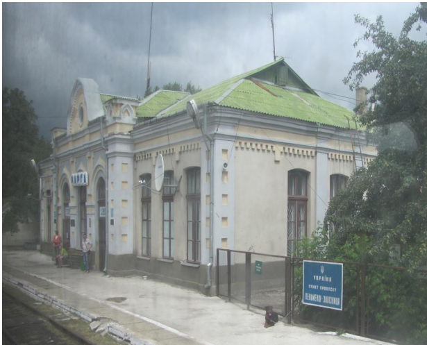
Рис. 18. Вокзал Ларга. Північна Бессарабія