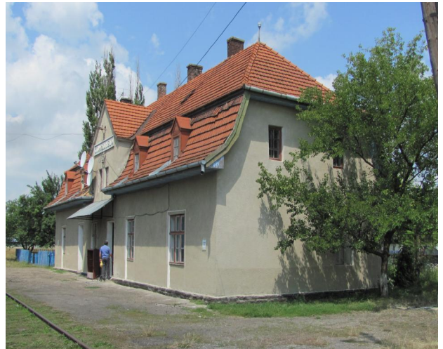
Рис. 17. Вокзал Сторожинець. Буковина