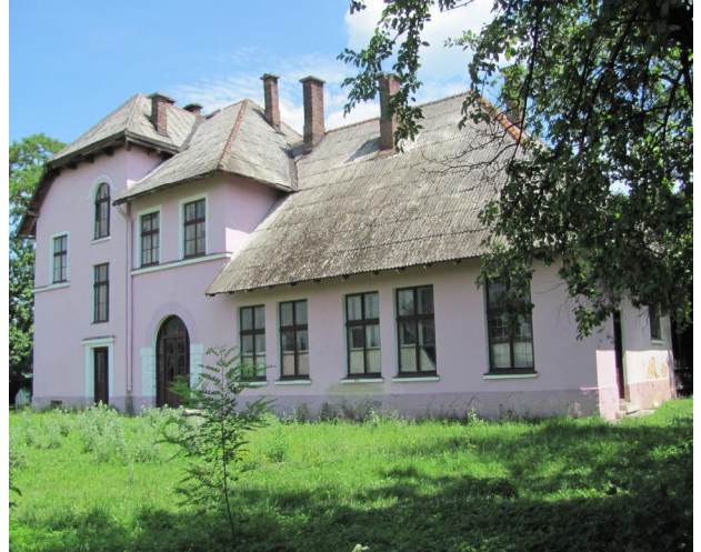
Рис. 16. Вокзал Нижанковичі. Галичина