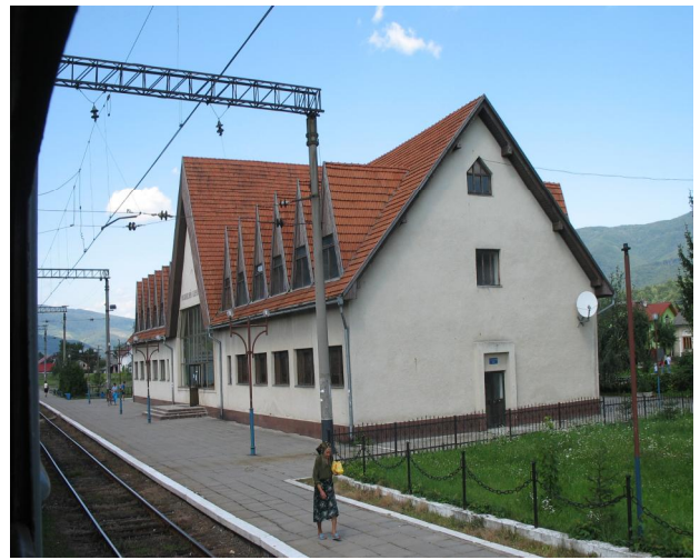
Рис. 20. Вокзал Великий Березний. Закарпаття

Круглоарковий та рустиково-стріховий архітектурні типи вокзалів були спільні в Галичині та Буковині у час Дунайської монархії, а потім появляються інші спільні після Другої світової війни. Спільні типи вокзалів трьох історичних країв виникають у радянський час. Названі типи та окремі з них мають різні способи локалізації на території – точковий, лінійний, зональний.