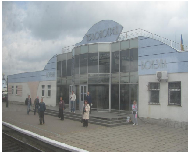
Рис. 12. Вокзал Червоноград. Галичина

Вокзали в образі поселень. При різних коліях виникали і розвивалися композиційно-стилістичні типи залізничних вокзалів, які робилися виразними й характерними для своїх місцевостей. Поруч із храмами, замками, палацами і театрами вони ставали архітектурним знаком нової епохи. Натиск, з яким відбувалося будівництво, часом супроводжувався нищенням видатних історичних пам'яток та радикальними змінами поселень – вокзал з назвою Венеція Санта Лючія на місці умисно знесеної однойменної церкви А. Палладіо; вокзал з розлогими металевими навісами над коліями, який візуально і змістовно дисонує з неподалік існуючим собором у Кельні та ін. Проте, у більшості будівництво залізниці, станції з вокзалами підпорядковувалися сформованому містобудівному й архітектурному контексту. З часом залізнично-транспортна галузь сама почала формувати їхній подальший розвиток, що суттєво покращувало інфраструктуру поселень і територій та сприяло раніше небаченим темпам розвитку. Міста і села отримували нові знаки ідентичності як, наприклад, вокзали Будапешта, Відня, Гельсінкі, Львова, Жмеринки, Козятина, Лондона, Львова, Парижа та інших міст.