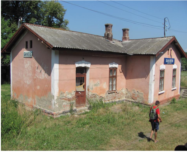
Рис. 13. Вокзал Банилів. Буковина

попереднього зламу століть і становлять справжні архітектурні знаки цих міст.