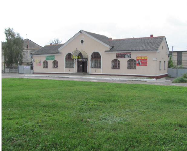
Рис. 5. Крамниця у центрі Сокалю. Галичина