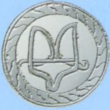
Княжий знак Святослава Ігоревича