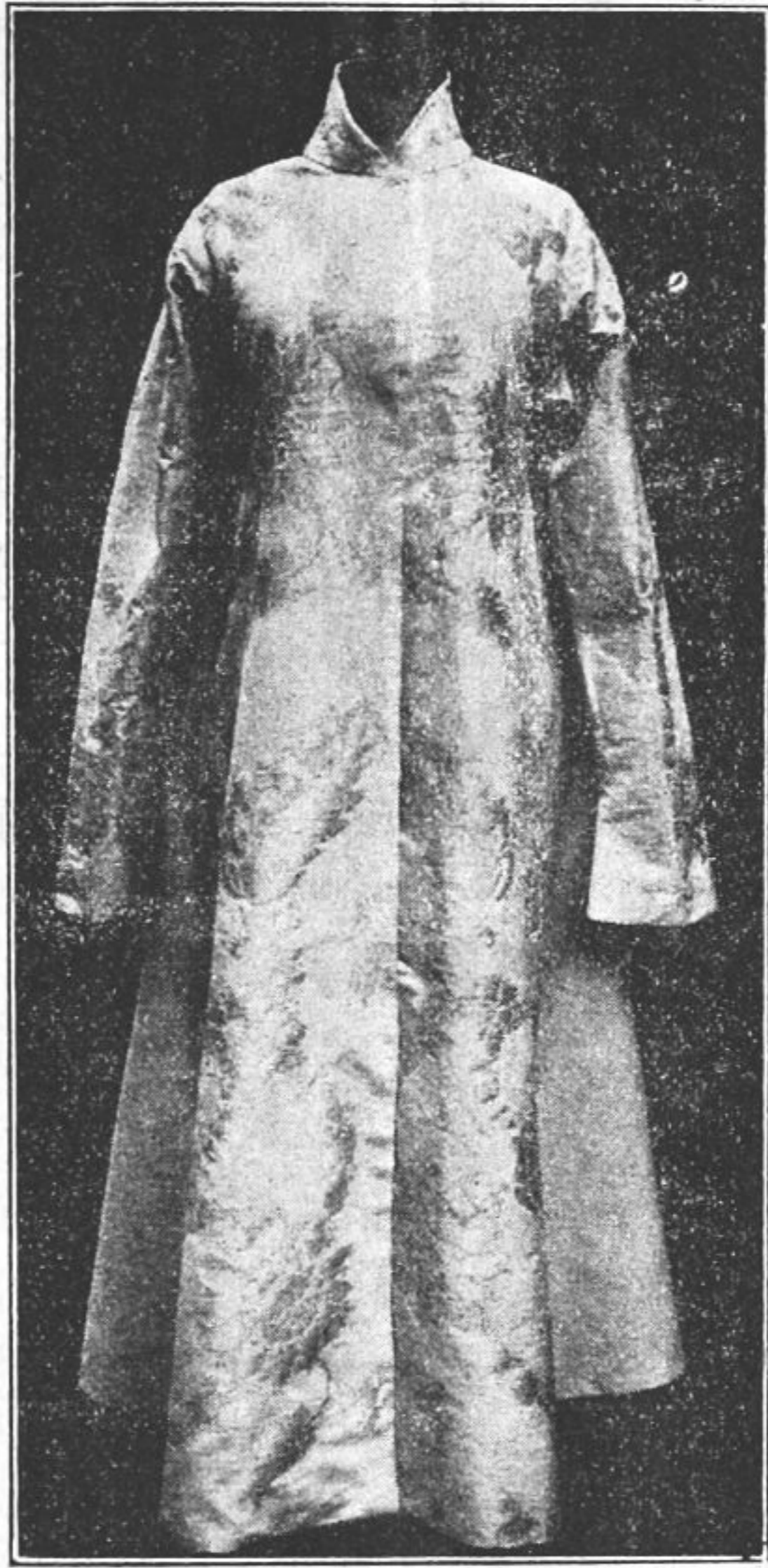
№ 4. Ляний кунтуш з срібними квітками, витканий Крелевецьким Земським Складом. Сей і другий кунтуш, такого-ж крою, вишиваний, по шовковій тканці шовком,—подано було на ралець Царівнам. За зразок для обох сих кунтушів став той кунтуш, що належав гетьманші Скоропадській (Апостолівні) і переходується в чернігівським музеї імени В. Тарновського.

ді; має відділи в Харькові й Полтаві. Та коли п. Риндя, маючи на увазі виключно свої торговельні інтереси, дбає тільки про найбільше покупний крам, такий, що на його він спостерігає більший попит,—земський Склад, з огляду на свої завдання, згромадив біля себе найкращих у місті ткачів і виробляє цілком мистецькі речі, такі, що на їх не спроможуться інші торговельні склади. Правда, між де-якими речами, що, на прохання губерського земства, постачили на виставку склади земський і Риндін, сливе нема різнації, та все-ж таки в чернігівській урочистості під час Царського приїзду земському