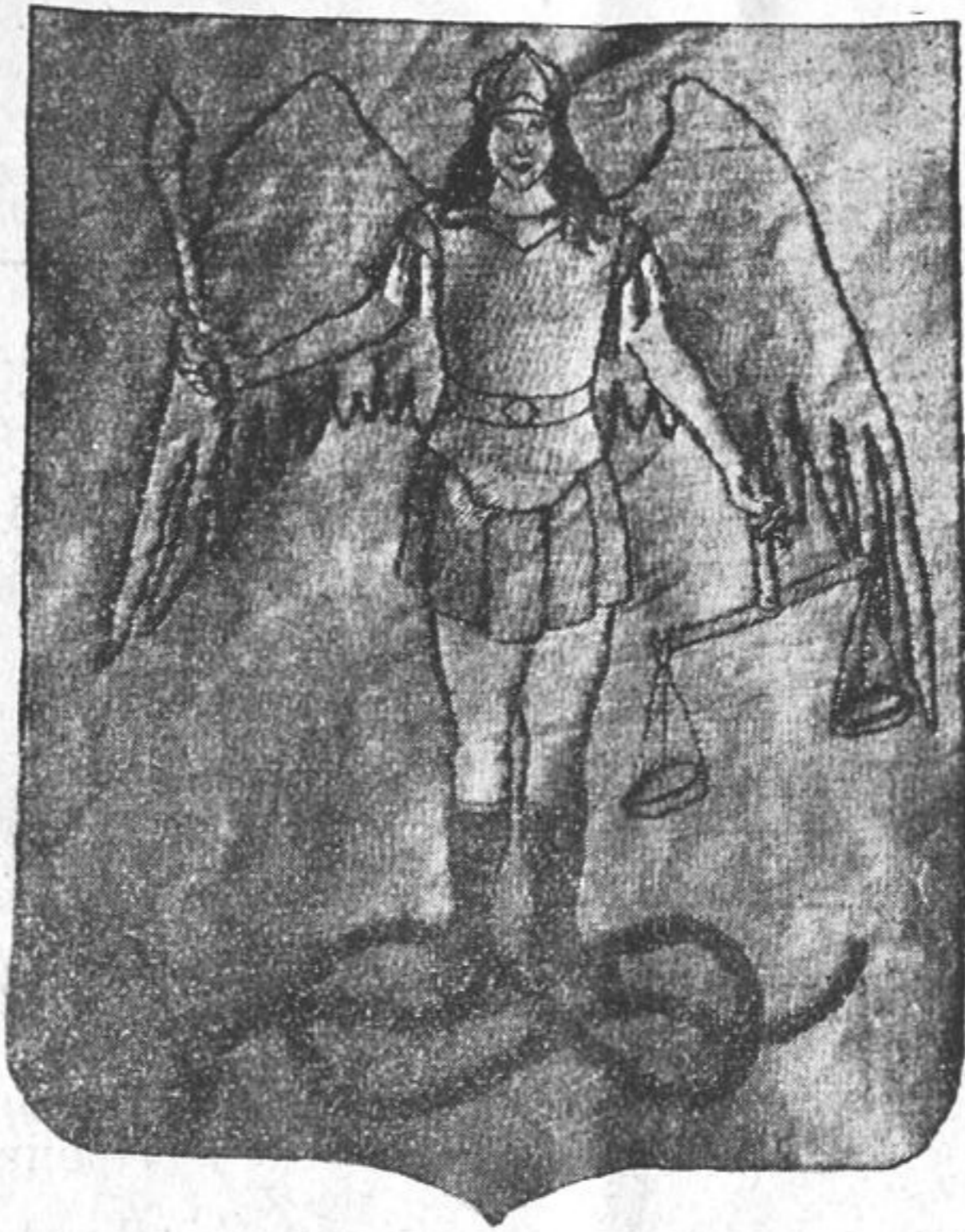
№ 2. Герб Кролевецький. Обидва герби, в числі 15-ти гербів Чернігівських повітів, були виткані в ткальні при Кролевецькому Земському Складові. Узорчата рама внизу, така як при № 1-му,—була при всіх гербах. (Див. замітку „Ткацькі вироби Кролевецького Земства“).

З огляду на те, що з виставкою треба було поспішатись, та й випала вона саме в робочу пору, трудно було сподіватись доброї споруди; тим часом дякуючи напруженому зав'язттю земства, справа вийшла гаразд. Найбагатіш і найрозмаїтніш показано було кролевецький повіт (з середньої частини губернії). Залишаючи на боці, до іншого часу, Короп, Понорницю та інші місця сього повіту, що добре були показані на виставці, подаю тепер докладніші відомості тільки про Кролевець. При тім, здається міні, не завадить подати де-які відомості про саме це місто.