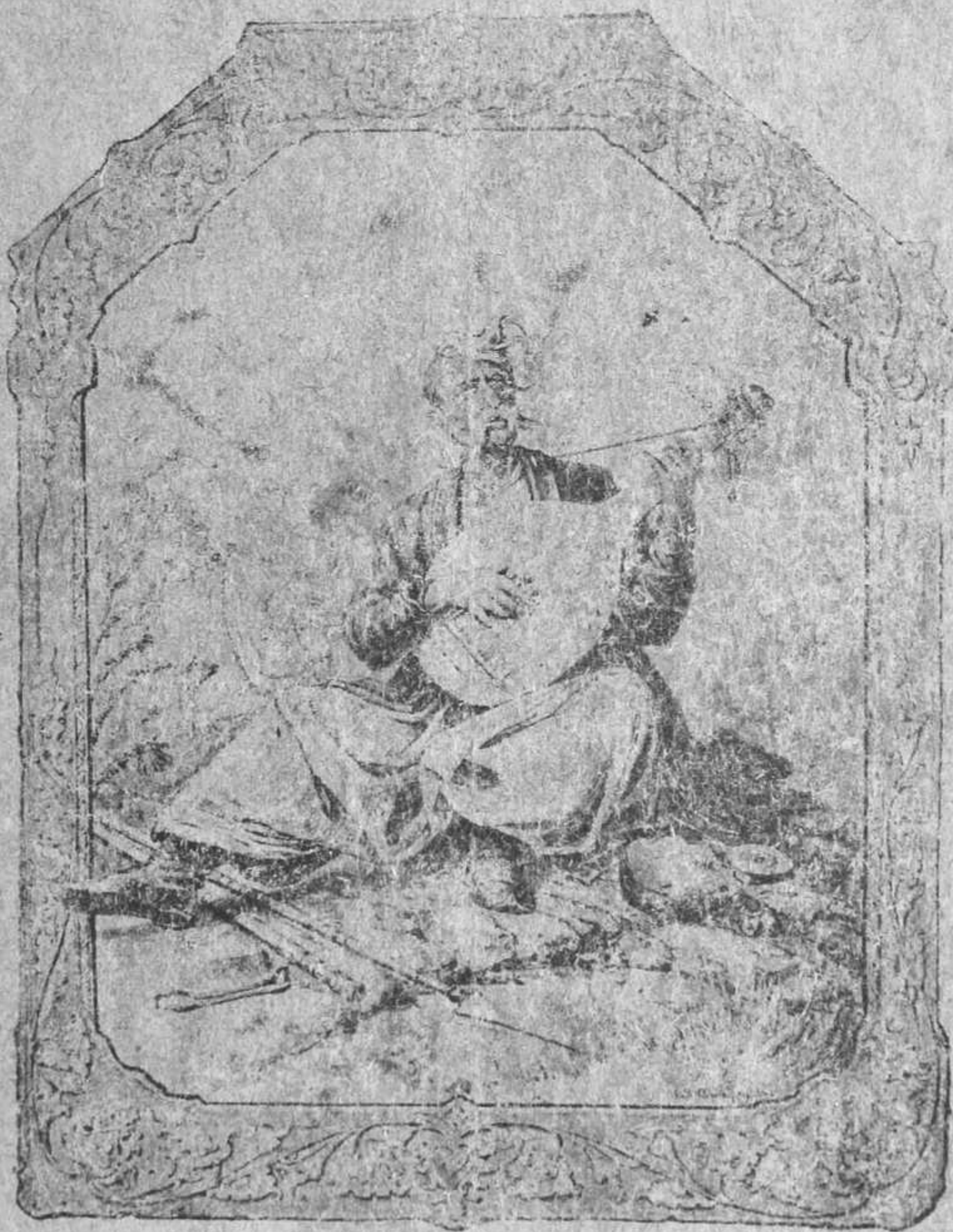
Малюнок Опанаса Сластьона.