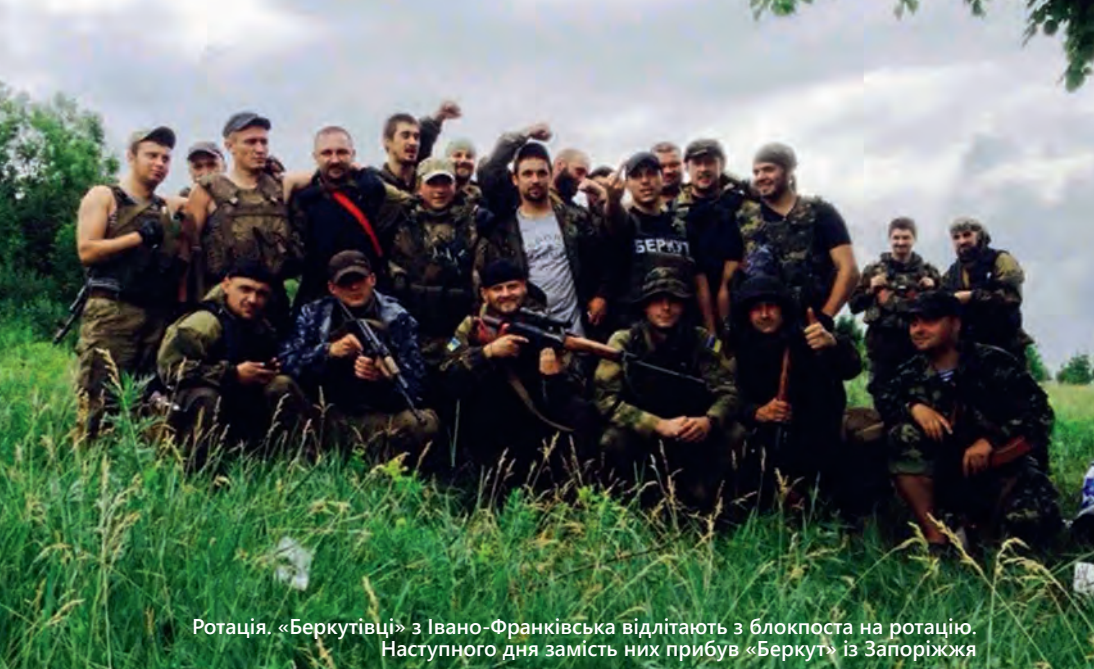
Ротація. «Беркутівці» з Івано-Франківська відлітають з блокпоста на ротацію. Наступного дня замість них прибув «Беркут» із Запоріжжя

с нами позиції занимали, там, снайпер какою-то... На всю ніч вони уходили, і ми їх провожали, коли вони вглубь туди уходили, ближче к городу. І утрім рано-рано вони нам подавали маячки всякіе, що «Мы будем сейчас идти, не стреляйте», і возвращались, ми їх пропускали. Вони на закате уходили, на рассвете возвращались.