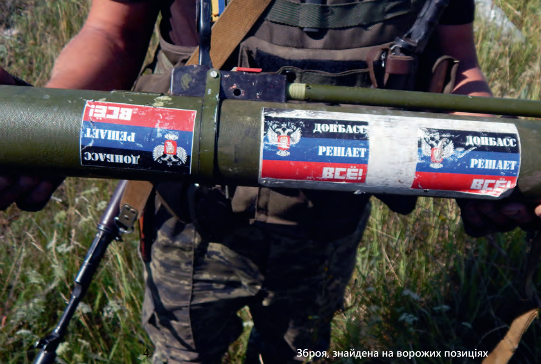
Зброя, знайдена на ворожих позиціях

У Покровську (колись Красноармійськ) був вражений, коли на базарі одна з продавчинь нам продала товари (гаки, мотузки, кріплення, дрібниці для облаштування побуту після чергового переїзду) за якісь смішні гроші. Ми хотіли розрахуватись у повну вартість, але вона наполягала на знижках. [...] Вона нам підказала, до кого з продавців не підходити, а до кого, навпаки, підійти, бо там для нас «свої люди». Дуже хотіла нам віддати безкоштовно буржуйку, бо думала, що ми мерзнемо. Пропонувала контакти «наших людей» для ремонту електричного обладнання.