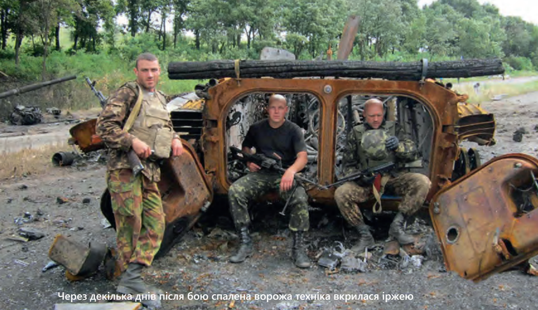
Через декілька днів після бою спалена ворожа техніка вкрилася іржею