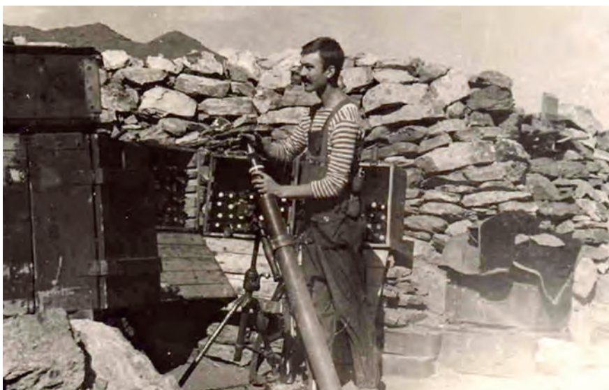
Афганістан, 1988 р., старший лейтенант та... 82 міліметровий міномет