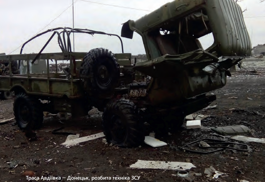
Траса Авдіївка – Донецьк, розбита техніка ЗСУ

Давайте». Это не то, что я какой-то гений экономики или бизнеса, просто чуть-чуть по-другому смотришь на вещи. [...]