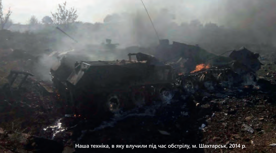
Наша техніка, в яку влучили під час обстрілу, м. Шахтарськ, 2014 р.