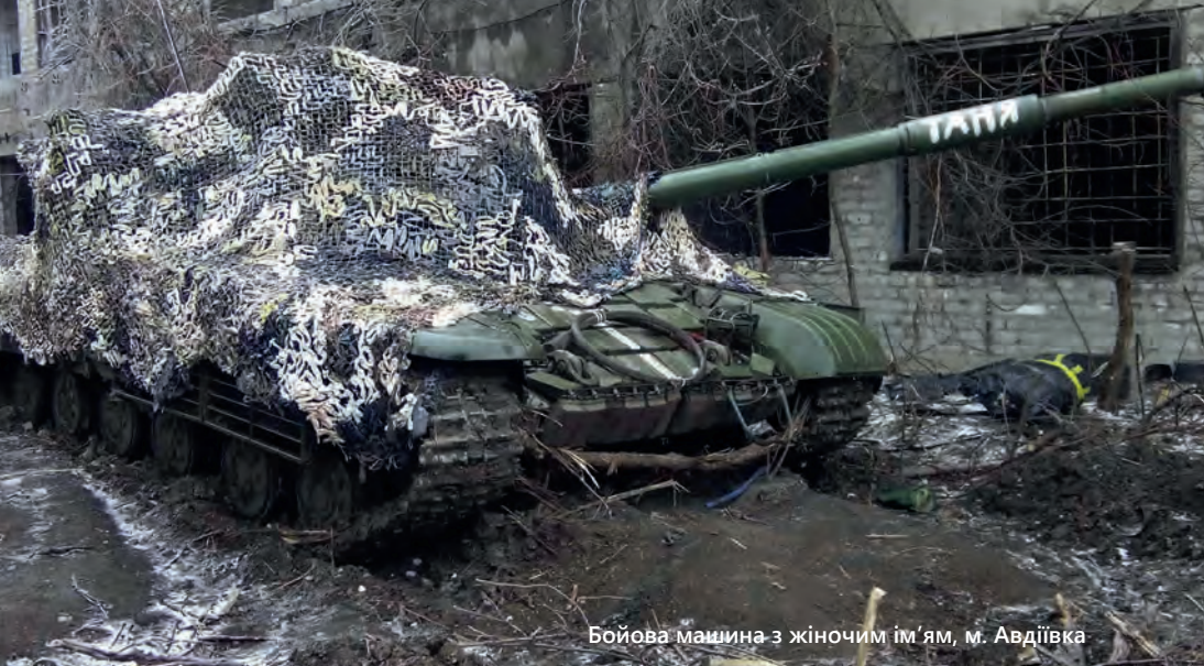
Бойова машина з жіночим ім'ям, м. Авдіївка

меня очень этим расстраивает, когда говорит: «Я – русская». Я пытаюсь донести ей: «Ба, ну уже прошло то время, когда кричали, что ты – русский. Это не есть хорошо». Русские, они, может быть, люди-то и хорошие. Люди везде есть хорошие. Я уверен, что в России... там куча ученых, писателей, актеров... Но не люди плохие, а «я-русскость» вот эта, она плохая. Они вечно: «Мы непобедимы! Нас никто...» Да вас никто и не собирается побеждать. Вы триста лет никому не нужны вообще. И я это как-то понял для себя, и мне без разницы вообще, если честно, было: русские там или нерусские. Мне вообще все равно было. У меня здесь мои товарищи, друзья. У меня есть какой-то приказ, мне все равно – там русские или нерусские.