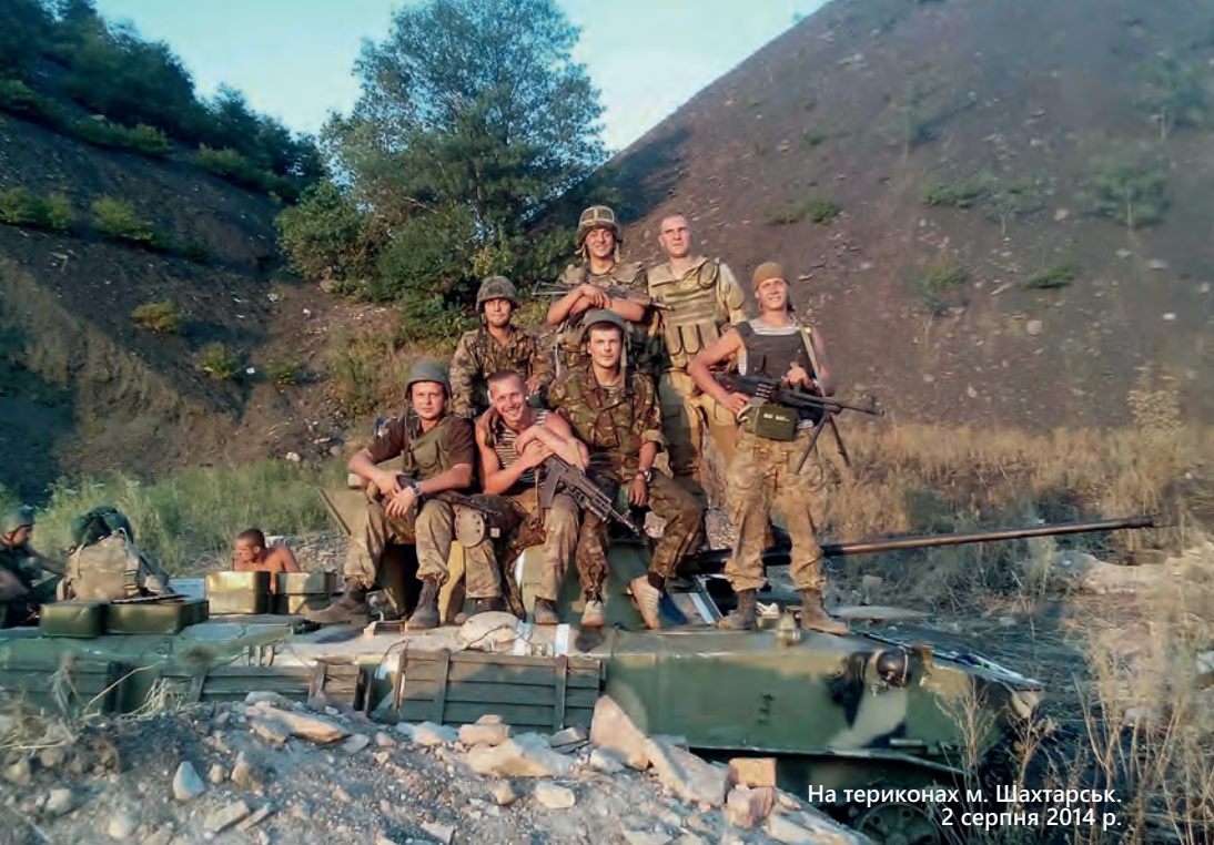
На териконах м. Шахтарськ. 2 серпня 2014 р.