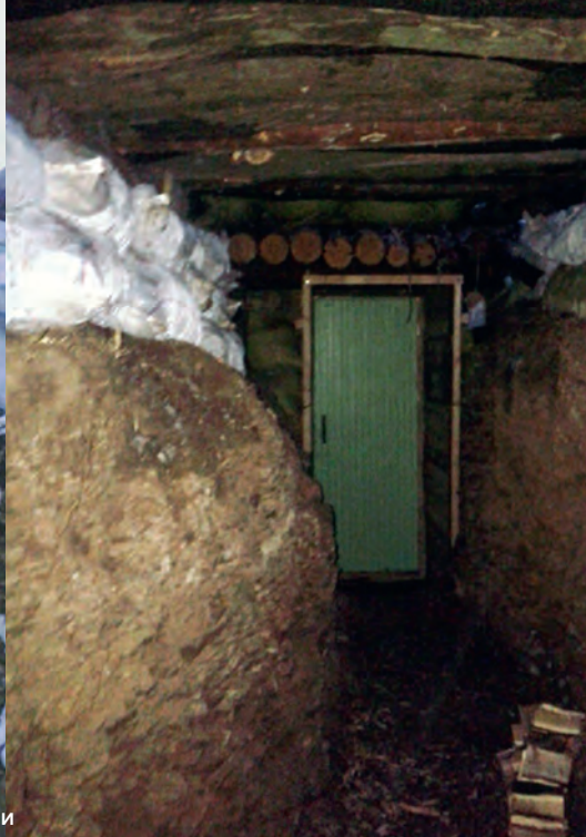
Перекриття сполучних ходів між бліндажами

ради правди – ще було троє «двохсотих» (не по г'яні), але вони самі до того йшли, і від мене нічого не залежало. Були «трьохсоті», але легкі.