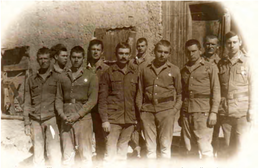
«Я та мій взвод зв'язку 2-го парашутно-десантного батальйону 345-го полку»