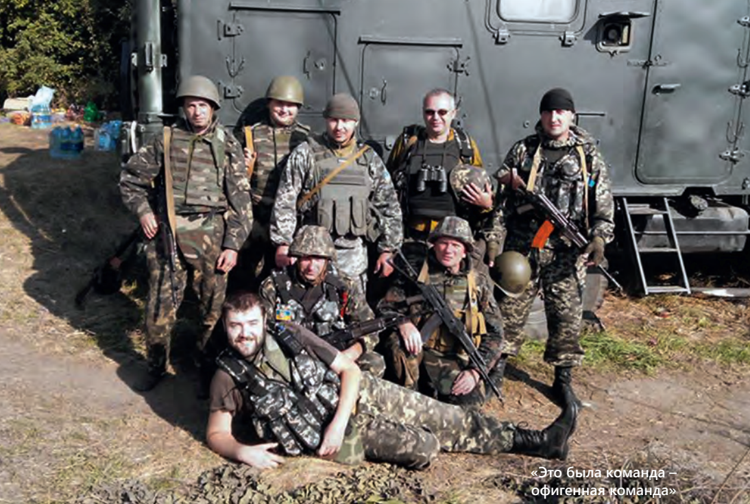
«Это была команда – офигенная команда»

Мне очень нравилось чертить, я четко понимал, я четко это видел – что там, как. Вот, наверное, такой склад ума у меня. И я понял, что я пойду в строительный институт, что девять классов мало, надо идти заканчивать, наверное, одиннадцать. Я поднажал по другим предметам, перестал бездельничать... [...] Все решается в 10-11-м классах. [...] У меня брат, наверное, стартонул с 8-го класса – и закончил с золотой медалью. Я стартонул, наверное, с 9-го. И мне было тяжело, потому что мне автоматом нарисовали «четверку» – и накрылась моя золотая медаль. [...]