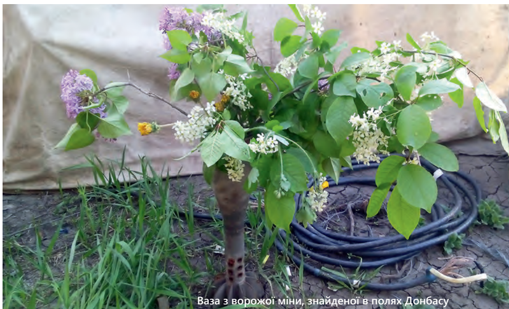
Ваза з ворожої міни, знайденої в полях Донбасу

31 рік віку після 13 з половиною календарних років служби льотної вислуги було 23 роки і 11 місяців. І я звільнився. Все ж таки звільнився. За рік до звільнення побачив, як почали нищити... Чого я почав звільнитись? Того що побачив, що фактично нищать українську армію.