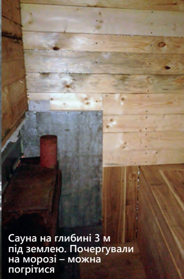
Сауна на глибині 3 м під землею. Почергували на морозі – можна погрітися

Тут була каналізація, під полом і на глибині 3,5 йшла ще вниз бочка, в яку зливалася вода. Потом, хто помився-покупався... Відро стояло – витягли воду, повиливали в поле.