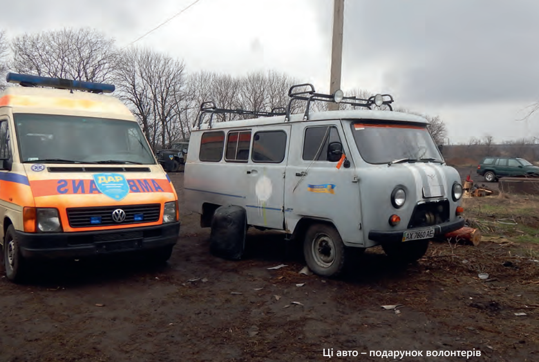
Ці авто – подарунок волонтерів

було людей відправляти туди. Мені запам'ятались ці слова. [...]