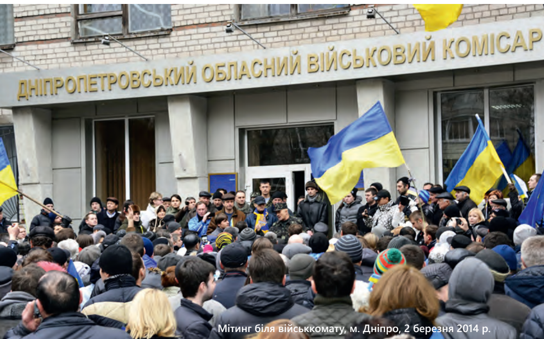
Мітинг біля військомату, м. Дніпро, 2 березня 2014 р.