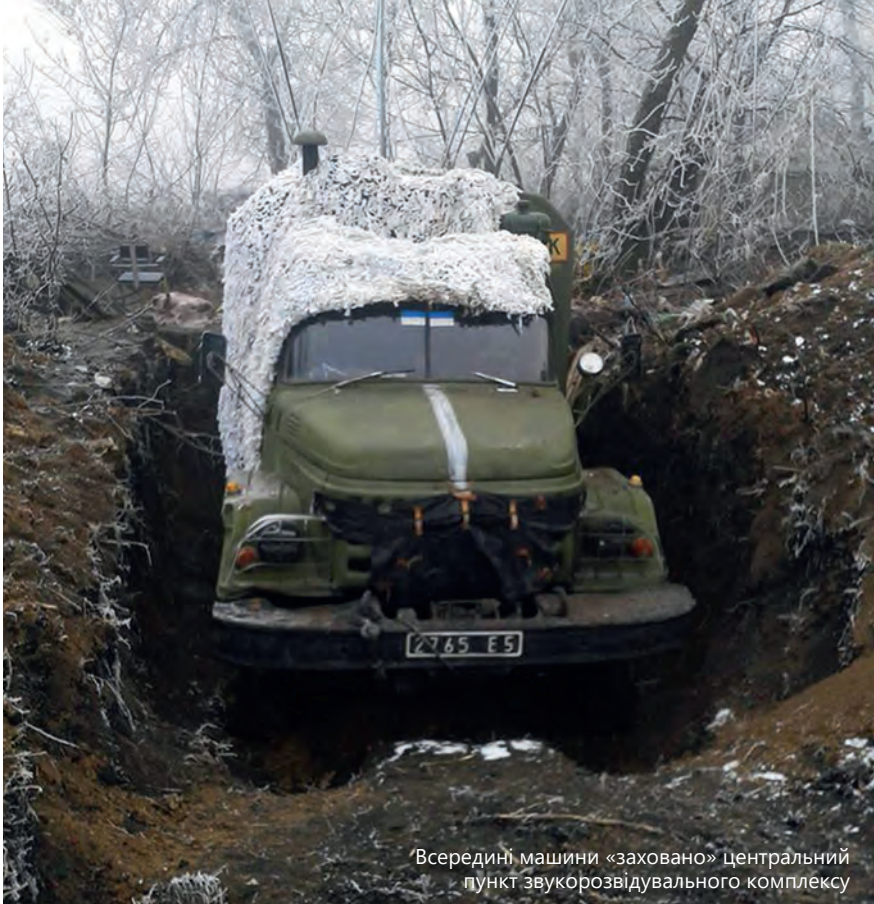
Всередині машини «заховано» центральний пункт звукорозвідувального комплексу