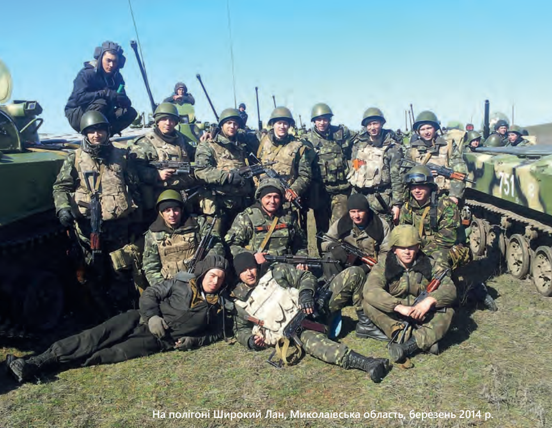
На полігоні Широкий Лан, Миколаївська область, березень 2014 р.