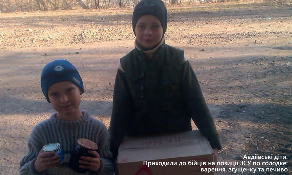
Авдіївські діти. Приходили до бійців на позиції ЗСУ по солодке: варення, згущенку та печиво

бегают. Очень много собак. Они настолько голодные были, что они срывались с цепей металлических, бегали за нами, мы им давали еду. А собака такое существо... Ты ее раз покормил – и все, она все время с тобой. У нас очень много собак было. У нас на каждой... Это был такой период... на каждой машине жила собака. У всех своя собака была.