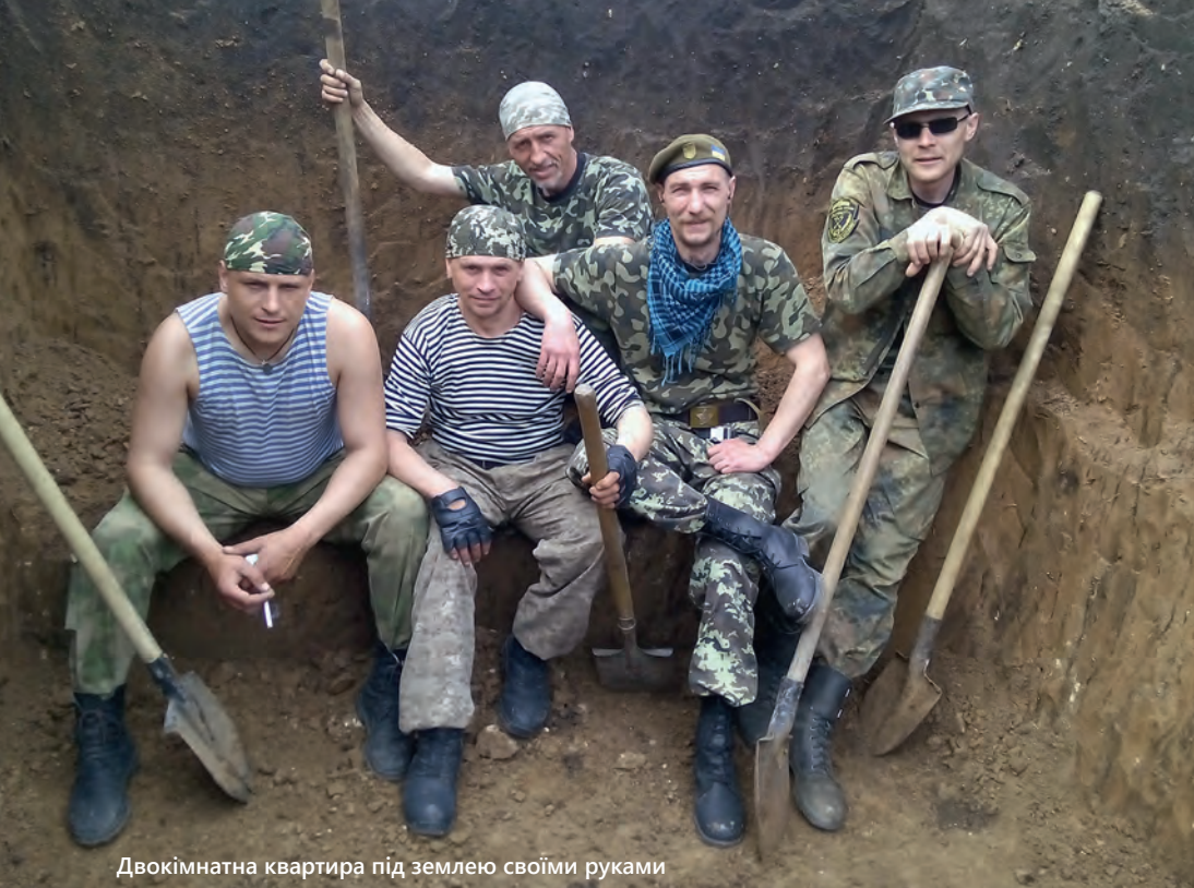
Двокімнатна квартира під землею своїми руками