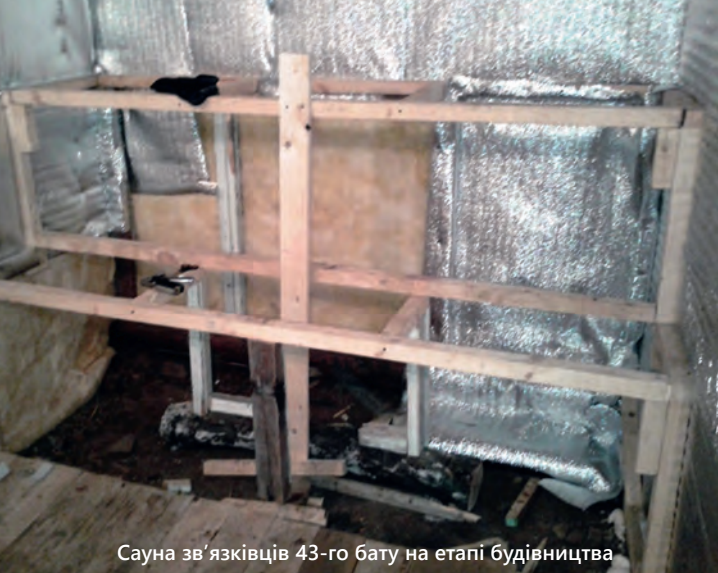
Сауна зв'язківців 43-го батю на етапі будівництва