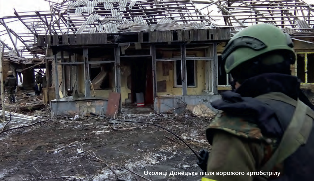
Околиці Донецька після ворожого артобстрілу

знаю, как оно потом в истории все отразится, но я надеюсь, что оно оценится по достоинству. Потому что эти ребята, беркутовцы... С них срывали шевроны «Беркута». Говорили: «Вы – убийцы». А они никого, скорее всего, не убивали. Я не думаю, что прям брали и стреляли в людей на Майдане, что именно эти ребята... Но они продолжали свою работу делать, и делали ее очень хорошо. Поэтому такое о них воспоминание, хорошее.