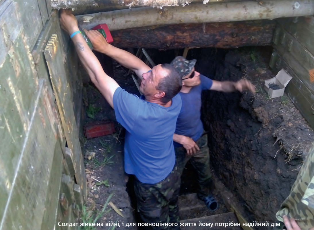
Солдат живе на війні, і для повноцінного життя йому потрібен надійний дім

[...] Я тільки в серпні 2015 року запчастин на технічну службу купив за кошти, власні кошти батальйону із металолому... на 37 тисяч. Тільки в серпні. І в мене досі єсть ті квитанції й чеки. У мене досі документація [зберігається]. [...]