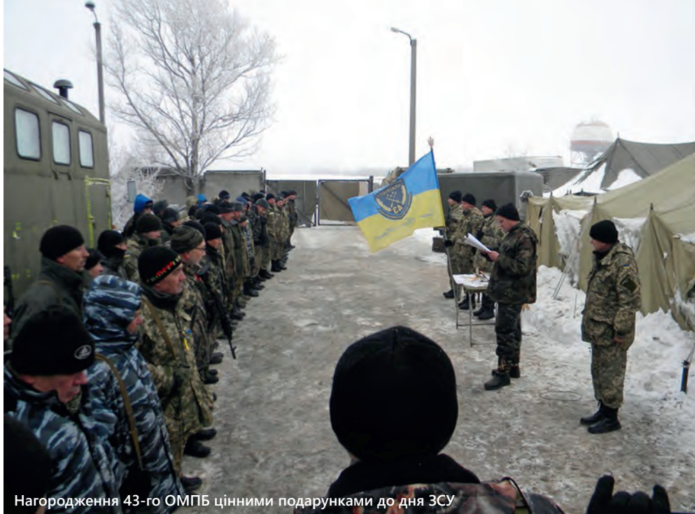
Нагородження 43-го ОМПБ цінними подарунками до дня ЗСУ

– стільки рили там, що ніхто стільки не рив. І в АТО ніхто не рив стільки, скільки мої рили. Ми завжди були в землі. І жили в землі. [...]