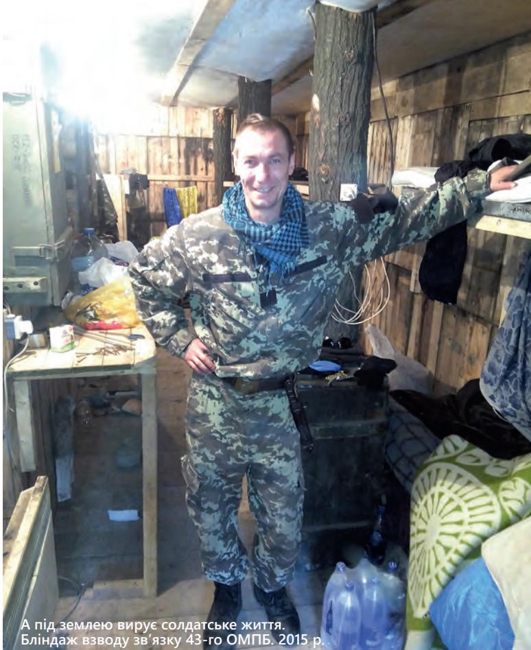
А під землею вирує солдатське життя. Бліндаж взводу зв'язку 43-го ОМПБ. 2015 р.

Тобто для вас важливо бути чесним із собою? Бути НАСПРАВДІ тим, ким ви себе відчуваєте?