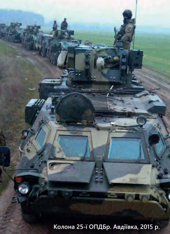
Колонна 25-ї ОПДБр. Авдіївка, 2015 р.