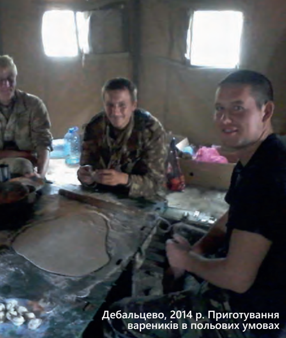
Дебальцево, 2014 р. Приготування вареників в польових умовах