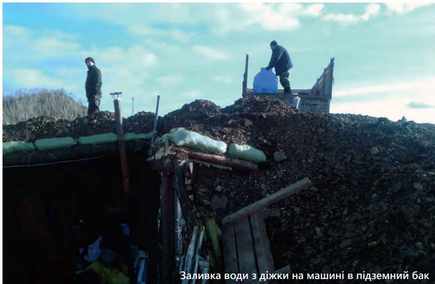
Заливка води з діжки на машині в підземний бак

Тут була маленька столова... Тут була моя кімната, тут у мене було ліжечко, тут тумбочка, тут шкафчик... Тут жила в мене кішка Муська. Тут коридорчик, тут вход, тут сауна.