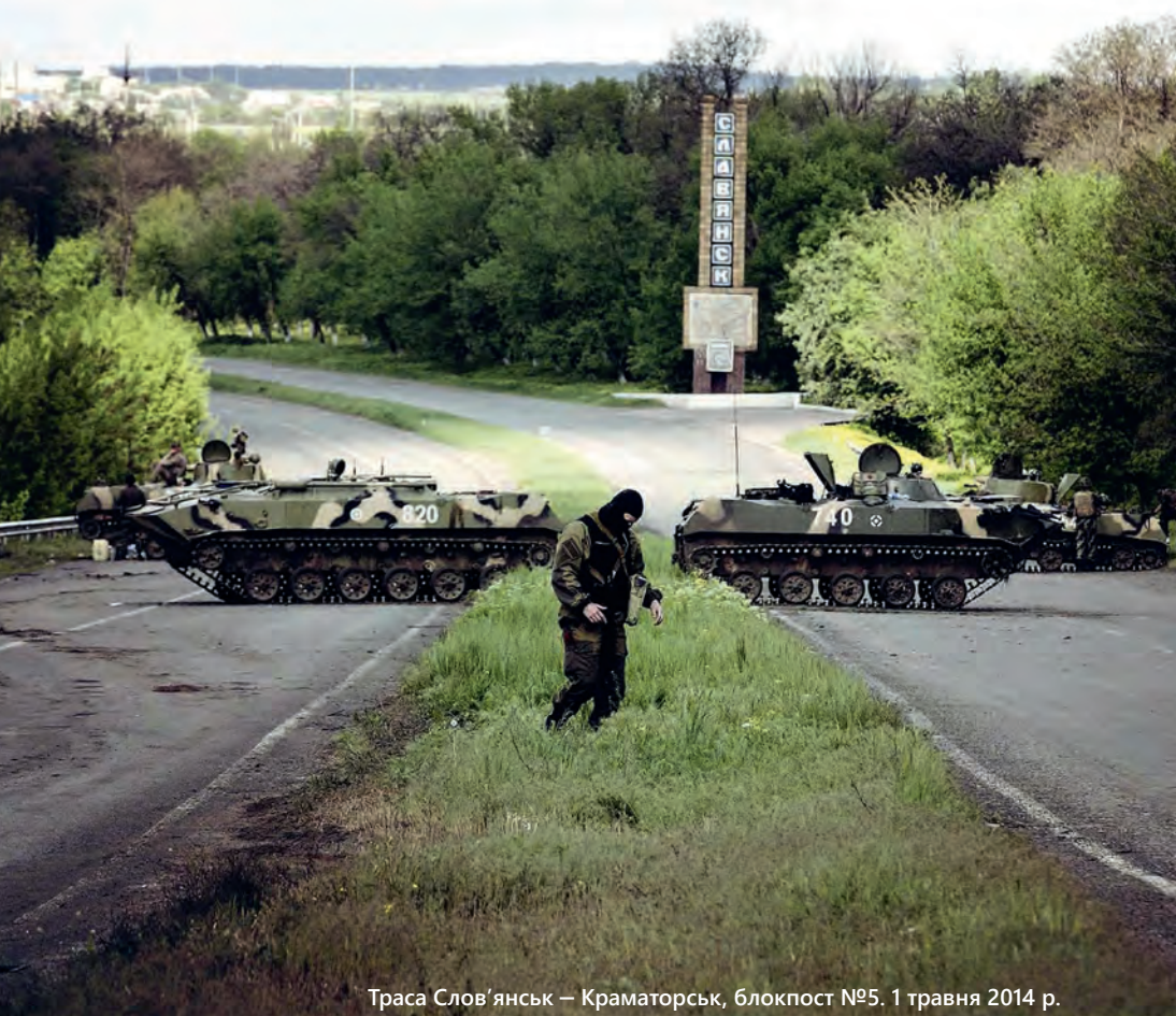
Траса Слов'янськ – Краматорськ, блокпост №5, 1 травня 2014 р.

мально было”». Мужик этот воду перестал возить. Как-то так вообще туго стало... 8 или 10 мая, не помню, первый раз начали стрелять по блокпосту.