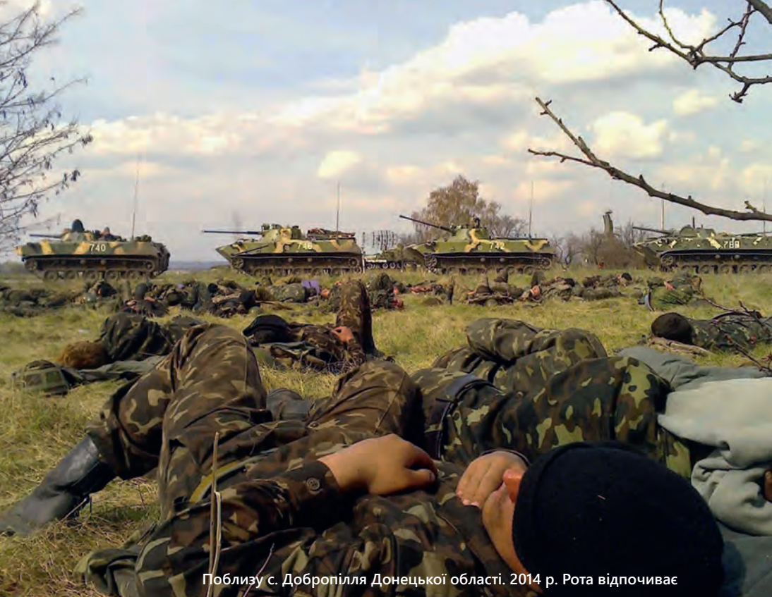
Поблизу с. Добропілля Донецької області. 2014 р. Рота відпочиває