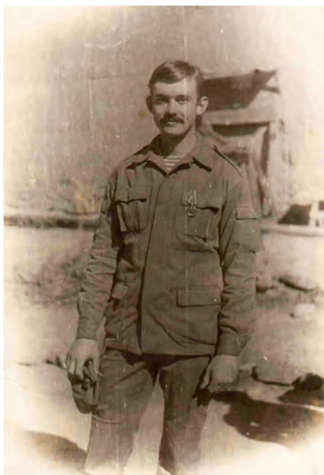
Афганістан, 1987 р.