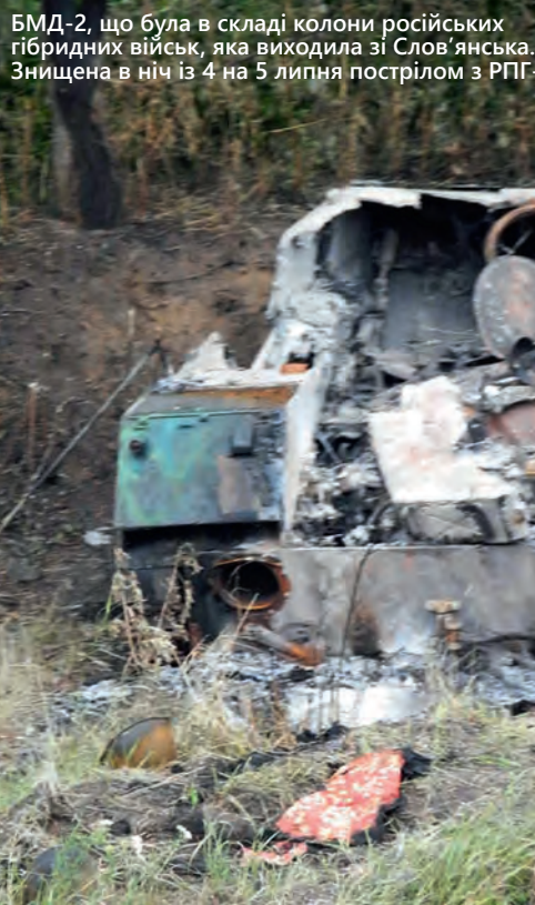
БМД-2, що була в складі колони російських гібридних військ, яка виходила зі Слов'янська. Знищена в ніч із 4 на 5 липня пострілом з РПГ.

ративное, у нас грузовик перевернулся с ребятами, и погибло трое ребят, десантников.