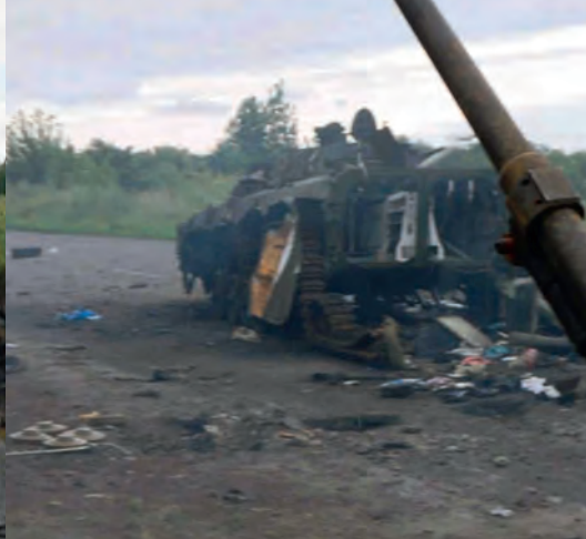
БМП-2 гібридної армії, знищені військовими 25 ОПДБр поблизу Слов'янська