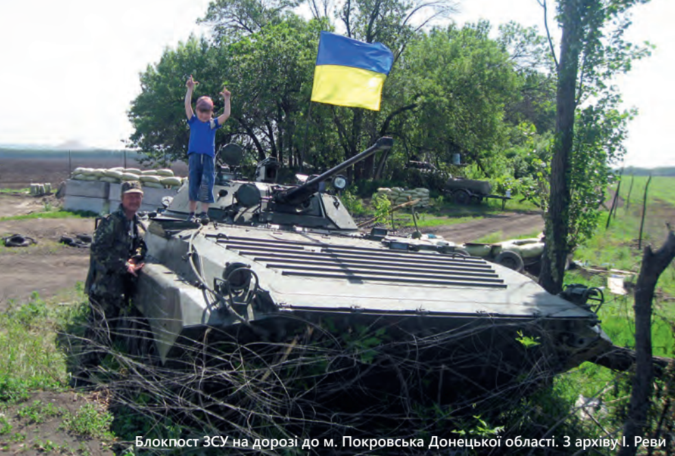
Блокпост ЗСУ на дорозі до м. Покровська Донецької області.