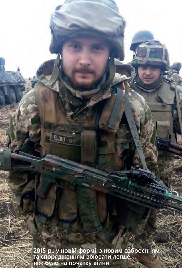
2015 р., у новій формі, з новим озброєнням та спорядженням воювати легше, ніж було на початку війни

над ним, пока до війни, еще в часті. Его все называли «Шомпол». Худой, високий... Его никто всерьез не воспринимал – капитан, командир роти... Он был наименее авторитетный командир. Я его никак обидеть не хочу, но о нем такие слухи ходили. Я его лично тогда еще не очень хорошо знал. Потом, когда оказались мы на блокпосте, он и «Героя Украины» получил не зря. Он жизни ребятам многим сберег своими действиями. Он очень мудрый, очень умный, очень сдержанный, настоящий офицер. Хотя