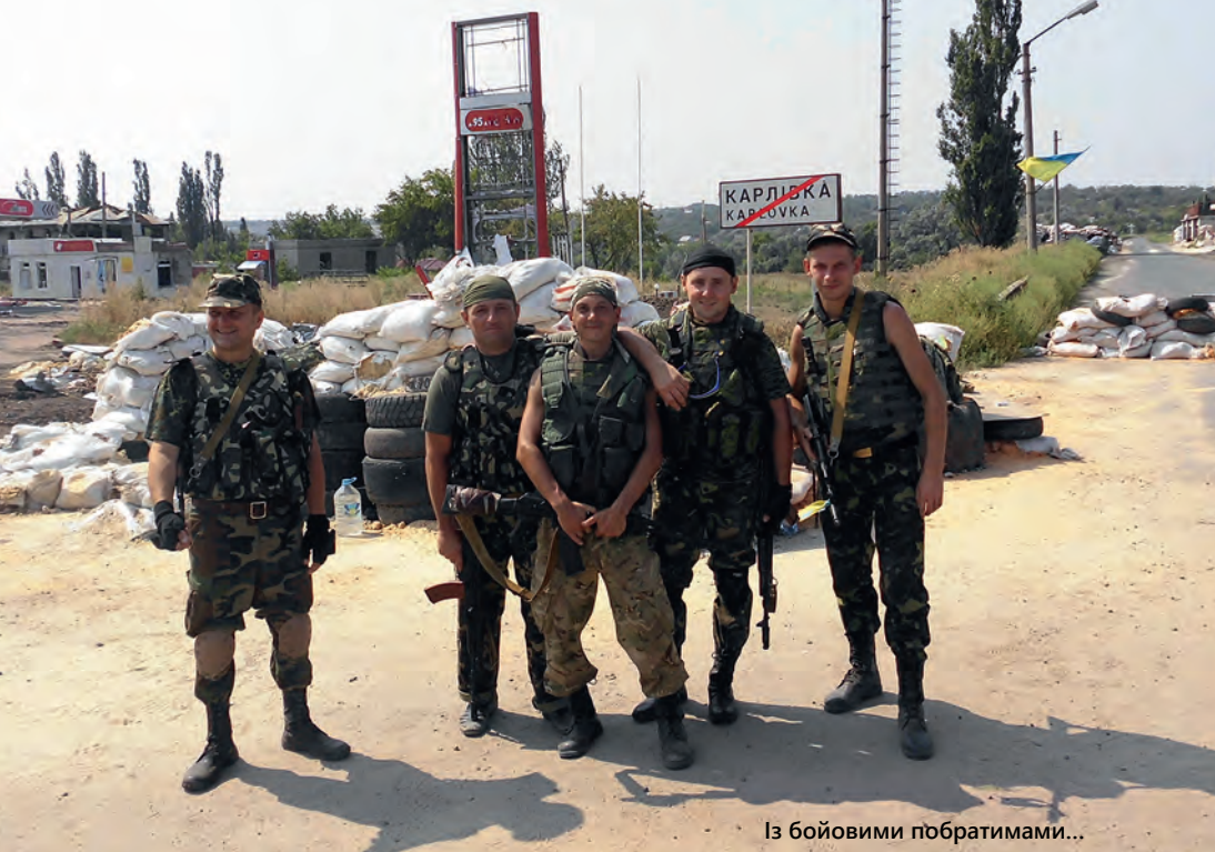
Із бойовими побратимами...

го-то решил, что будет война, и я для себя решил, что... Если придет война, буду ли я воевать с Россией? С русскими? И для себя решил, в феврале еще, что буду. Что если меня призовут, я пойду и буду защищать Украину. Потому что я видел несправедливость в этих событиях относительно той страны, в которой сейчас живу.