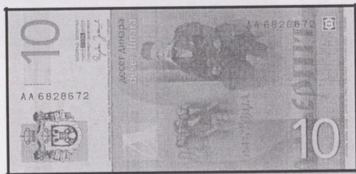
Додаток Ф. 10 югославських (вгорі) та сербських (внизу) динарів (2000, 2006) – реверс