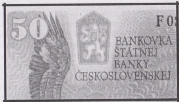
Додаток В. Герб ЧССР на банкноті 50 чехословацьких крон (1987 р. випуску)