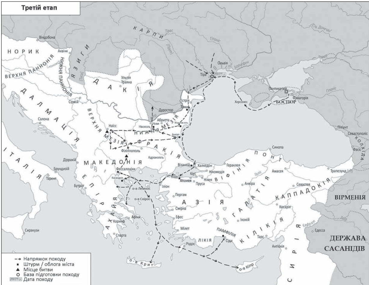
Рис. 4. Третій етап Скіфських війн (автор основи — Д. Вортман)

чоловік за інформацією Зосима (Зосим I, 44. 2). Проте перемога Риму не стала остаточною: варвари відступили у бік Македонії разом з обозом і під час відступу завдали дошкульного удару римській піхоті (Властелины. Клавд. 11, 6—7; Зосим I, 45. 2). Дещо пізніше епідемії спричинили до значних втрат у середовищі варварів на території Македонії та Фракії; з тими, що залишилися вірогідно було укладено якийсь договір — Зосим говорить, що частину їх було прийнято до римського війська, а частина отримала землю і стала землеробами (Зосим I, 46. 1—2). Після битви біля Наїса, вже на початку 270 р. якісь загони варварів спробували також захопити міста Анхіал та Нікополь, проте без успіху. Чи були це частини варварів, які відступили від Наїсу, чи інші загони залишається достеменно невідомим, хоча Полліон