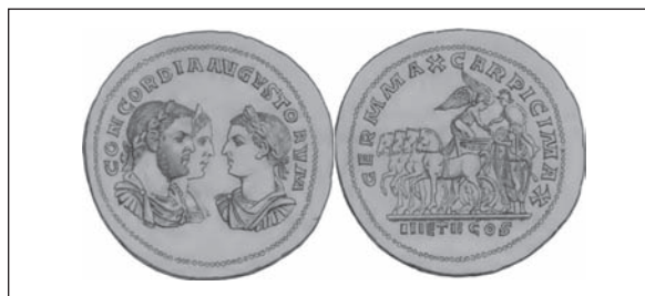
Рис. 2. Медаль Філіпа Араба. Бронза (за: Cohen 1860, Pl. IX)

3) Про наступні походи міститься інформація у творах Дексіпа та Йордана. Близько 248 р. готський король Острогота разом зі своїм племенем перейшов Дунай та зруйнував Мезію та Фракію (Йордан 90—91). Причиною нападу автор називає припинення виплат готам стипендії як римським федератам (Там само). Саме під 248 р.