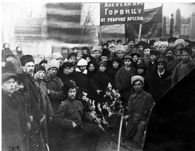
Похорон О.Горвіца, керівника Січневого повстання на заводі «Арсенал» проти Української Центральної Ради. Київ, 31 січня 1918 р.

Документальна та іконографічна збірки включають також матеріали, які висвітлюють більшовицьке Січневе повстання проти Центральної Ради в Києві 1918 р. та участь у його ліквідації Гайдамацького кошу Слобідської України на чолі з С.Петлюрою і київського формування січових стрільців під проводом Є. Коновальця. Це переважно газети, листівки, фото. Серед них – листівка – «Криваві події в Києві» 31 з детально викладеною в ній хронікою повстання, оригінальні знімки із зображенням січових стрільців 32 , листівки Гайдамацького кошу із закликом боронити рідну землю від агресії більшовицької Росії 33 тощо.