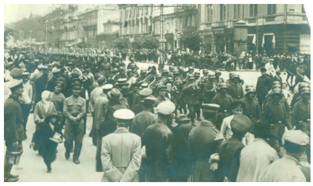
Німецькі війська марширують вулицею Хрещатик. Київ, квітень 1918 р.

імперії. Загалом, діяльність Центральної Ради за-свідчила, яким складним, болючим і суперечливим є процес становлення нової держави.