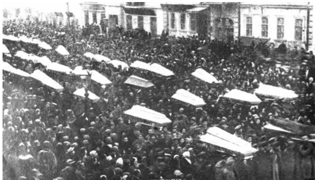
Похорон загиблих під час вуличних боїв між одеськими червоногвардійцями та українськими гайдамаками. Одеса, 18 січня 1918 р.