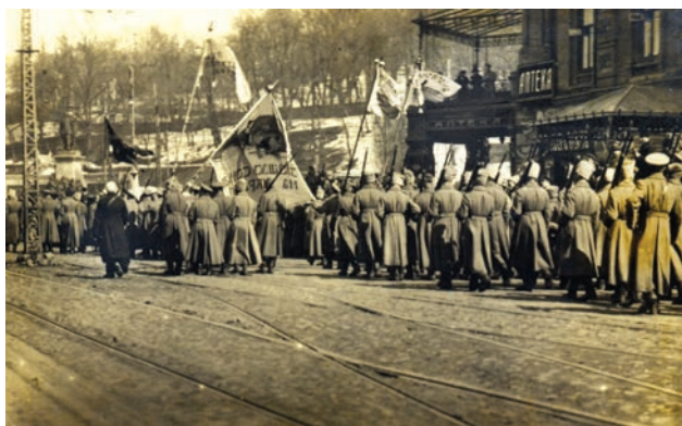
Військовики – учасники української маніфестації у Києві прямують в напрямі вул. Трьохсвятительської на Софійську площу. 19 березня 1917 р.

Більшість пам'яток даної теми належать до початкового етапу діяльності УЦР, коли всі зусилля українського політикуму спрямовувалися на вирішення справи самовизначення, визнання і закріплення за Центральною Радою статусу найвищого політичного органу в Україні. Серед тогочасних подій значний резонанс у суспільстві мала 100-тисячна українська маніфестація 19 березня 1917 р., яка проходила під національними гаслами. На жаль, у фондовому зібранні відсутній перший номер газети «Вісти з Української Центральної Ради», де найбільш докладно висвітлювалась ця подія. Однак про неї нагадують фотографії і поштівки, що входять до іконографічного фонду НМІУ й частково представлені в експозиції. Найбільш відомі серед них – зображення мітингу на Софійському майдані навколо пам'ятника Б.Хмельницькому 8 . В музеї зберігаються також інші знімки березневої маніфестації, на яких зафіксовано, зокрема, рух учасників акції по Бібіковському бульвару та Хрещатику 9 , а також по Олександрівській вулиці в напрямі Трьохсвятительської 10 . Про маршрут, яким рухались у той день колони маніфестантів у напрямі