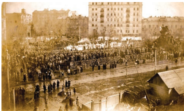
Українська маніфестація на Софійській площі у Києві. 19 березня 1917 р.

Діяльність УЦР у перші місяці революції найбільш повно відображена в згаданих вище номерах газети «Вісти з Української Центральної Ради». Це скликання Всеукраїнського національного конгресу, відрядження до Петрограда української делегації з метою домагання для України національно-територіальної автономії, проведення Всеукраїнських військових і селянських з'їздів тощо. Період квітня-червня 1917 р. можна назвати апогеєм українського руху, а Центральну Раду – найбільш впливовою силою українського політикума. Про її авторитет