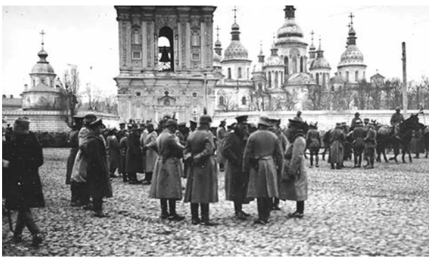
Німецькі військовики на Софійській площі у Києві. Березень 1918 р.