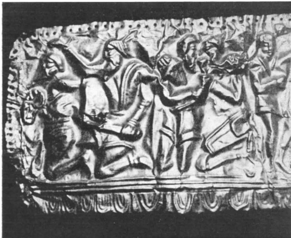
Рис. 5. Сахнівська золота пластина. Деталь.

цього персонажа складне: права — показана у фас, ліва, — трохи зігнута у коліні, — в профіль. Ліворуч від служника — група так званих побратимів, що створює немовби самостійну композицію (рис. 5). Вони п'ють з одного ритона, обіймаючись за плечі. Правий персонаж цієї групи зображений у профіль, на його лівому боці — горит з китицями, але без лука. Обличчя його пошкоджено. Ліва фігура зображена