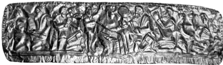
Рис. 1. Сахнівська золота пластина. Загальний вигляд.

Близький за формою до сахнівського головний убір жриці з Великої Близниці — невисокий калаф, прикрашений по всьому колу судільною золотою пластиною, що складається з 13 частин, і на якій зображені сцени так званої боротьби аримаспів з грифонами. Доповнювала його грецька стленгіда — налобник, що імітує хвилясте волосся 10 . Сюжетну композицію на сахнівській «діадемі» відділено пояском