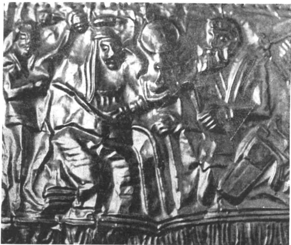
Рис. 3. Сахнівська золота пластинка. Деталь.

Богиня сидить на низькому стільці без спинки, позначеному чотирма горизонтальними лініями. З її невисокого головного убору, схожого на циліндричний калаф спускається серпанок. Обличчя з крупними ри-