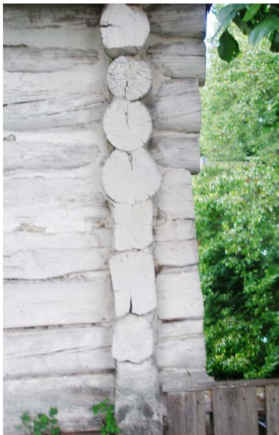
Поєднання у зрубі вінців з верхньою та нижньою «драчками». с. Кураш Дубровицького р-ну Рівненської обл.