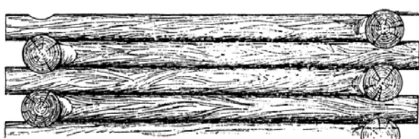
Спосіб кріплення зрубу «в іглу» (реконструкція). Росія. За: Г. Стельмахом