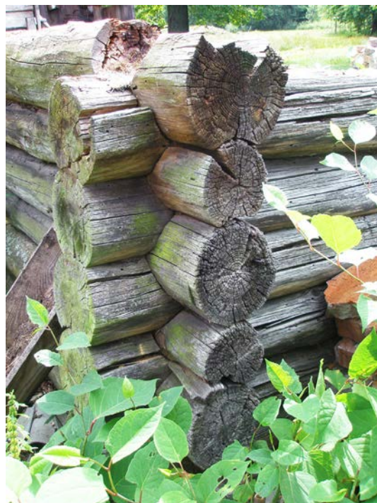
Зруб з колод з верхньою односторонньою овальною чашкою. с. Лобна Любешівського р-ну Волинської обл.