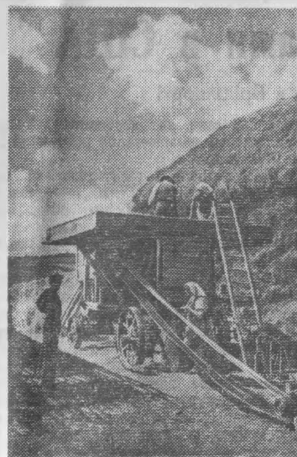
У колгоспі ім. 1 Травня, Чортківського району, Тернопільської області, успішно проходять електромотобуду. Електроенергія подається з колгоспної гідроелектростанції.

О. Омельник, Онуфрійського району, на Кіровоградщині.